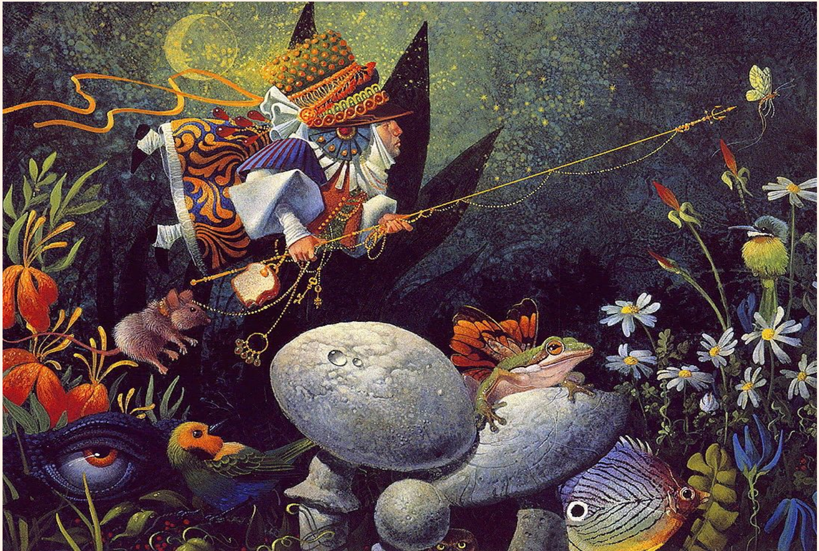
«The forest fisherman» (Лесной рыбак)