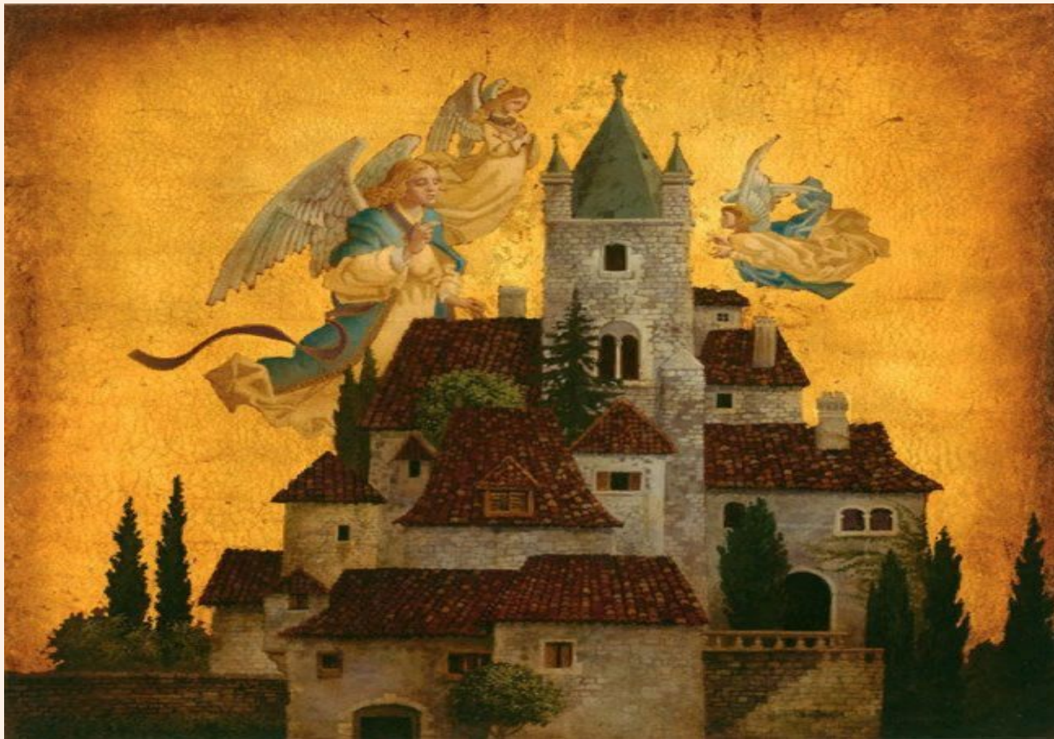
Angels of my village (Ангелы моего городка)