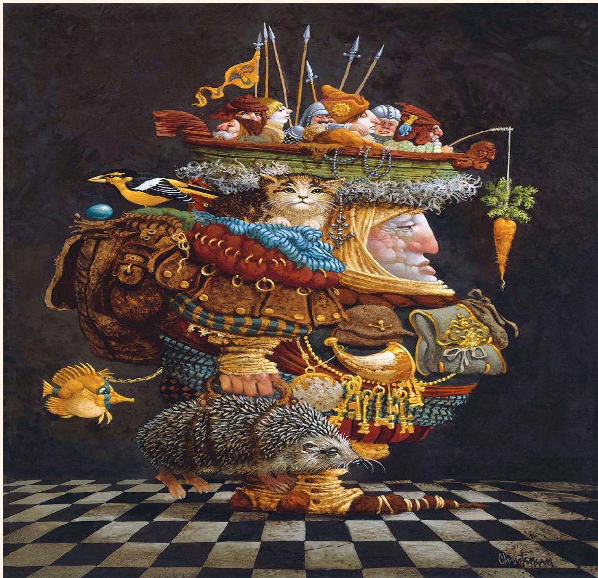
«The Burden of the Responsible Man» (Бремя ответственного человека).