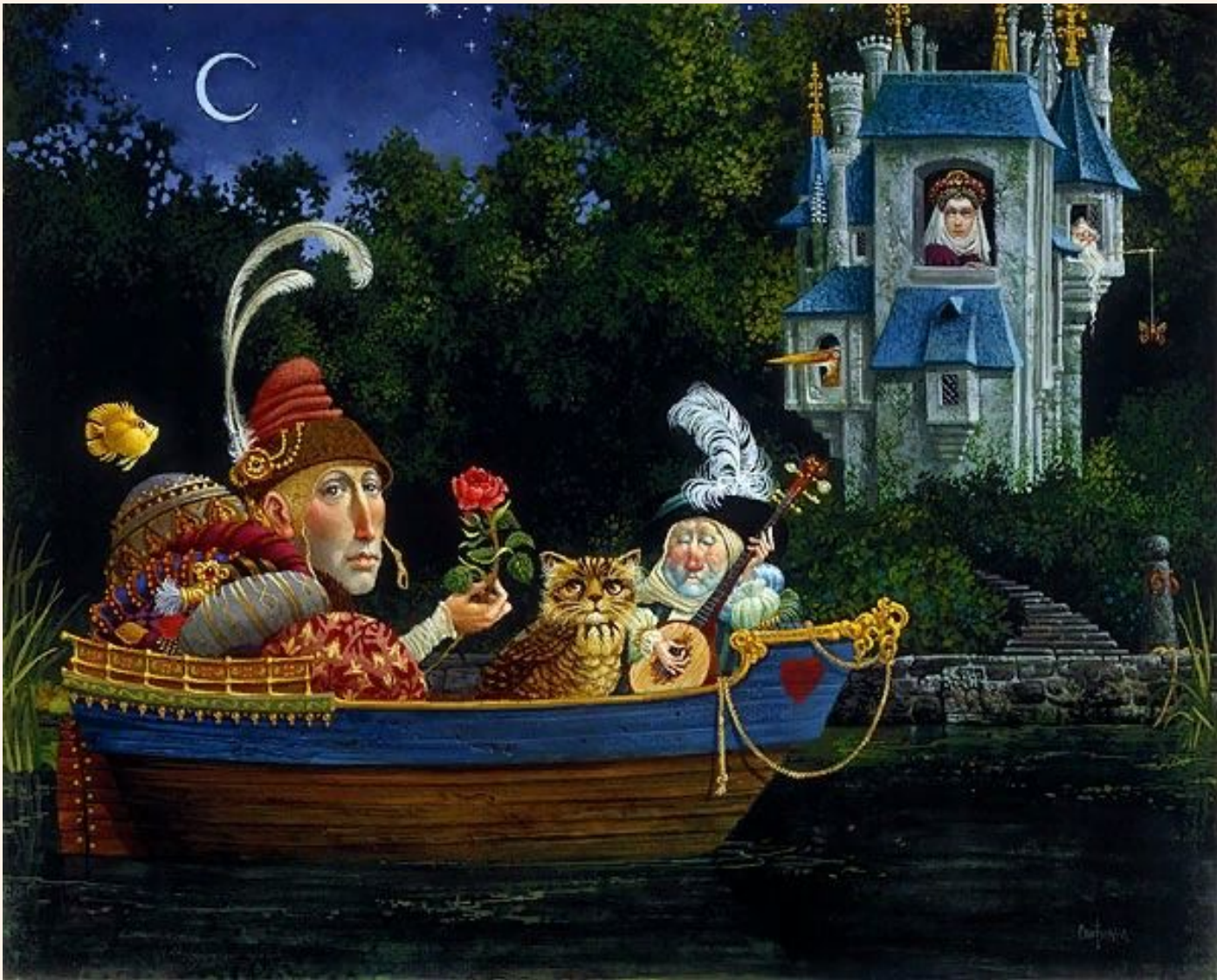
"Courtship " (Ухаживание)