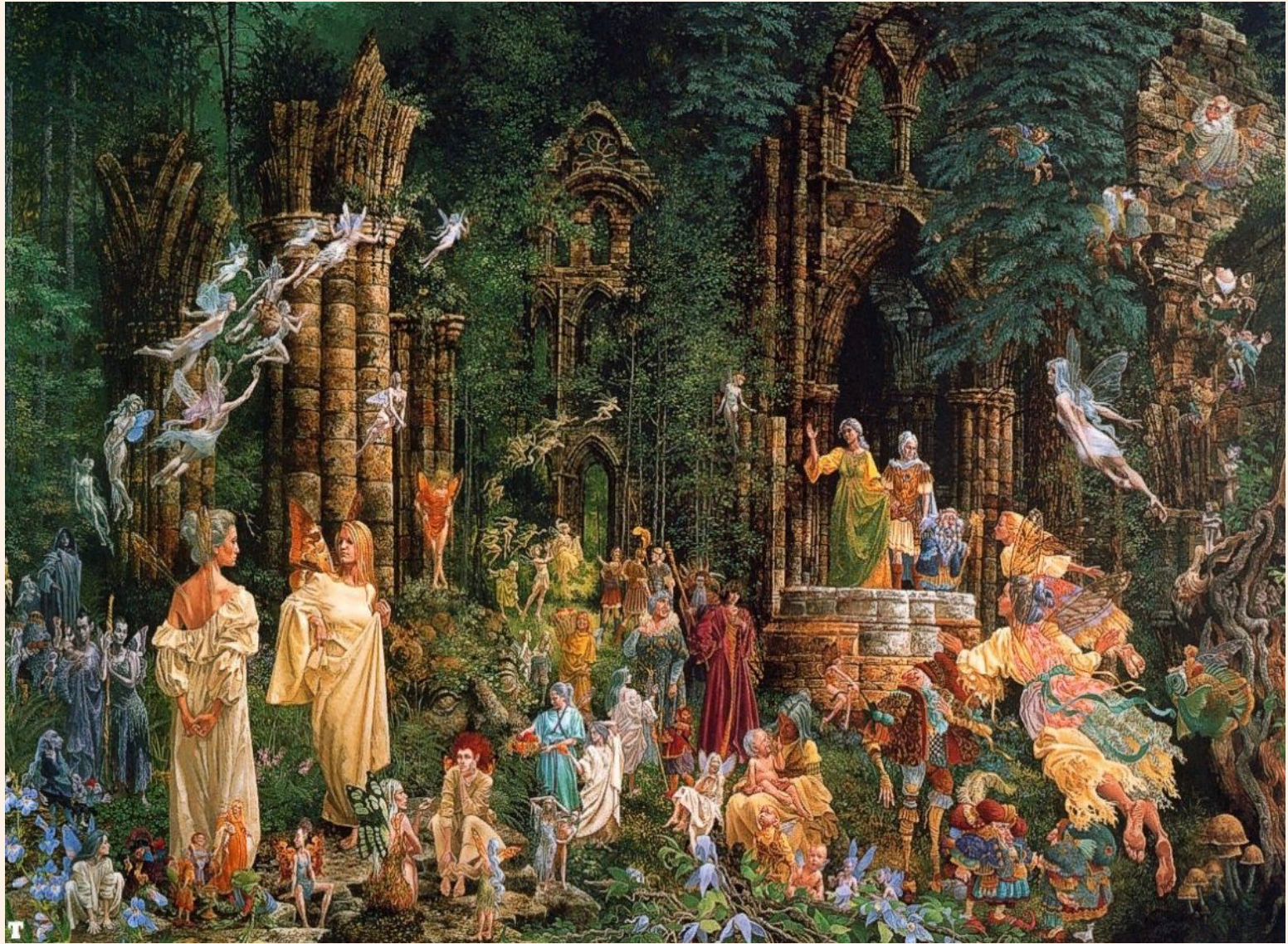
«Court of the Faeries from Voyage of the Basset» (Двор фей. из книги "Путешествие Бассета")