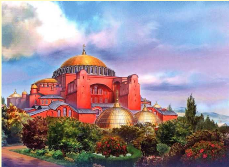
“Софийский собор в Константинополе”.

Стремление византийцев приводить любую форму к божественному символу обусловило появление и утверждение христианской архитектурной символики, которая принята и сегодня. Четыре стены под одной крышей символизируют четыре стороны света под покровительством единой церкви.