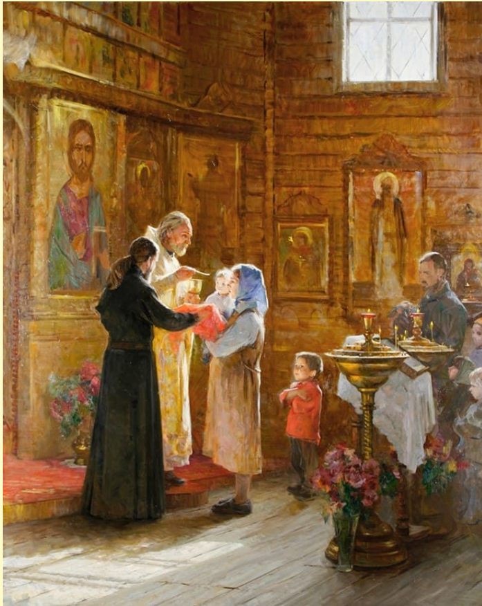
"Причастие". А.Косничев. 2009г.

Византийское искусство перестало отражать видимый и осязаемый мир, как в античности. Оно превратилось в сложное символическое средство общения с Богом на земле. В храме, когда верующий слушал песнопения, обонял фимиам, смотрел на мозаики, иконы, утварь, облачения священников, воспринимал слова божественной литургии и приобщался к таинству евхаристии, ему открывался путь к Богу.