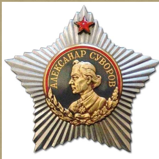
Орден Суворова, им награждали вовремя Великой Отечественно й войны