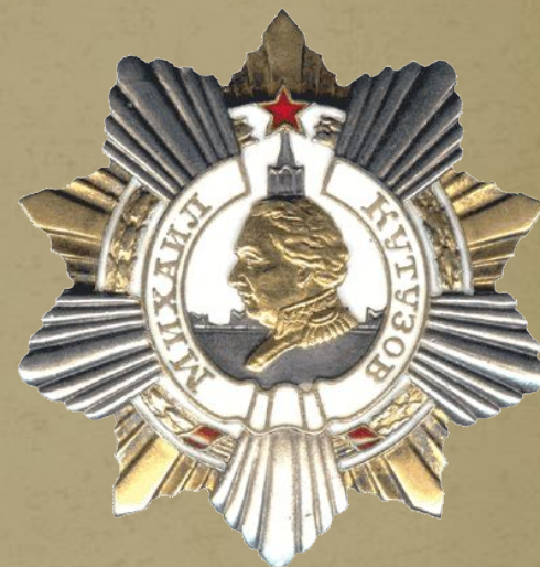
Орден Кутузова, им награждали вовремя Великой Отечественной войны