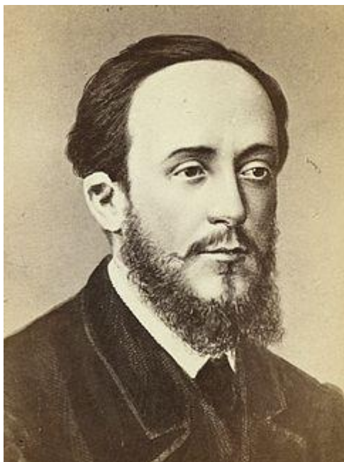
Дмитрий Иванович Писарев (1840-1867)