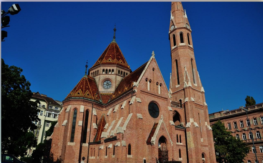
Церковь в Будапеште

В 1598 Генрих издал Нантский эдикт - указ о веротерпимости, по которому официальной религией Франции остался католицизм, но гугеноты уравнены в правах с католиками, им было разрешено совершать богослужения везде, кроме Парижа. В качестве гарантии исполнения эдикта гугеноты получили Ла-Рошаль и другие города на юге страны.