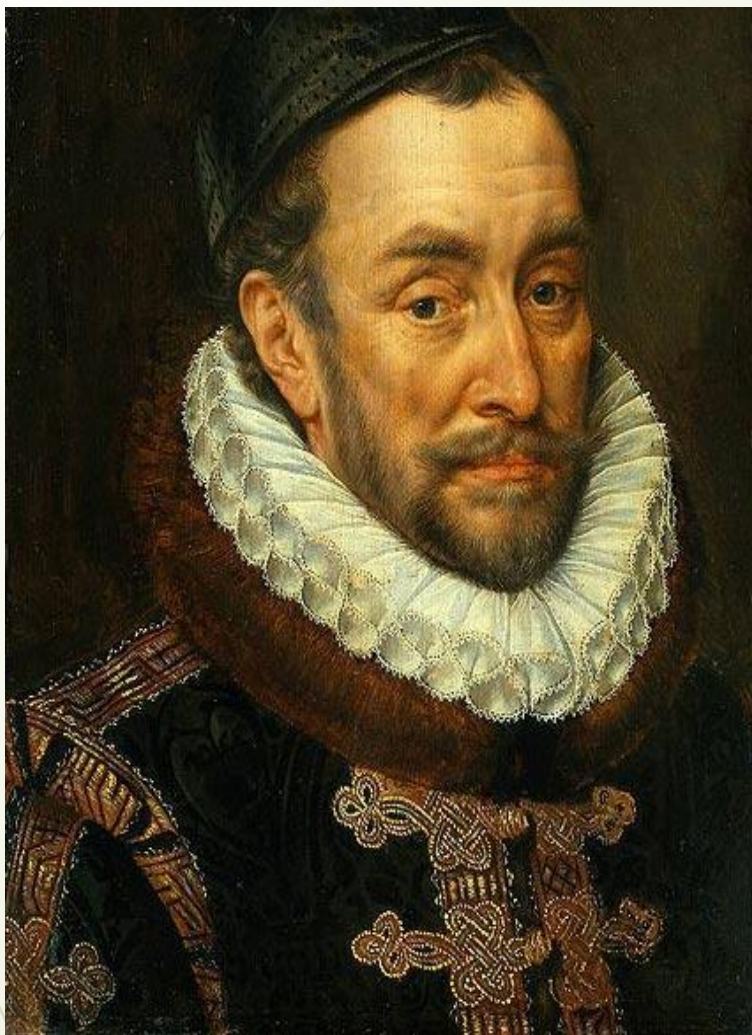
Вильгельм Оранский (1533-1584)

Против национального угнетения вспыхивали восстания. Акции неповиновения кальвинистов.