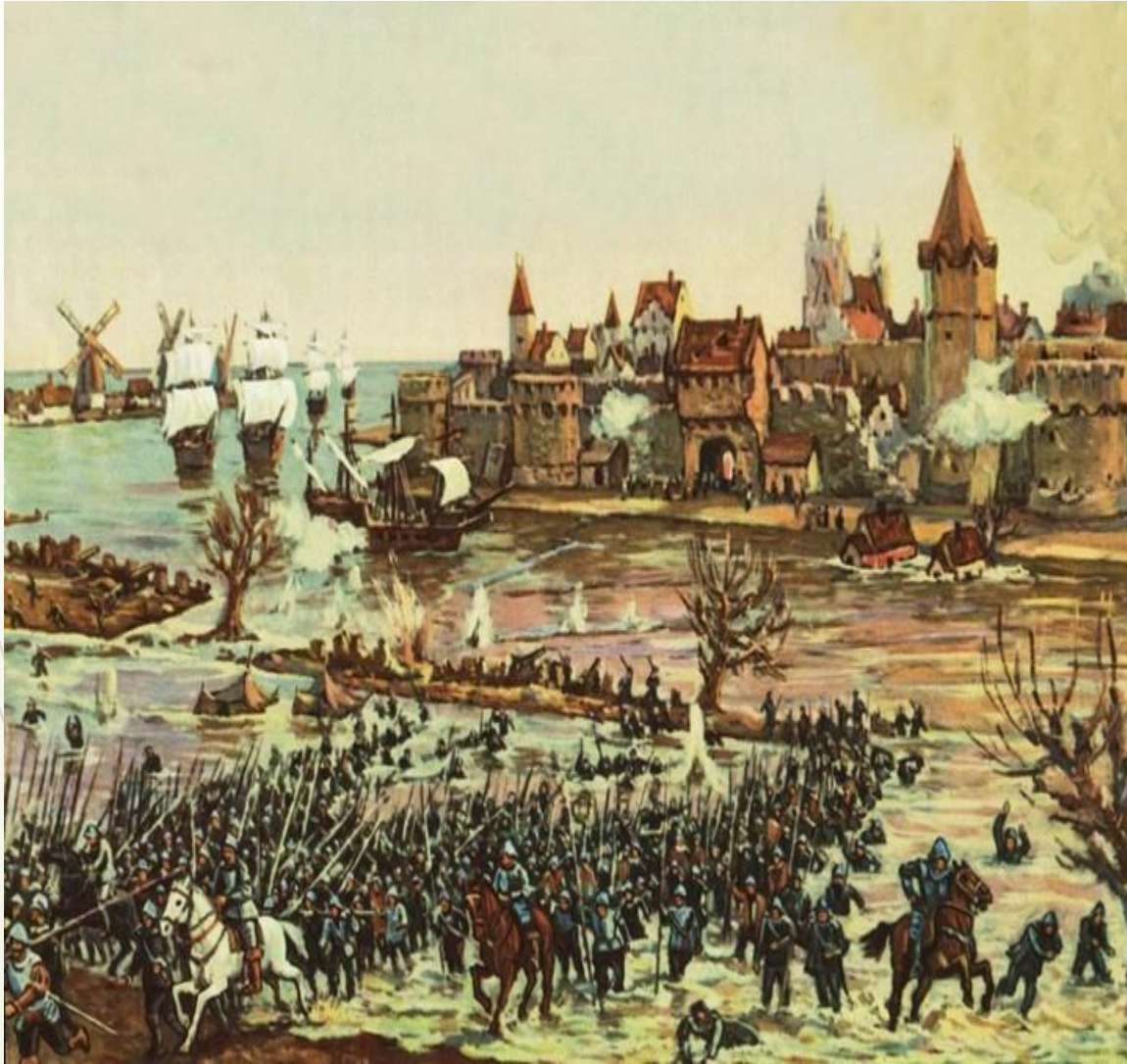
Освобождение Лейдена гёзами

1572г. – началась испано-нидерландская война .