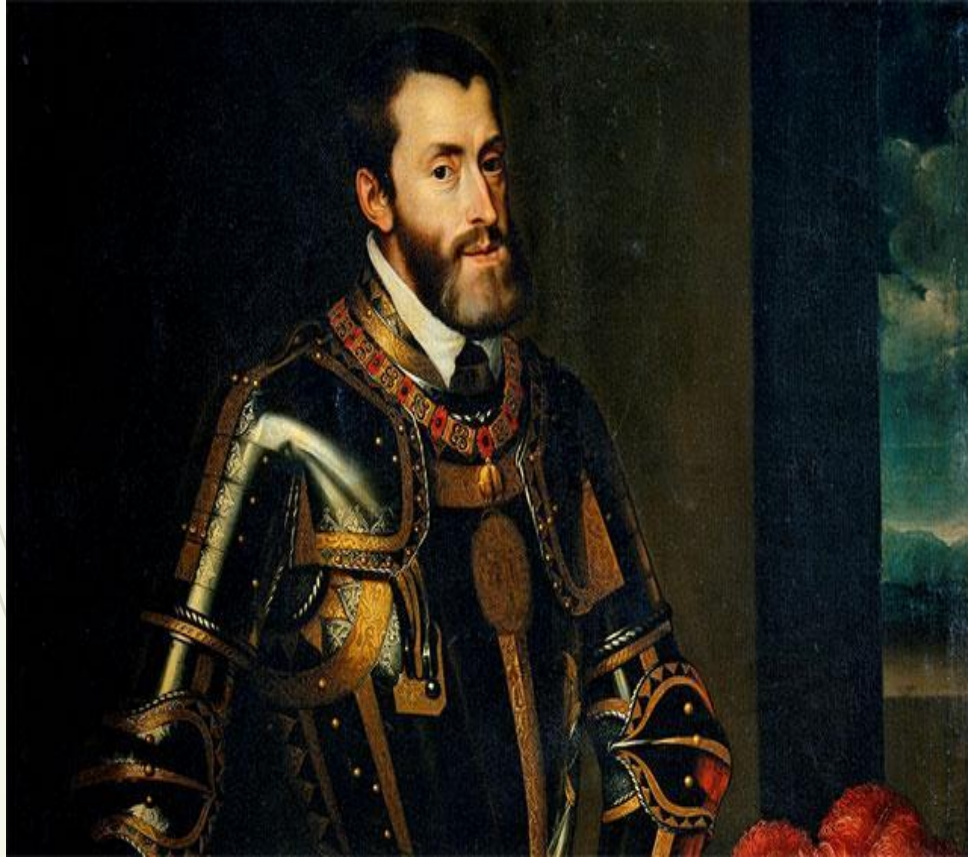
Император Карл V

В государстве сохранялось деление на провинциальные штаты.