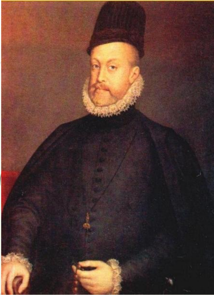
Филипп II Испанский

После Карла Нидерланды перешли к его сыну - Филиппу II Испанскому .