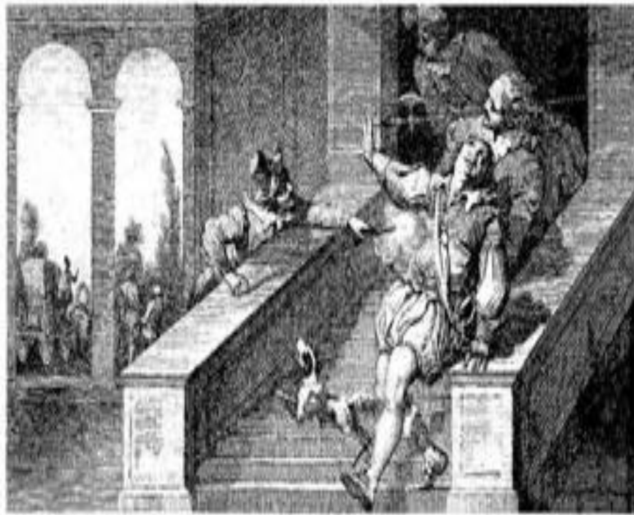
Убийство В. Оранского Б.Жераром

В XVIIв. Голландия стала самой экономически развитой страной в Европе.