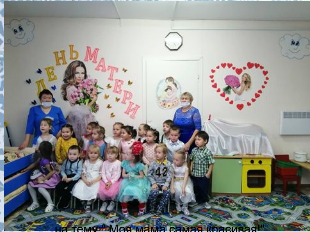
на тему: «Моя мама самая красивая!»