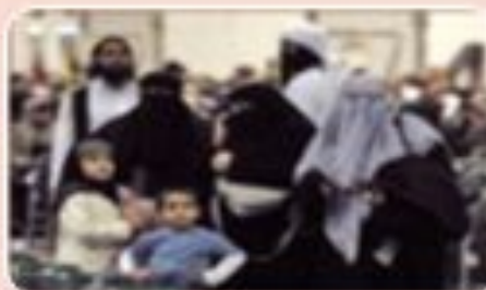
Мусульман ство (ислам)