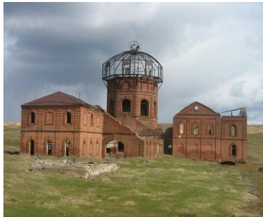
2008 год