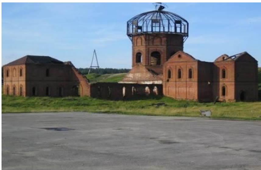
2008 год