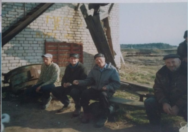
во время перерыва работ СПК и Верный путь у мастеров