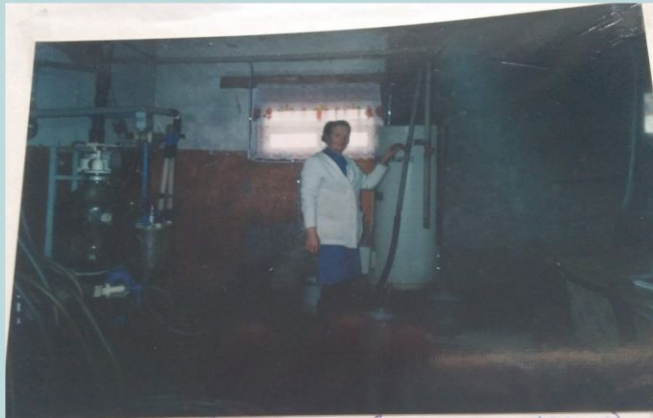
Т.А. - заведующая фермой