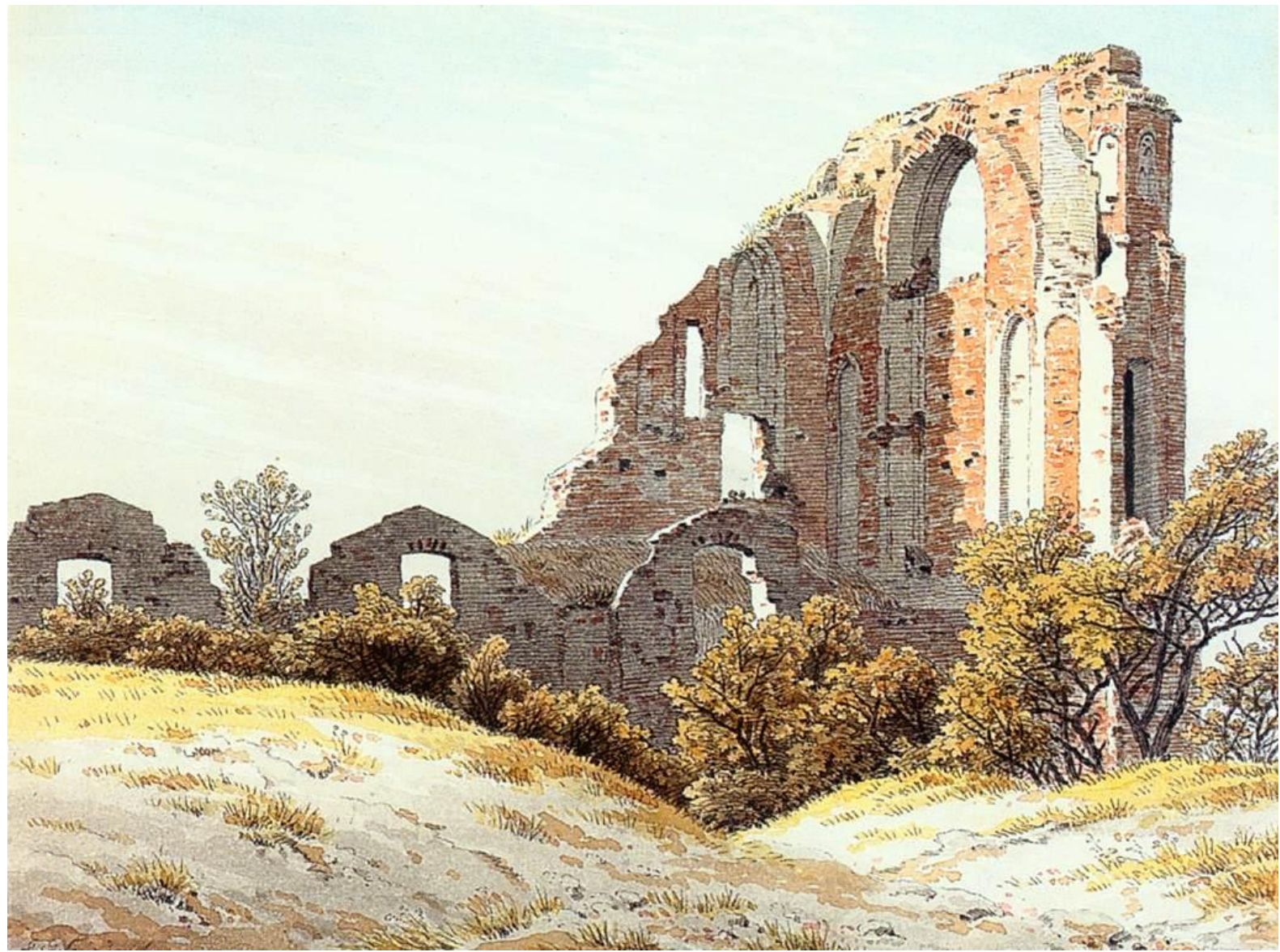
Каспар Дэвид Фридрих «Руины монастыря»