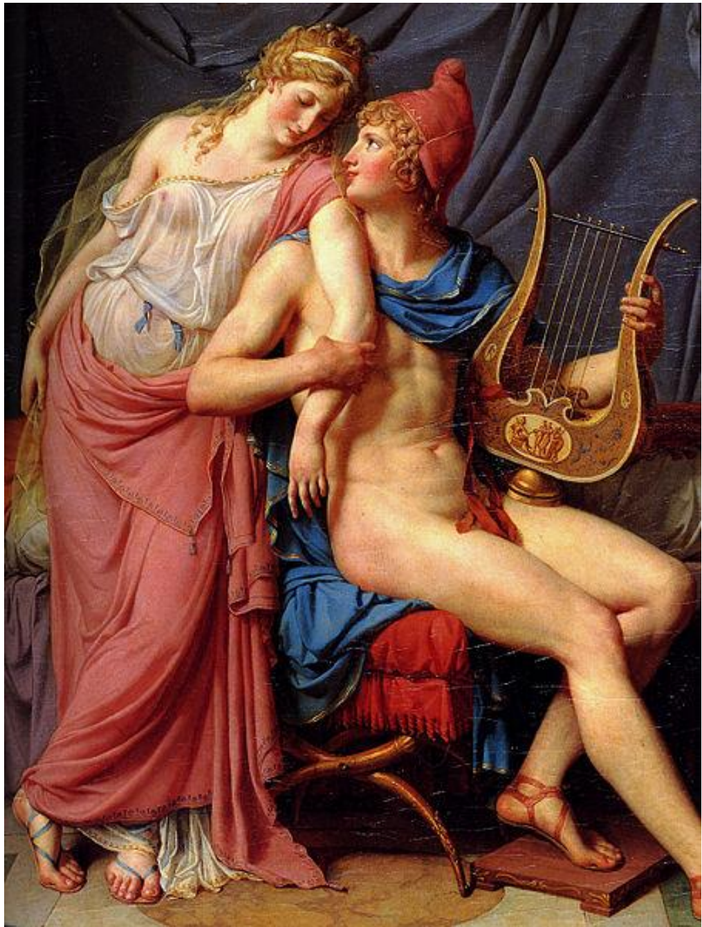
Жак Луи Давид «Парис и Елена»