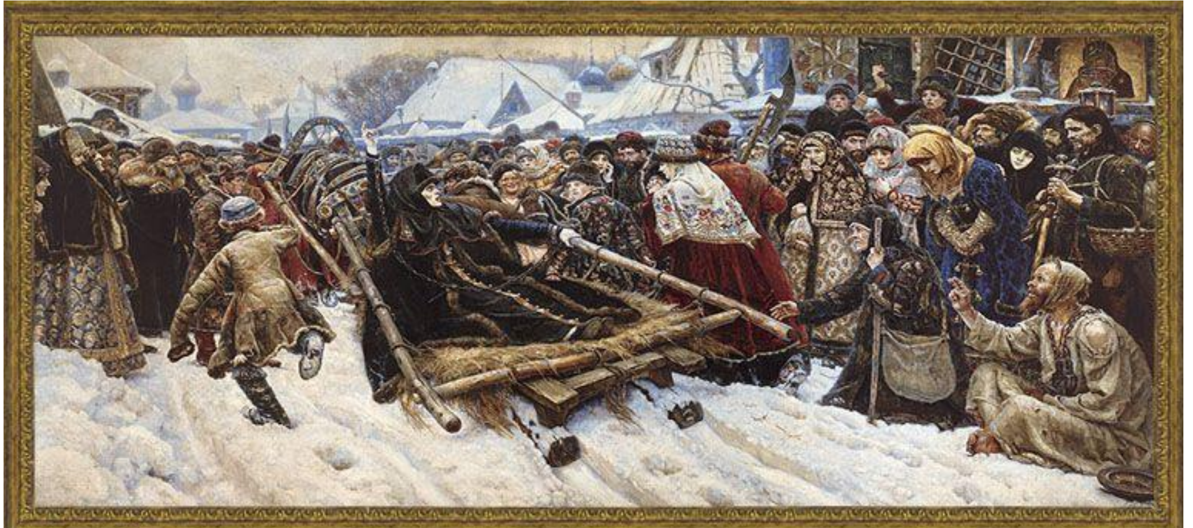
В.И. Суриков «Боярыня Морозова»

Исторический — один из основных жанров изобразительного искусства, посвященный историческим событиям прошлого и современности, социально значимым явлениям в истории народов.