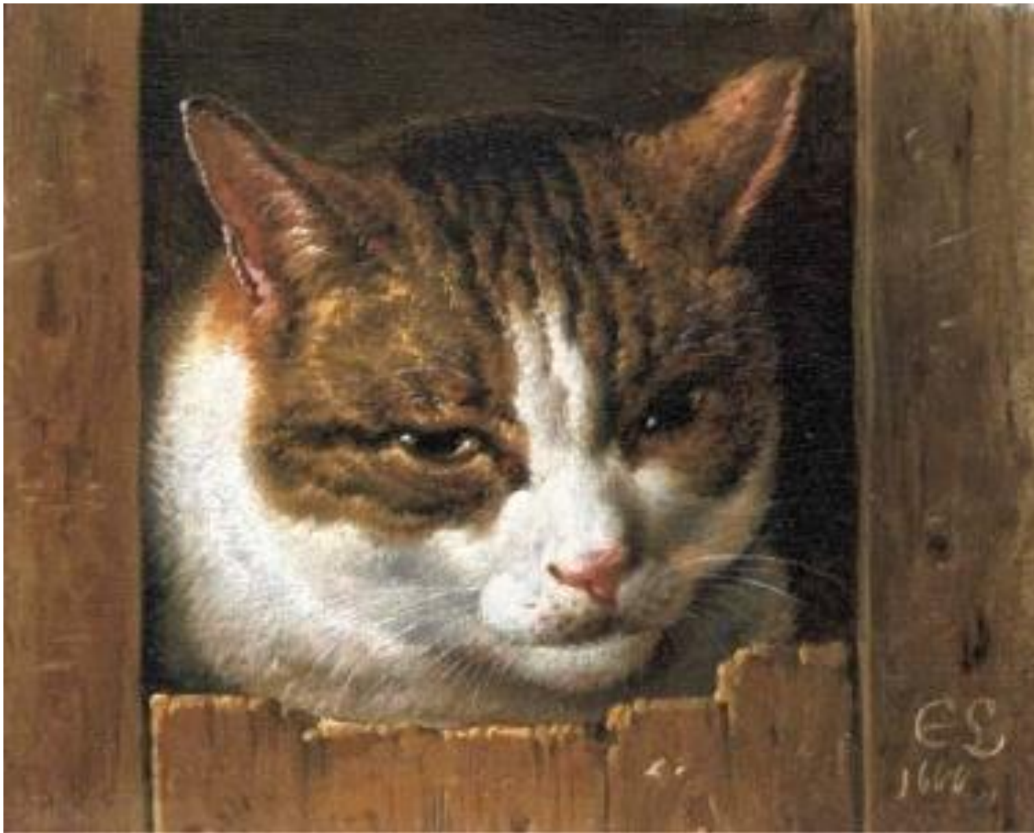
Корнелис Сафтлевен «Кот, смотрящий через забор» (tromp l'œil)