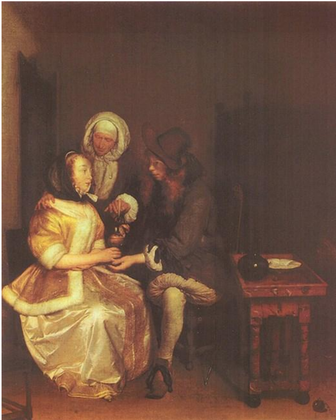
Терборх Герард «Стакан лимонада»