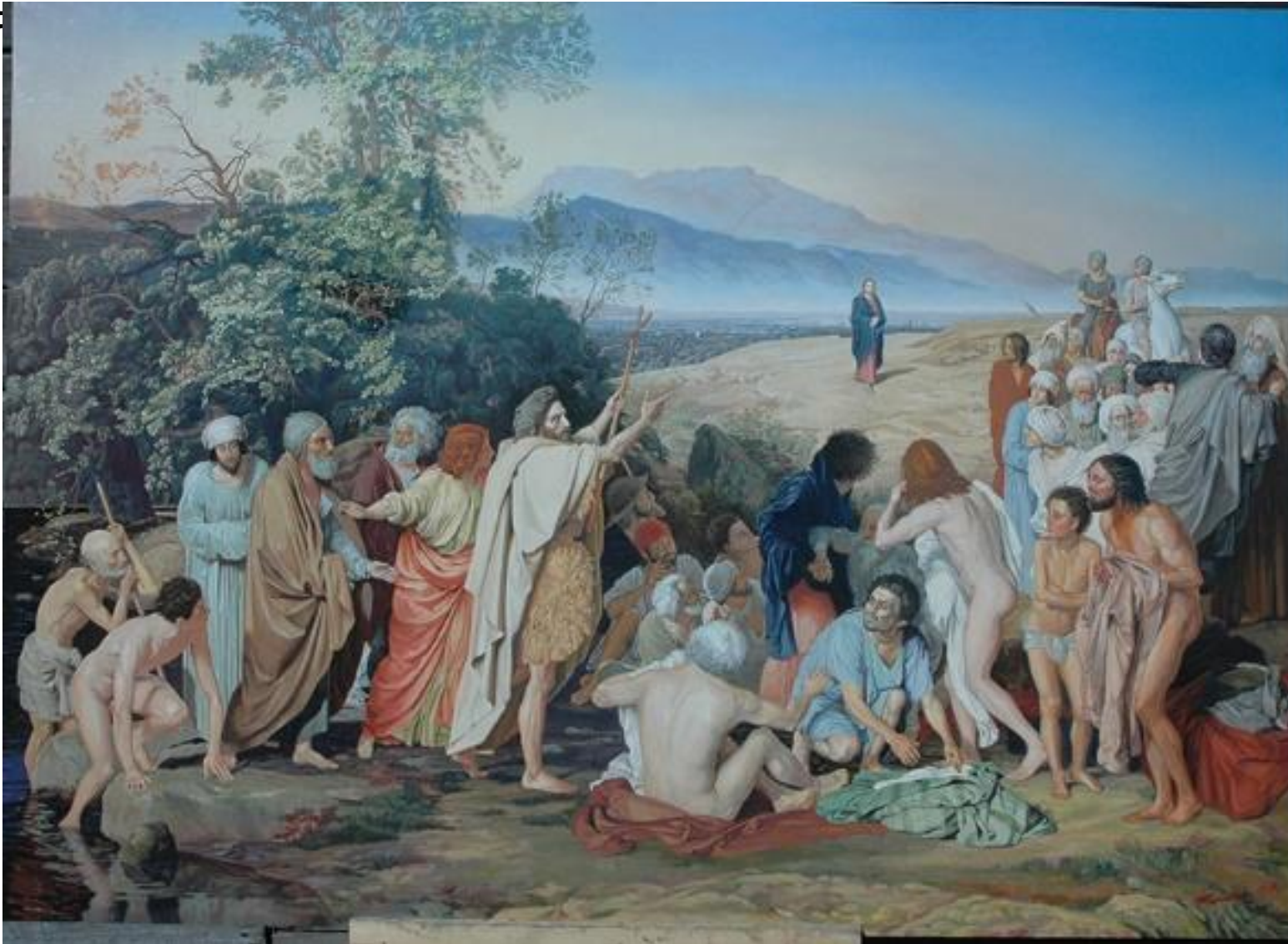
Александр Андреевич Иванов «Явление Христа народу»

Религиозный жанр, религиозная живопись — жанр изобразительного искусства, основными элементами которого являются эпизоды из Библии и Евангелия