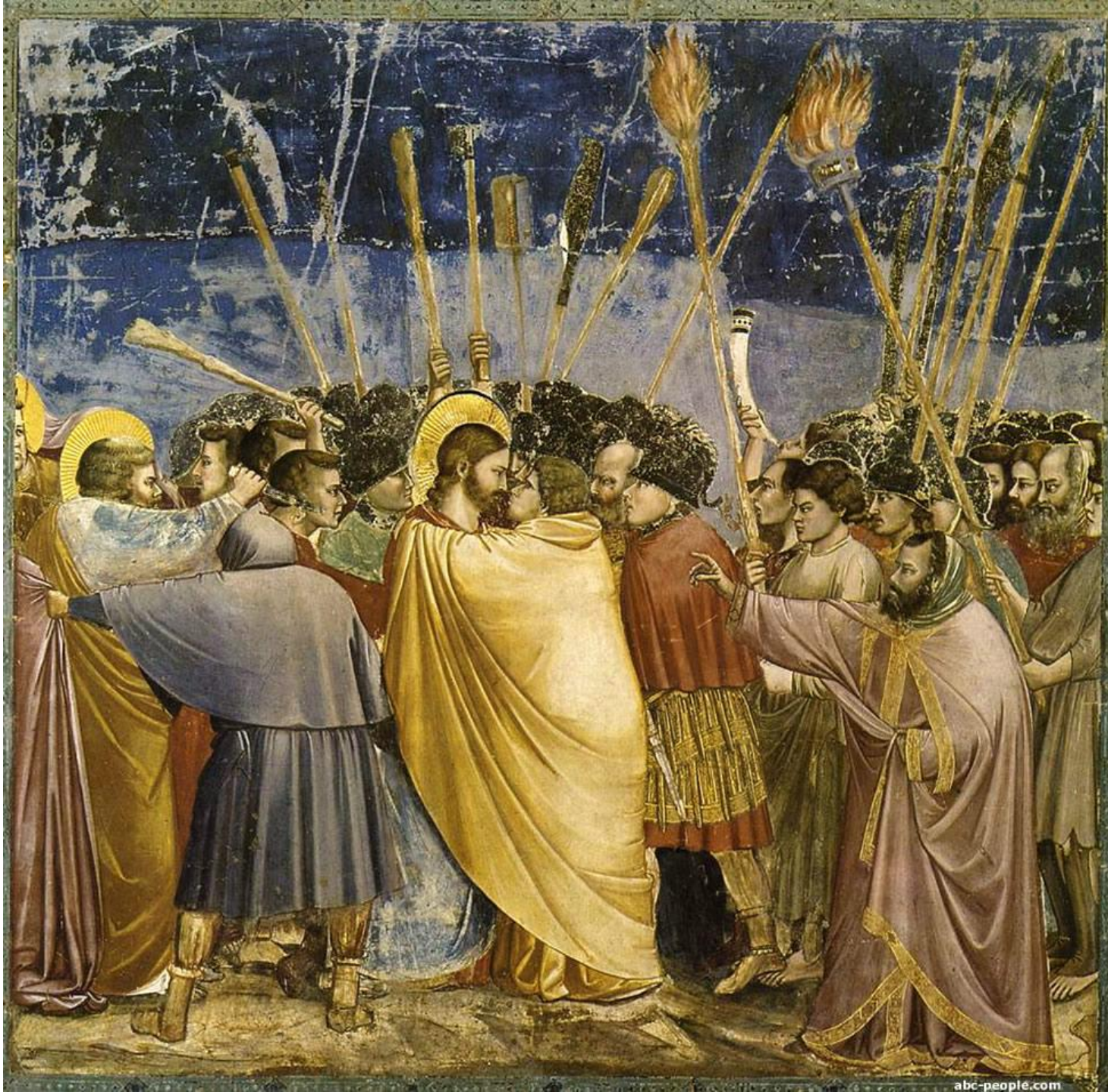
Джотто. «Поцелуй Иуды»