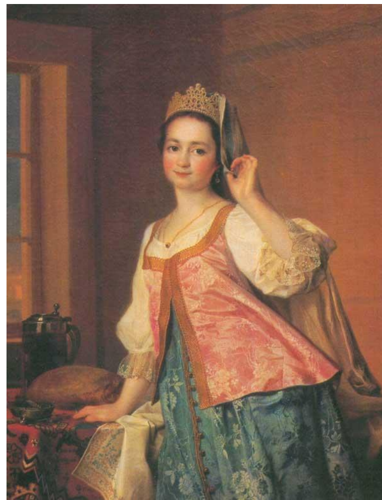
Д.Г. Левицкий. «Портрет дочери Агаши»