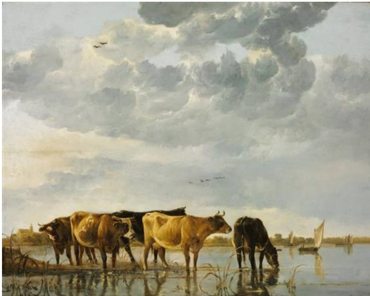
Альберт Якобс Кёйп. «Коровы в реке»