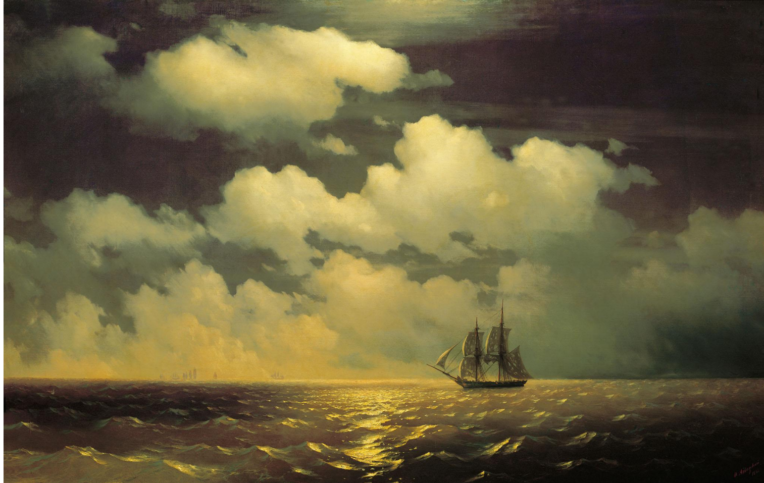
Иван Айвазовский «Бриг «Меркурий»

По предмету изображения выделяют архитектурный, индустриальный пейзаж, марину, исторический и фантастический пейзаж.