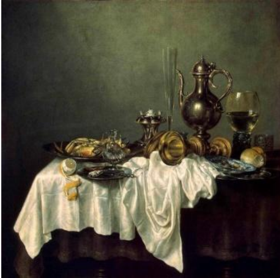
Виллем Клаас Хеда «Завтрак с крабом»

Натюрморт — жанр изобразительного искусства, показывающий неодушевленные предметы, размещенные в реальной бытовой среде и организованные в определенную группу; картина с изображением предметов обихода, цветов, плодов, битой дичи, выловленной рыбы