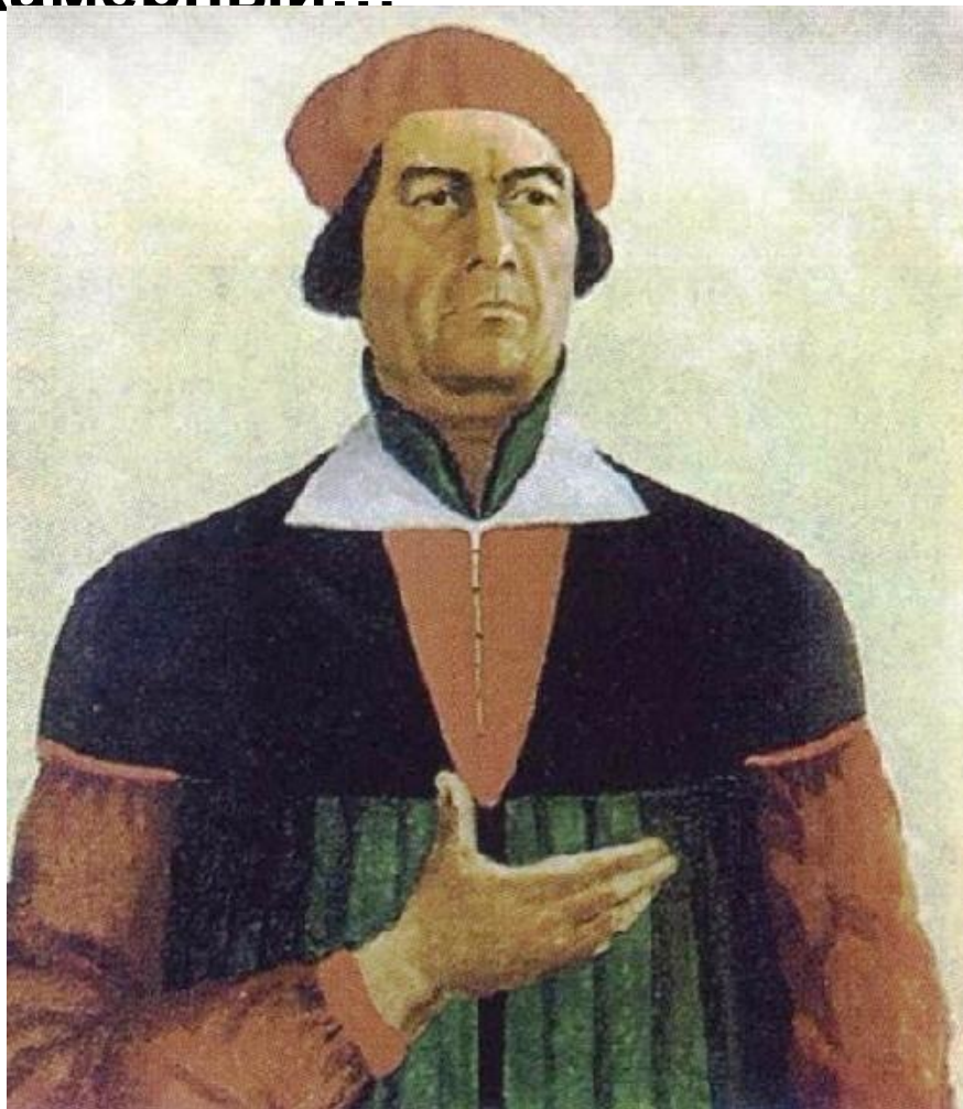
Казимир Малевич. Автопортрет