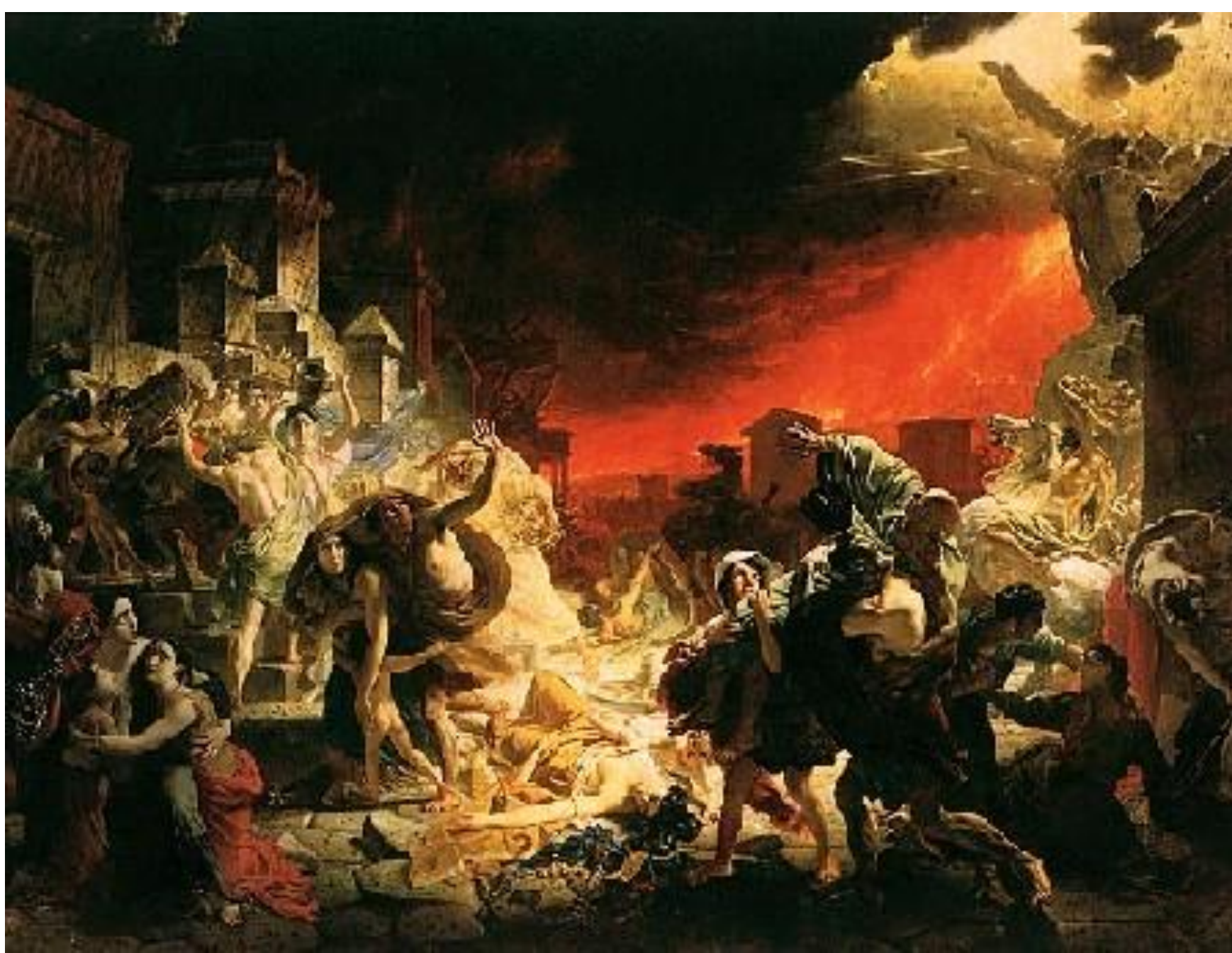
Карл Брюллов «Последний день Помпеи»