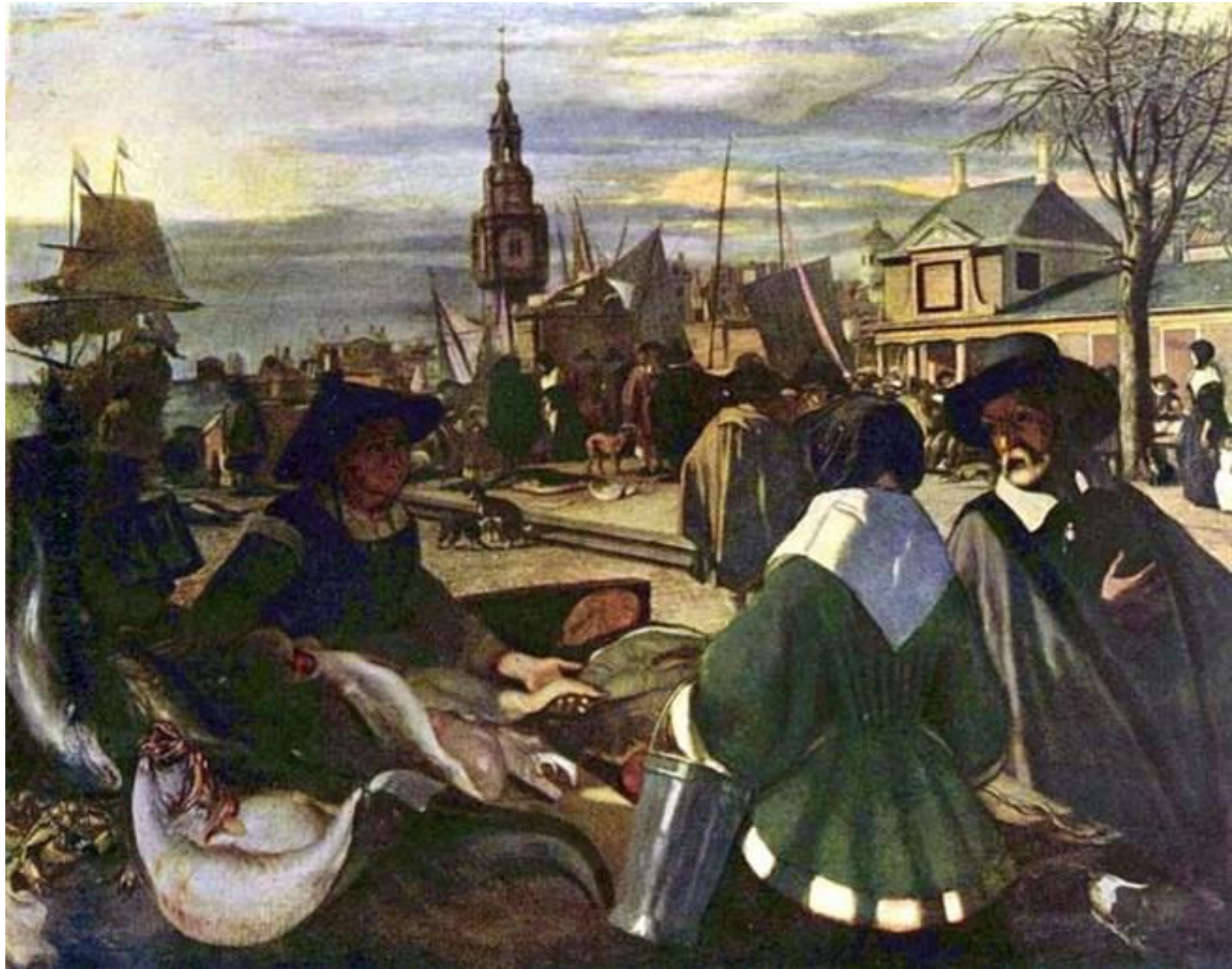
Эмманюэль Витте «Рынок в порту»

Бытовой — связанный с изображением м повседневной частной и общественно й жизни человека.