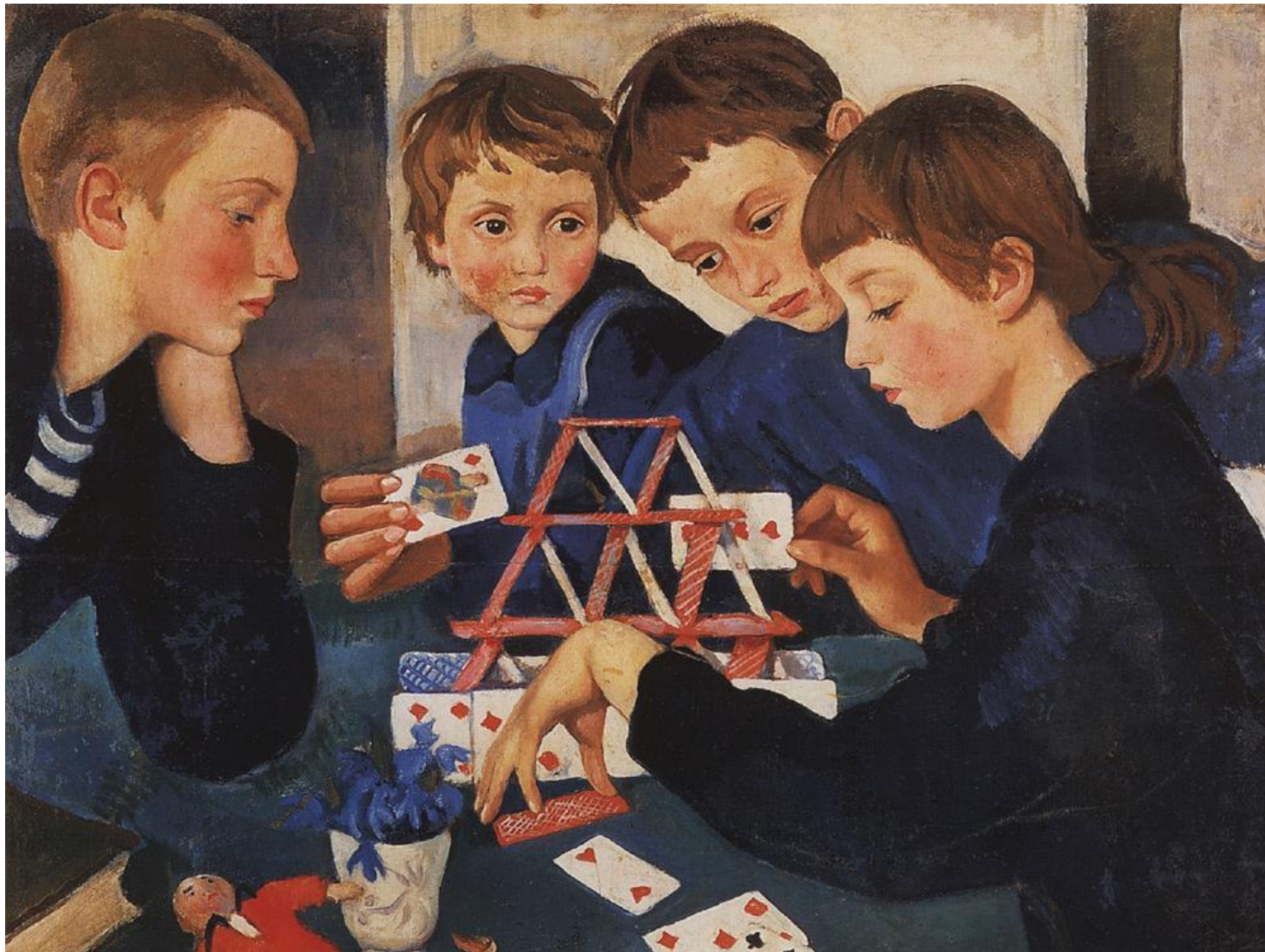
Зинаида Серебрякова «Карточный домик»