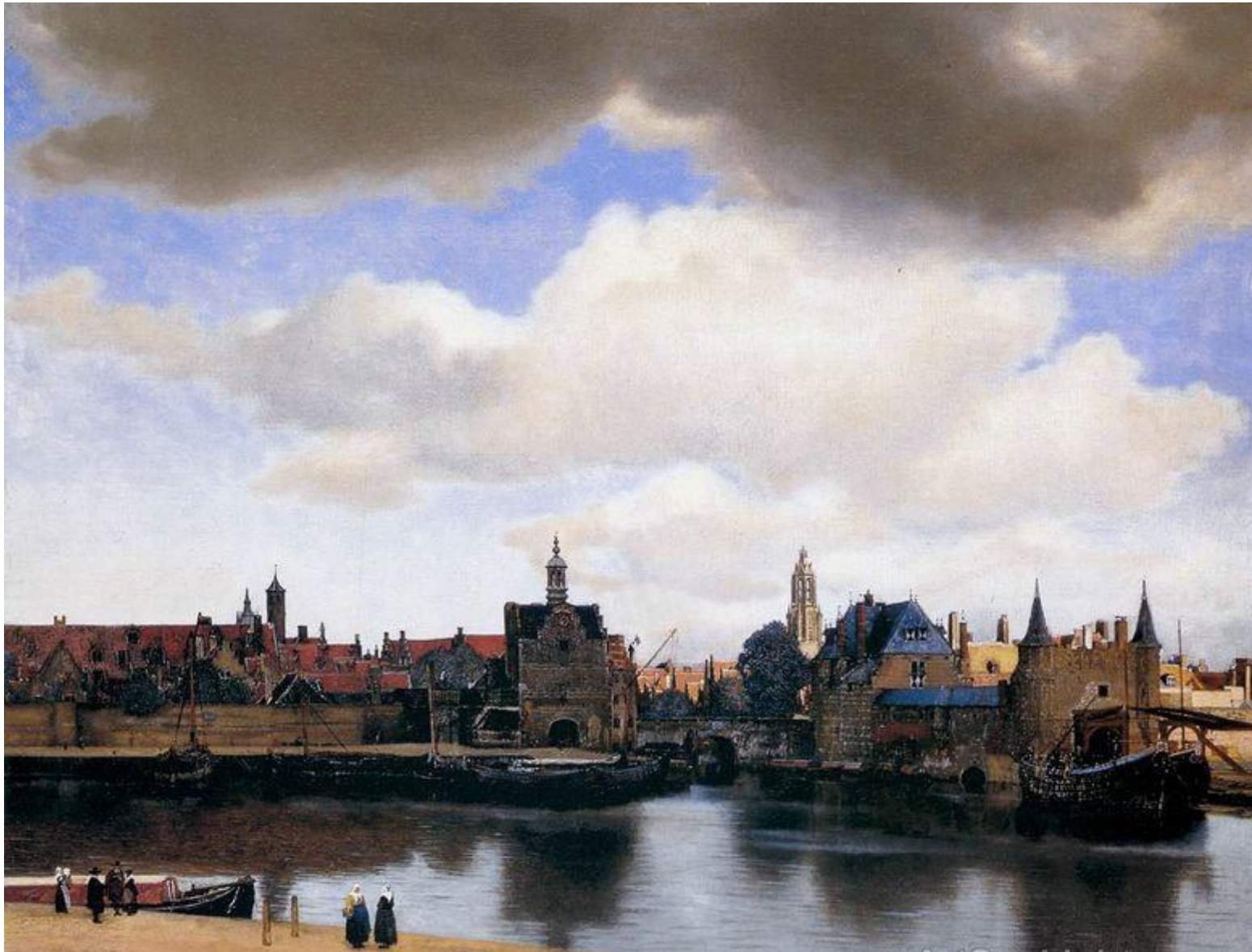
Ян Вермеер «Вид Делфта»