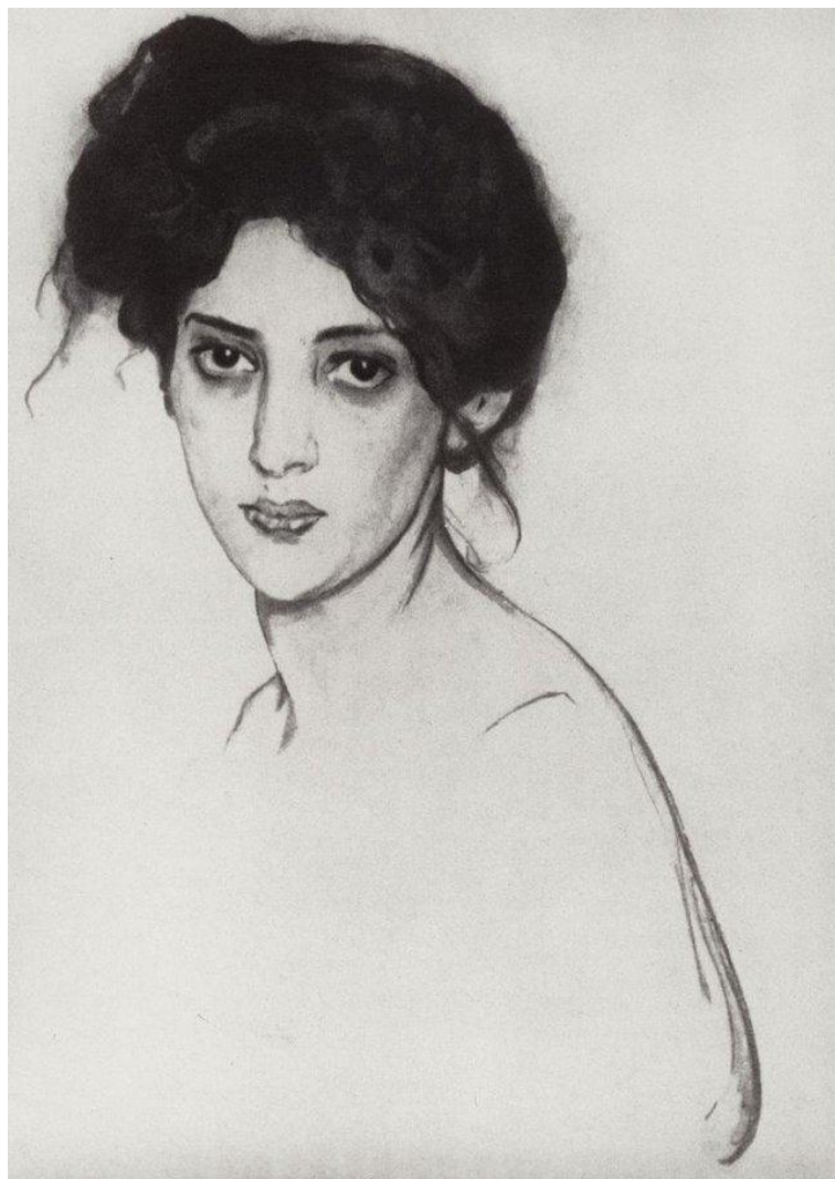
Валентин Серов И.Ю. Грюнберг