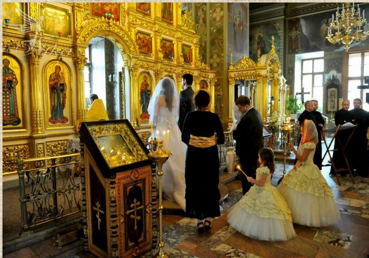
Обычаи, традиции, культура русского народа.