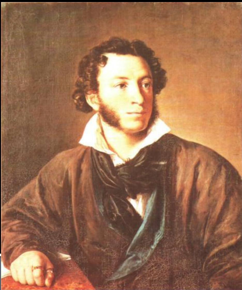
В.Тропинин.ПОРТРЕТ А. С.ПУШКИНА