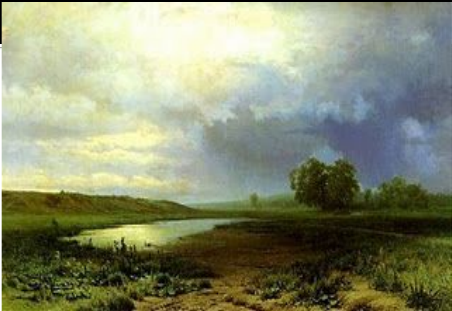
Ф.Васильев. МОКРЫЙ ЛУГ.