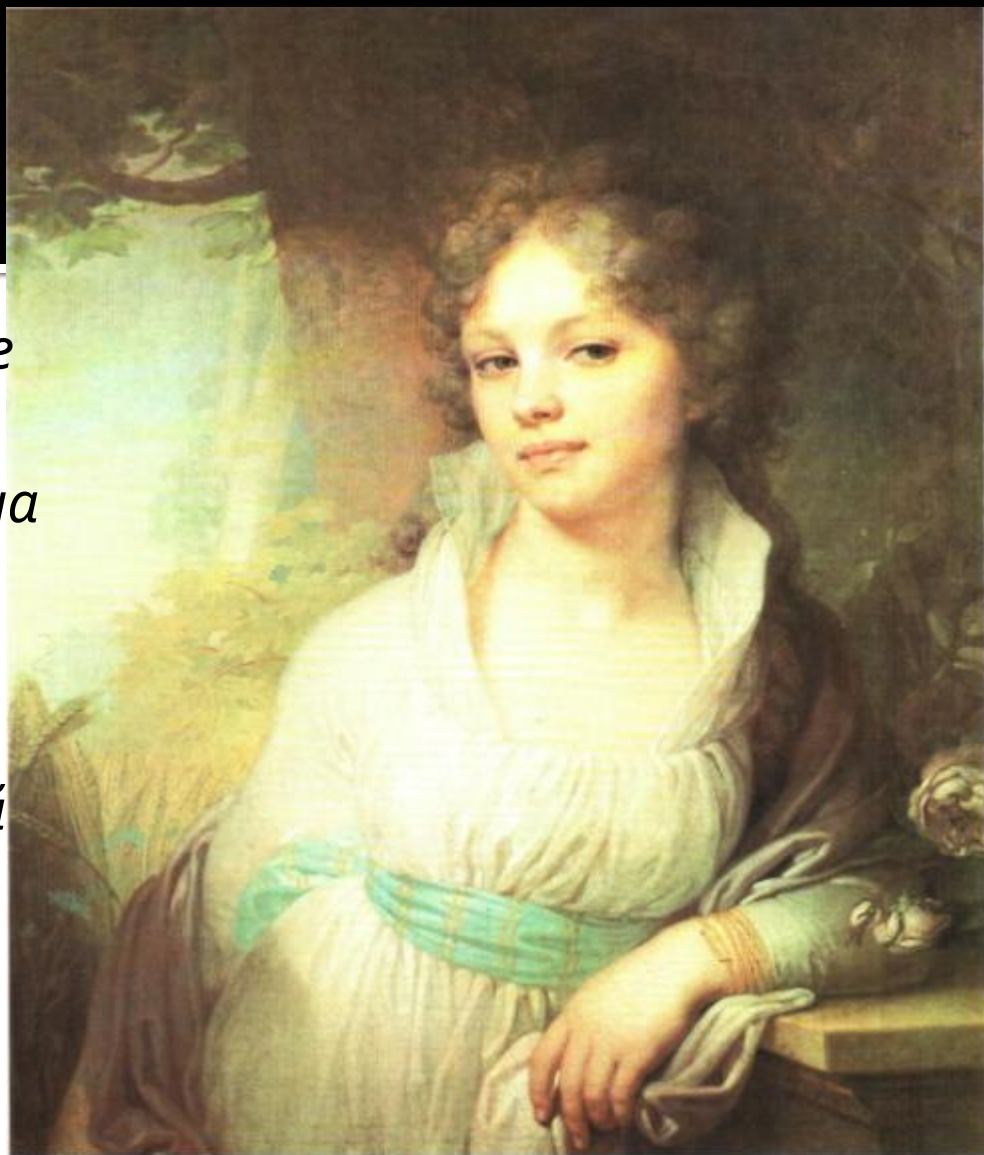
В.Боровиковский. ПОРТРЕТ ЛОПУХИНОЙ.