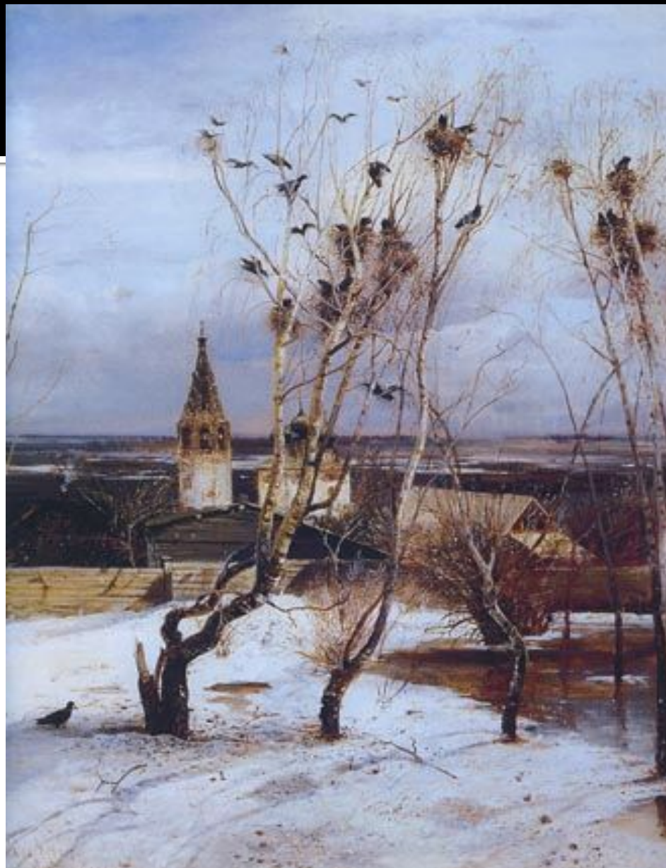
А.Саврасов. ГРАЧИ ПРИЛЕТЕЛИ.