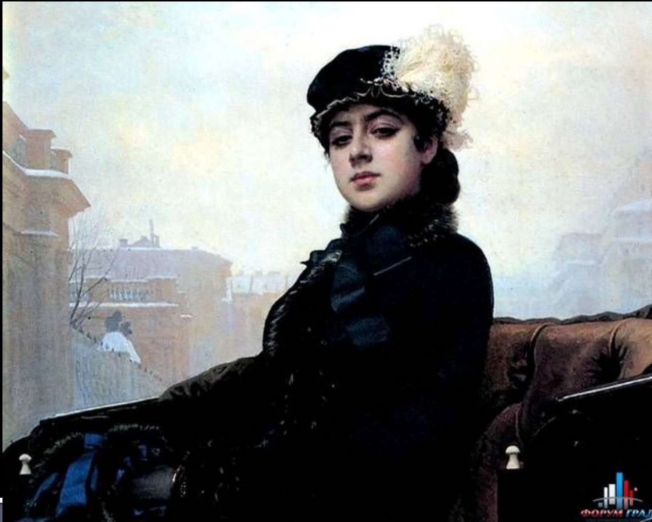
И.Н.Крамской. Портрет неизвестной