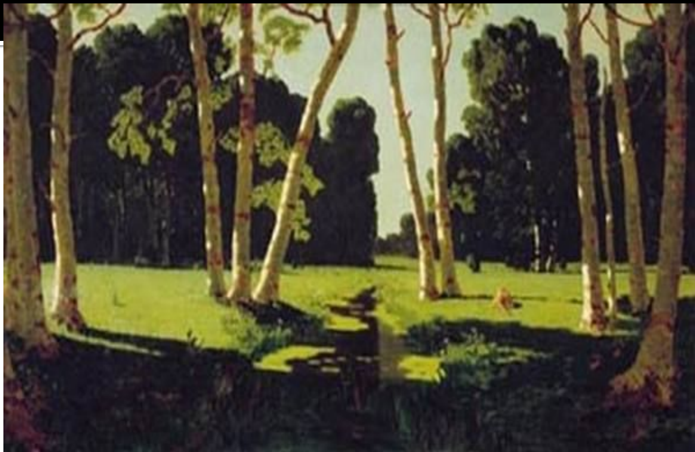
А.Куинджи. БЕРЁЗОВАЯ РОЩА.