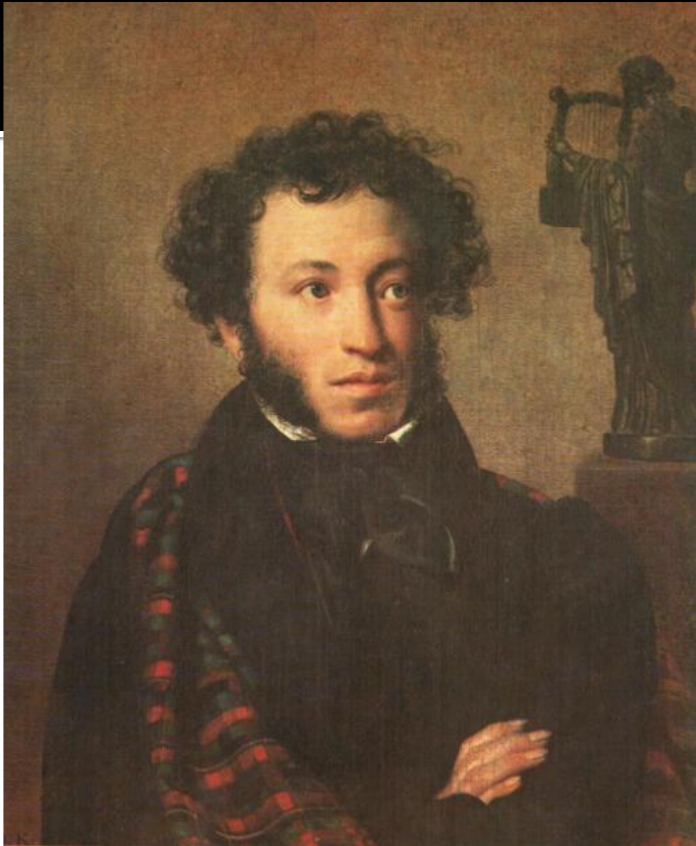
О.Кипренский. ПОРТРЕТ А.С.ПУШКИНА.