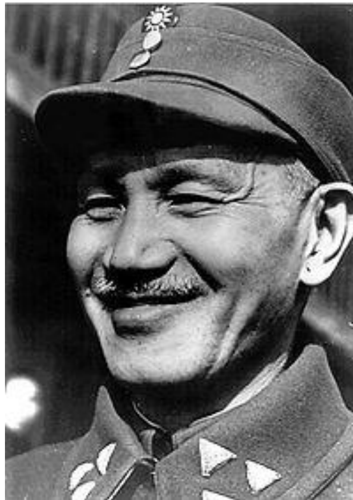
Чан Кайши 31 октября 1887 — 5 апреля 1975

Режим Чан Кайши имел определенные преимущества. Он контролировал большую часть территории страны (76 %), имел многочисленную армию, оснащенную при поддержке США (ок. 4,3 млн человек). Гоминьдан поддерживали провинциальные магнаты, ростовщики и помещики.