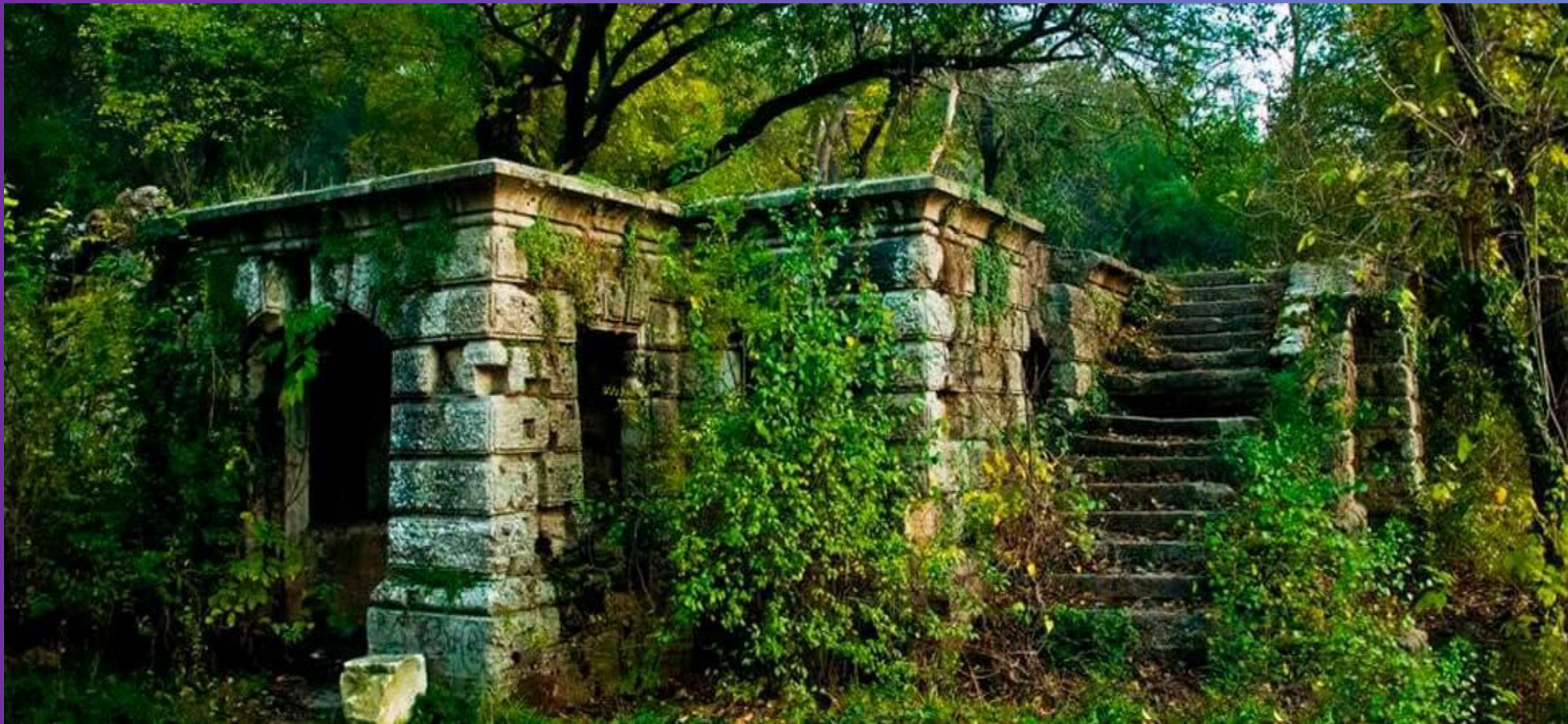
ЗАПОВЕДНИК «МАКСИМОВА ДАЧА»