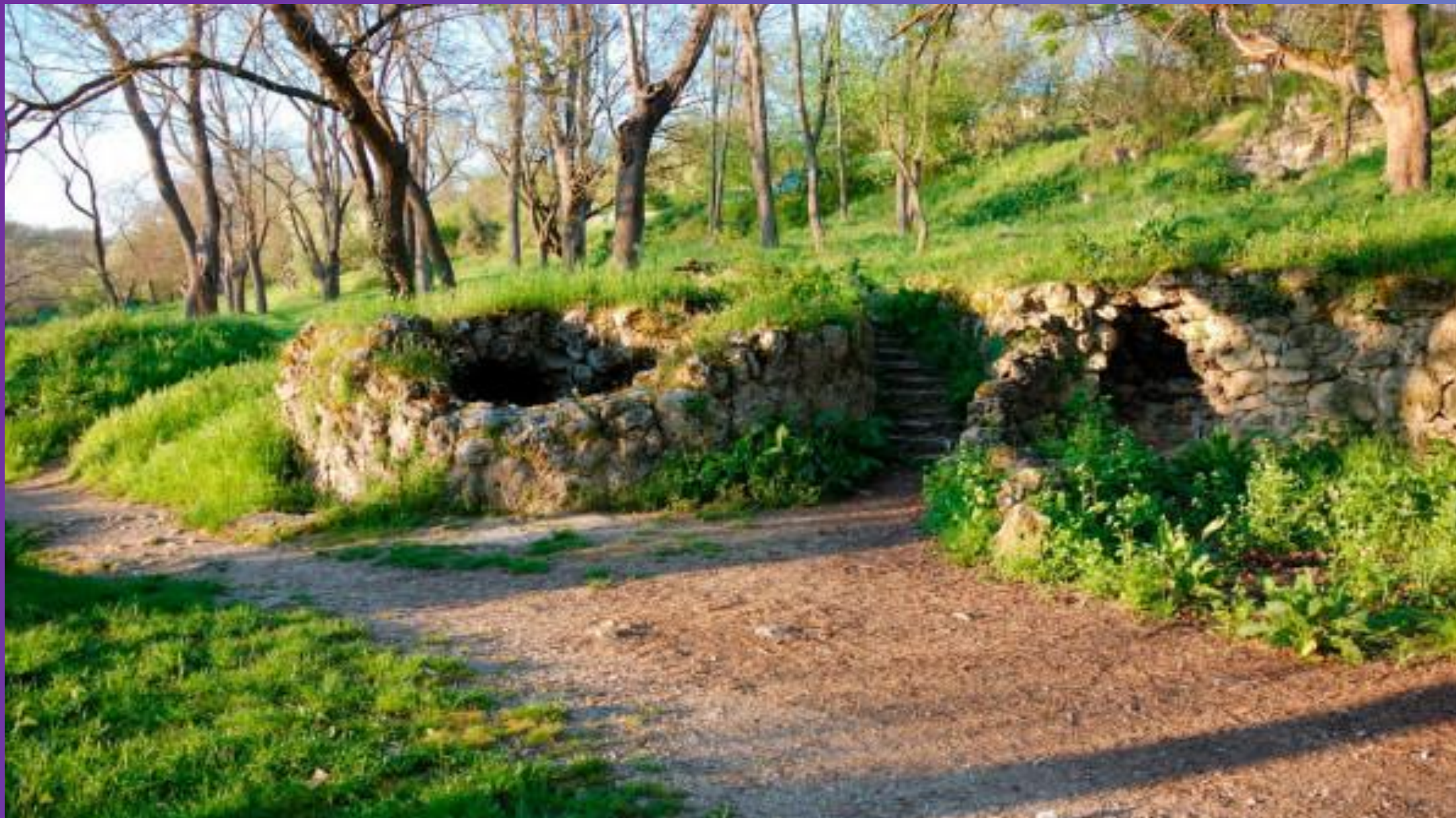
ЗАПОВЕДНИК «МАКСИМОВА ДАЧА»