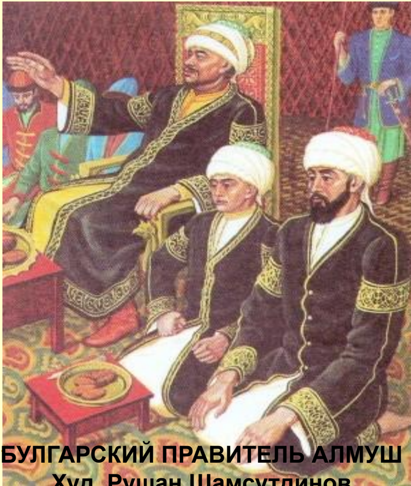
БУЛГАРСКИЙ ПРАВИТЕЛЬ АЛМУШ Худ. Рушан Шамсутдинов

Волжская Булгария управлялась, как и все раннефеодальные государства. Во главе стоял правитель. В Булгарии это был эмир. Его раньше называли эльтебер.