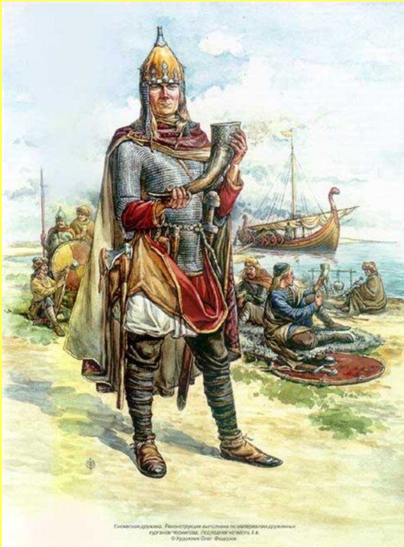
Киевская дружина. Реконструкция выгослана по материалам дружинных эдагисе Чепелова. Последняя четверть X в. © Художник Олег Фёдоров