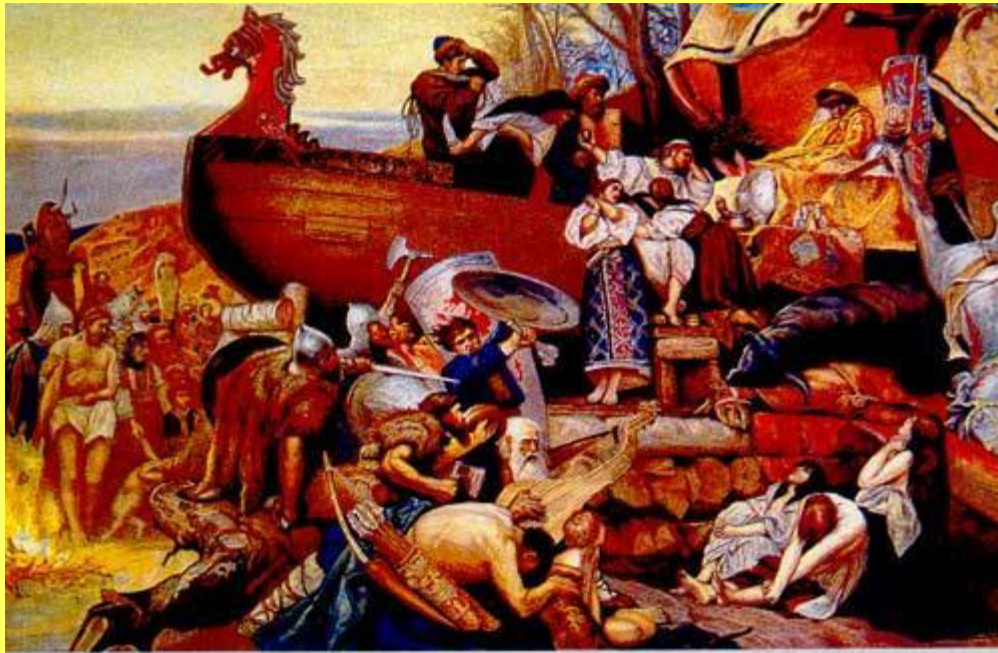
Г. И. Семирадский. Похороны знатного руса у восточных славян в X в.