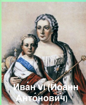
Иван VI (Иоанн Антонович)

(12 [23] августа 1740, Санкт-Петербург — 5 [16] июля 1764, Шлиссельбург) — российский император из Брауншвейгской ветви династии Романовых.