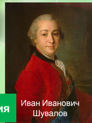
Иван Иванович Шувалов

Московский университет, Академия художеств.