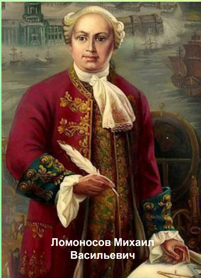
Ломоносов Михаил Васильевич

Вошел в науку как астроном и приборостроитель, географ и металлург, геолог, поэт, филолог, художник, историк и генеалог, поборник развития отечественного просвещения, науки и экономики.