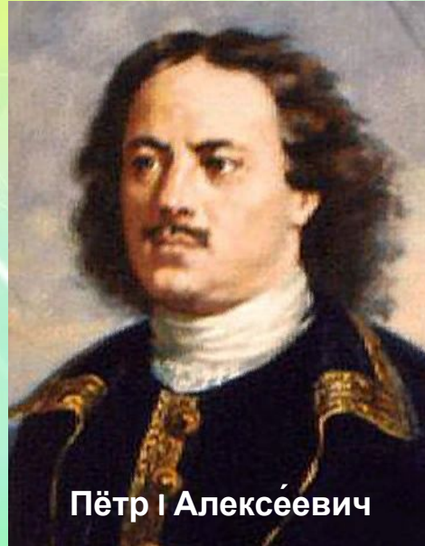
Пётр I Алексеевич

Правление Елизаветы Петровны отмечено возрождением традиций и идеалов Петровского периода