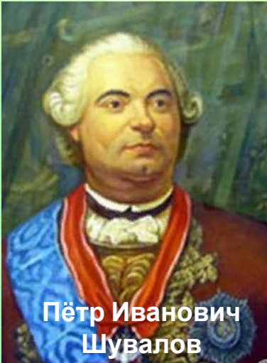
Пётр Иванович Шувалов

(1711-1762) — граф, генерал-фельдмаршал (1761). Принимал активное участие в дворцовом перевороте 25 ноября. 1741, результатом которого явилось воцарение Елизаветы Петровны..