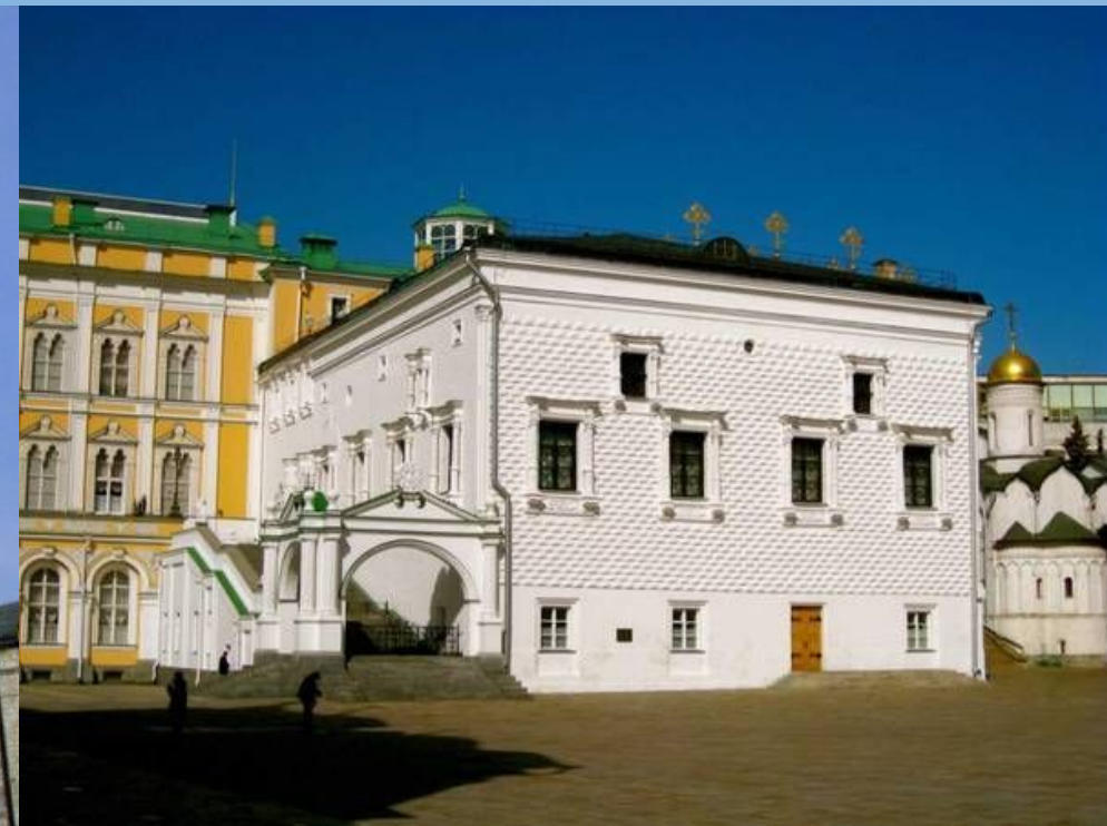
Грановитая Палата. Москва, Кремль. 1487-1491 гг.