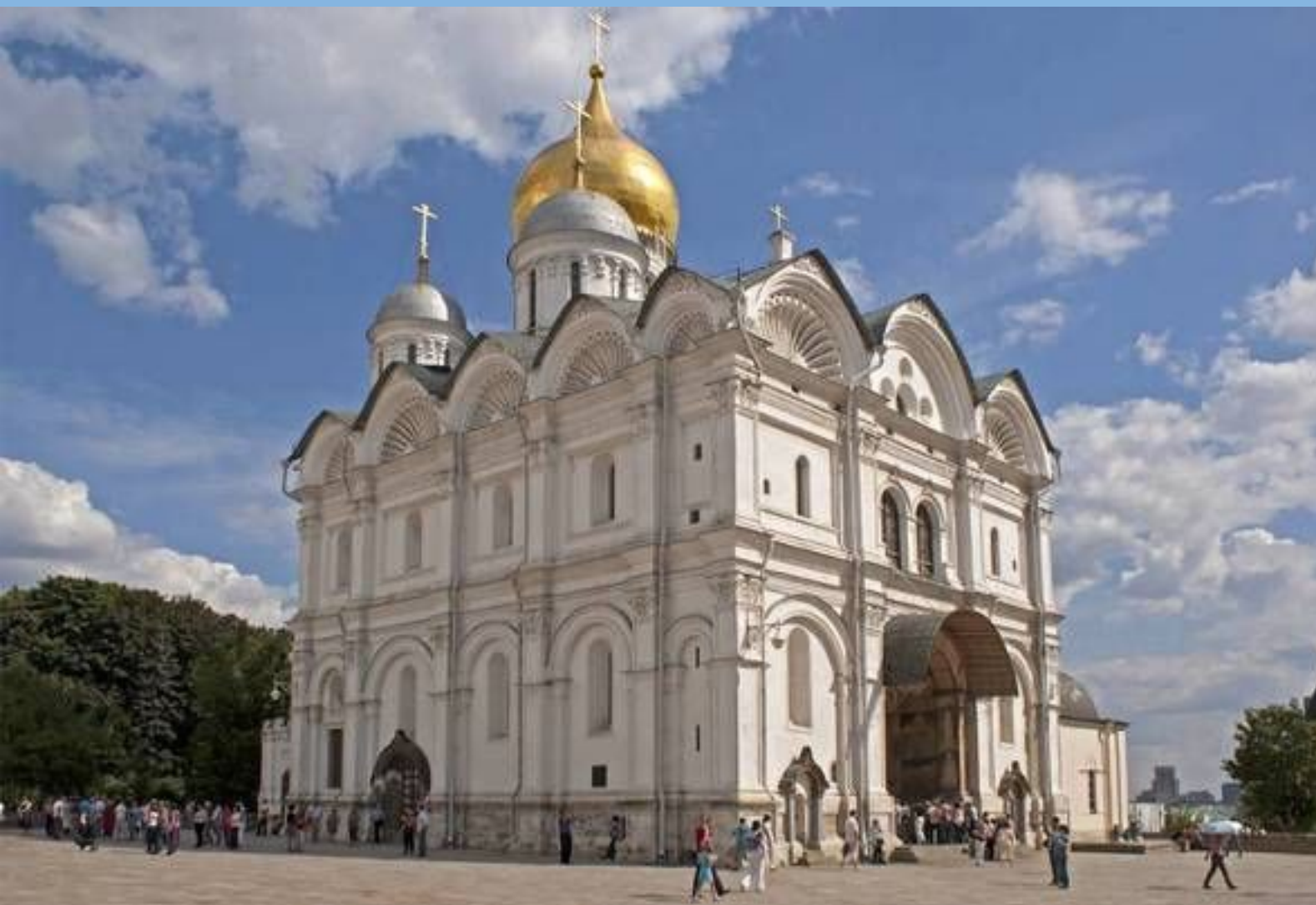
Архангельский собор. Москва, кремль.