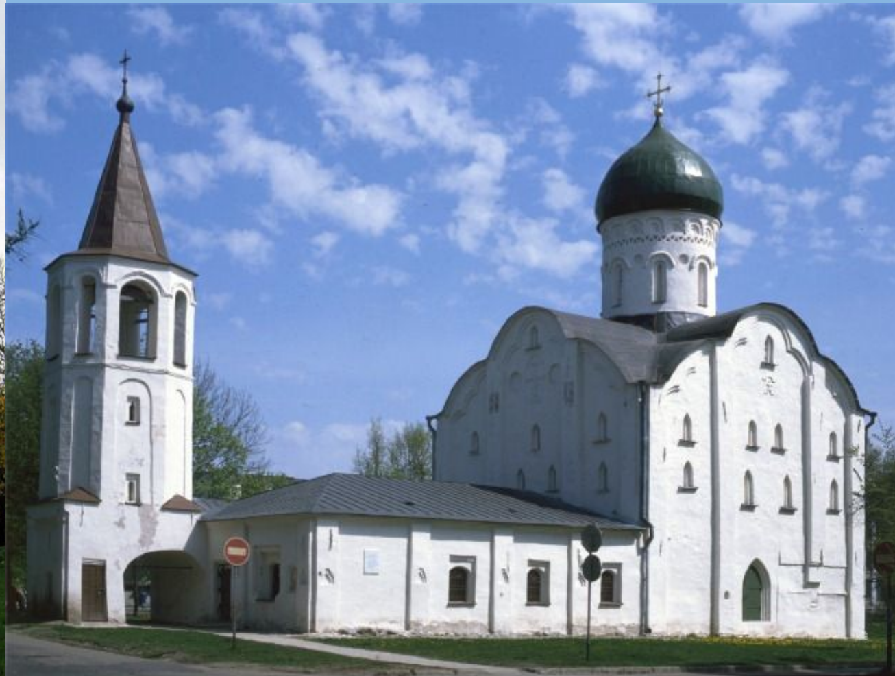
Церковь Федора Стратилата на Ручью, Новгород, 1360-1361 г.