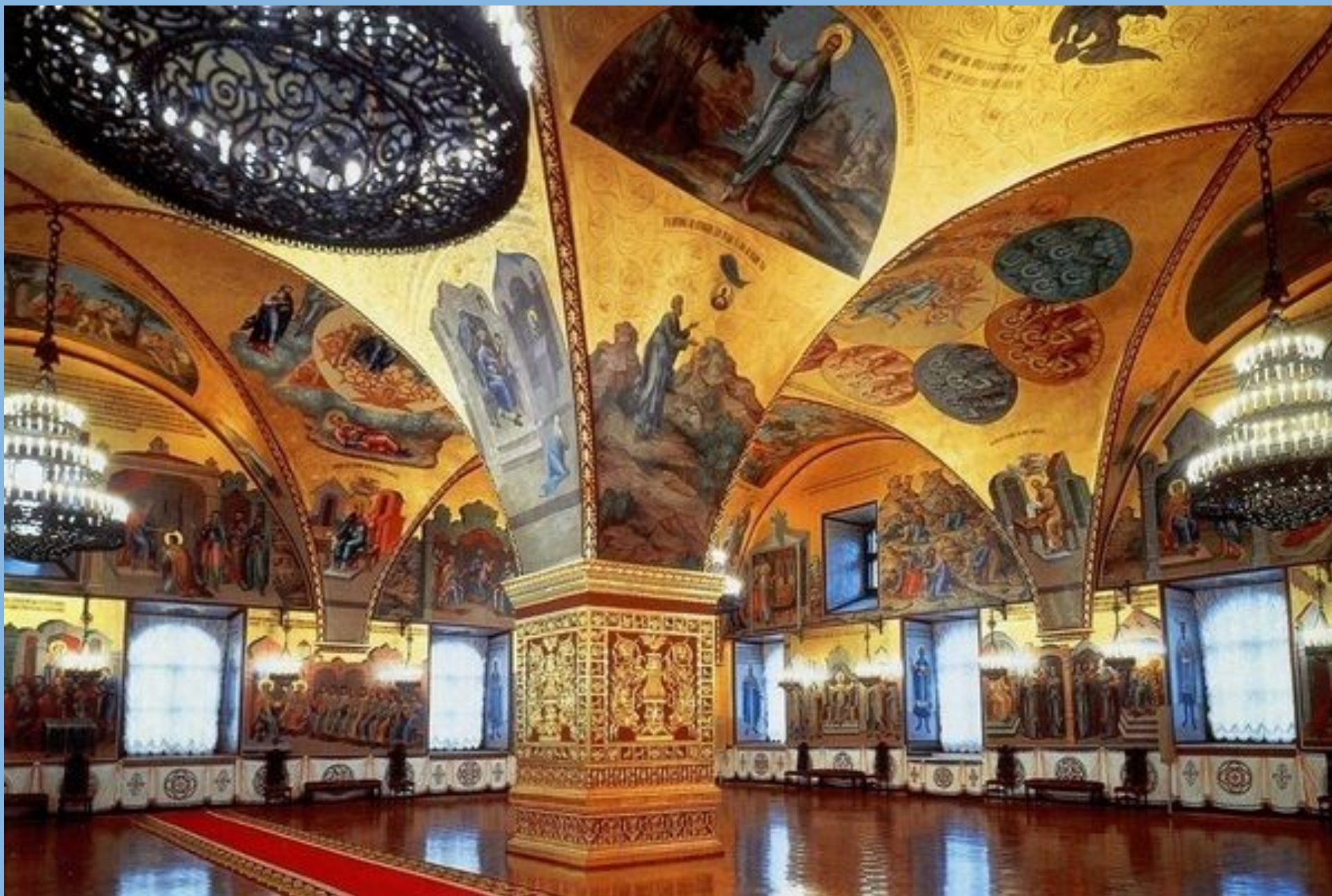
Внутренний интерьер Грановитой