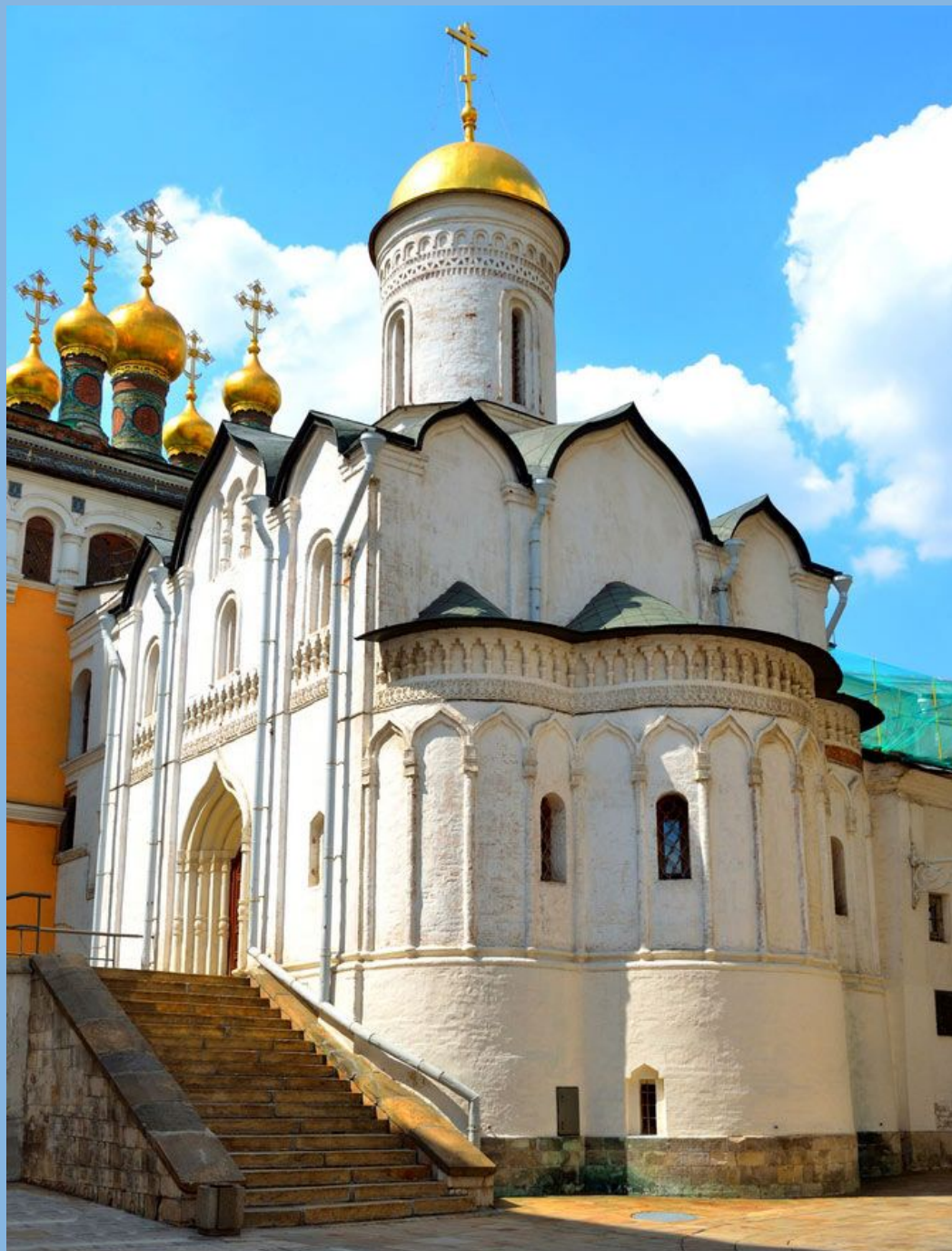
Церковь Ризположения, Московский Кремль, 1484-1485 гг.