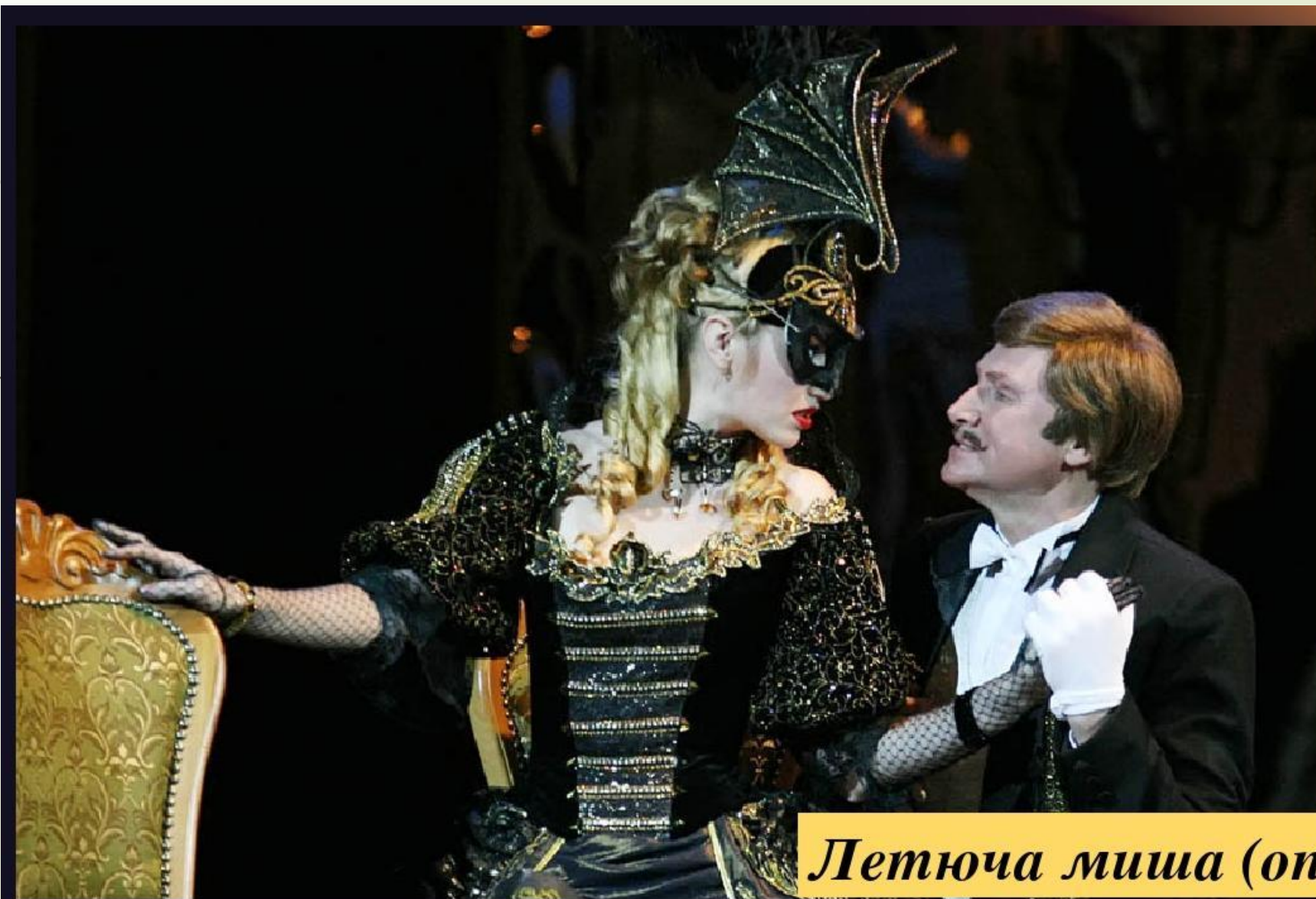
Летюча миша (оперета)