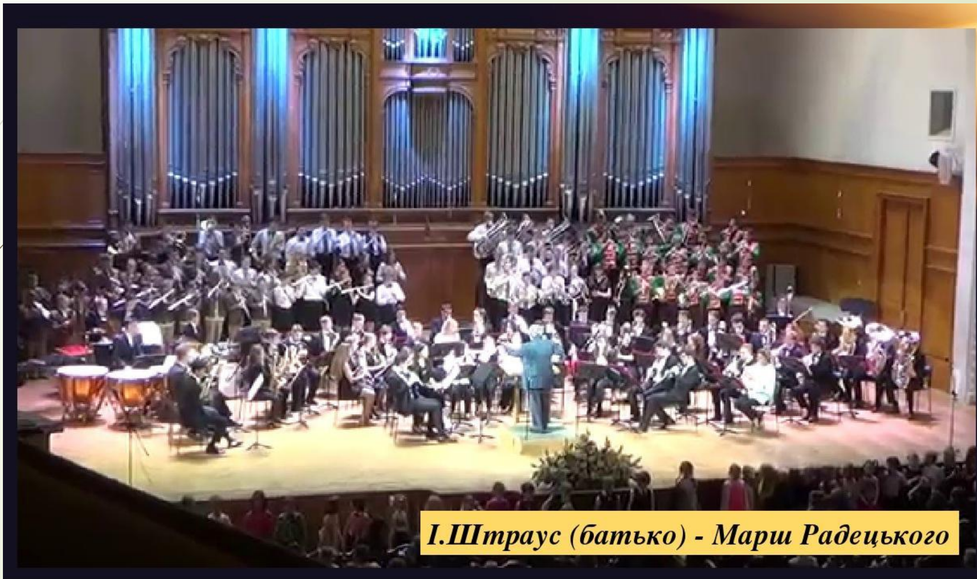
І.Штраус (батько) - Марш Радецького