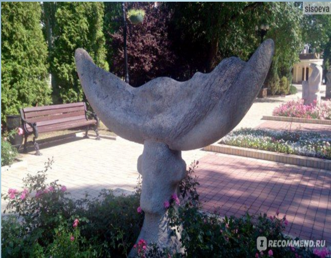
Южную часть бульвара украшают скульптуры "Украинская степь".