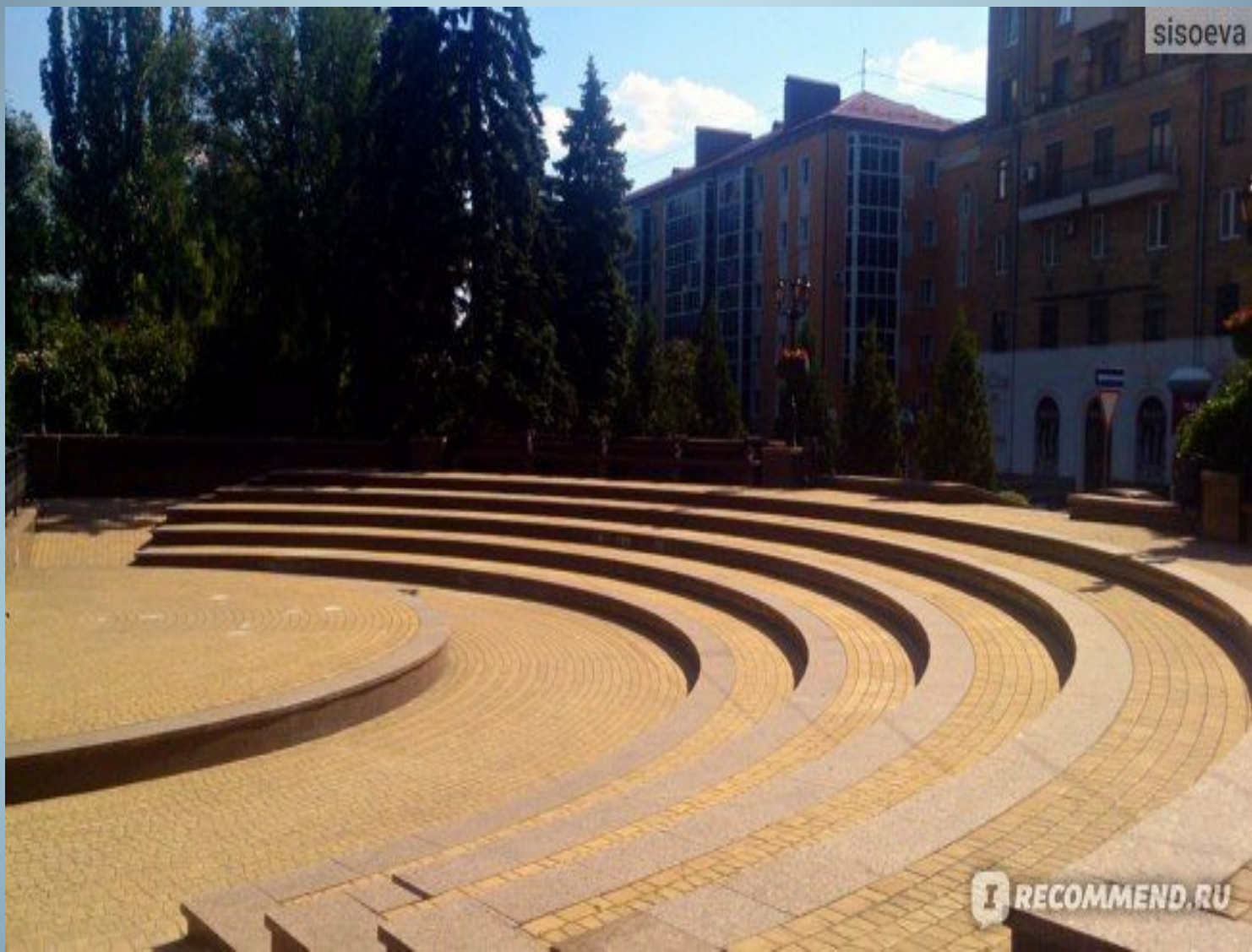
На против памятника сделана площадка в виде амфитеатра.