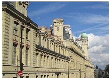
Университет Париж 3 – Новая Сорбонна (Франция) – Параллельное обучение