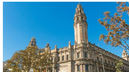
Университет Барселоны (Испания)