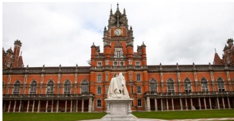
Университет Лондона – Параллельное обучение по направлению 45.03.01 Филология. Зарубежная филология