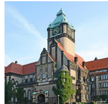
Технический университет Дрездена (Германия)