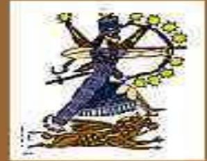
Нинурта – бог войны и земледелия