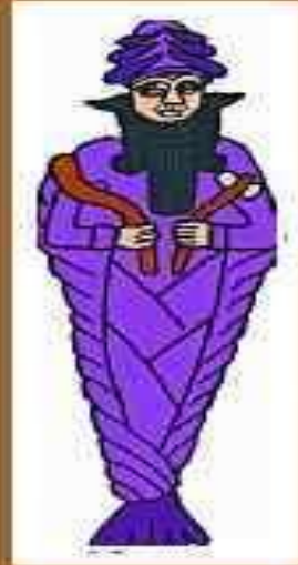
Нергал – бог подземного мира