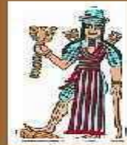
Нинурта – бог счастливой войны, витязь богов