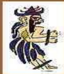
Думузи – бог весны и весенней жертвы, овечий пастух, умирающее и воскресающее божество природы.