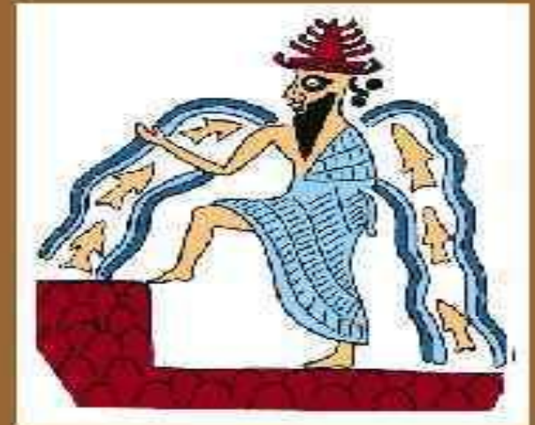
Эа – бог воды и подземного мира