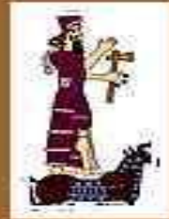
Адад – бог погоды и грома