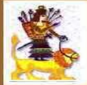
Иштар – богиня плодородия, плотской любви, войны и распри