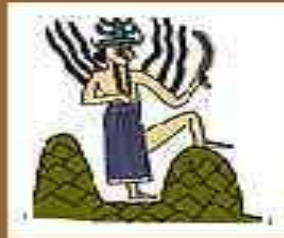
Шамаш – бог солнца и войны