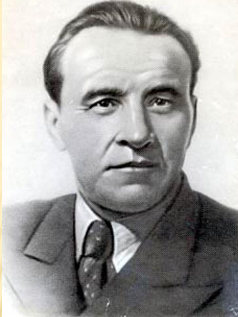
БАКУЛЕВ АЛЕКСАНДР НИКОЛАЕВИЧ