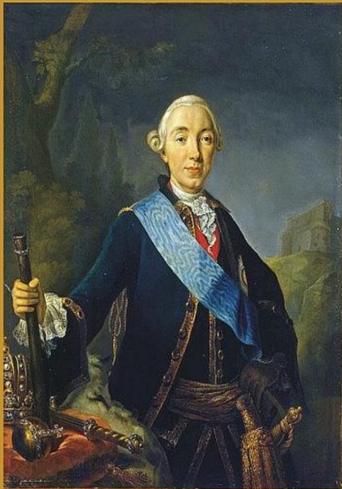
Петр III Император Всероссийский