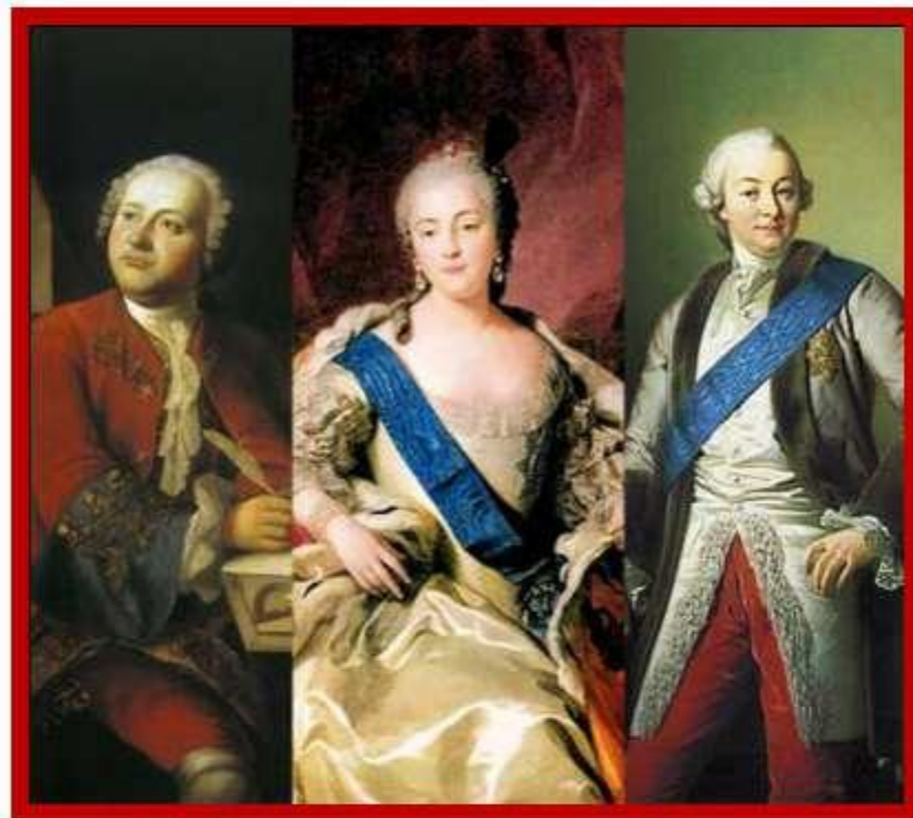
Михаил Васильевич Ломоносов, императрица Елизавета Петровна, Иван Иванович Шувалов.