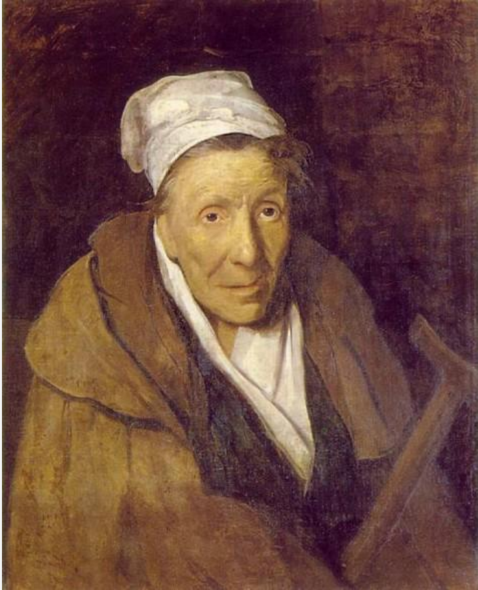
Сумасшедшая, страдающая манией игры

Около 1822—23 Холст, масло. 77 x 64,5 Лувр,