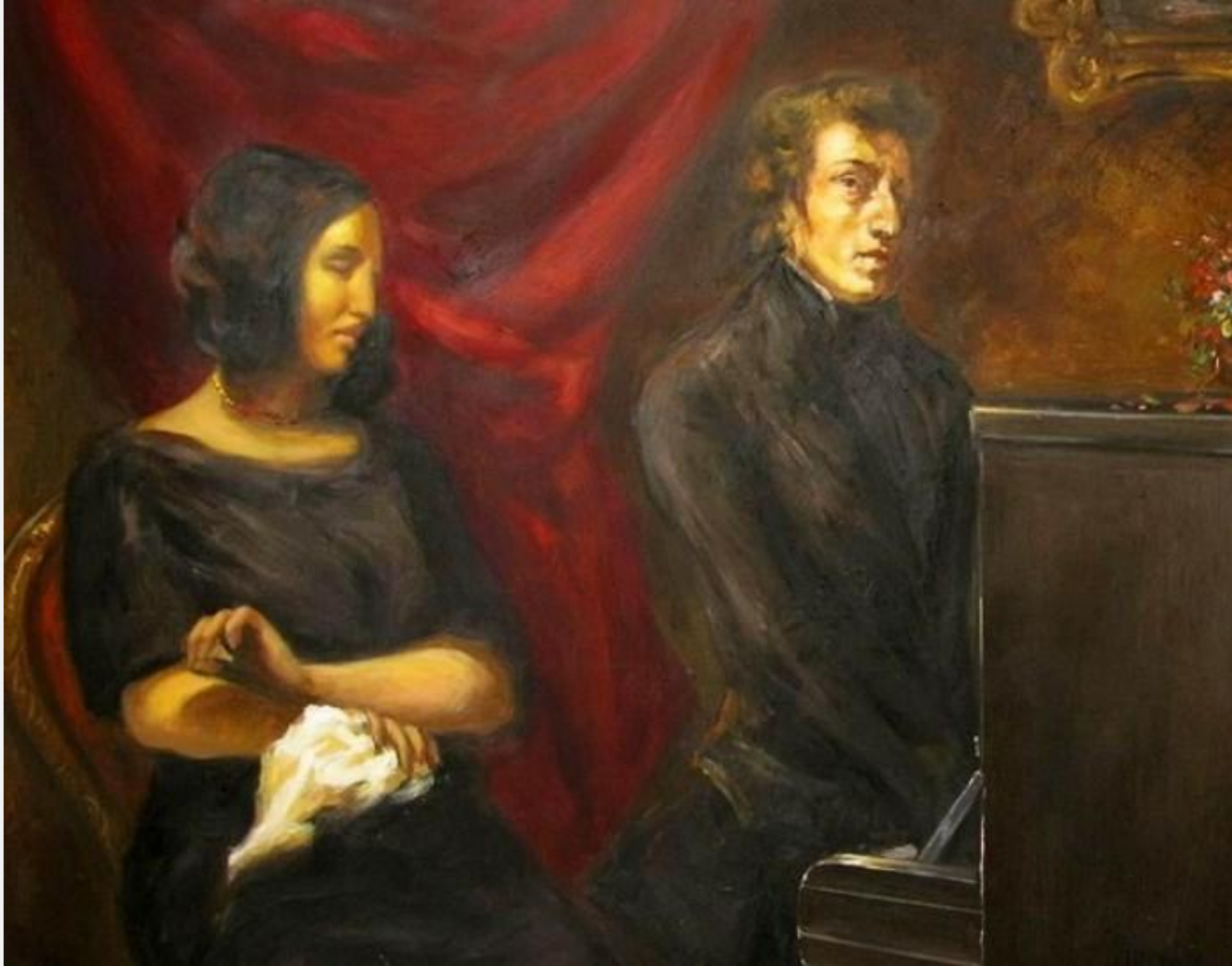
Шопен и Жорж Санд