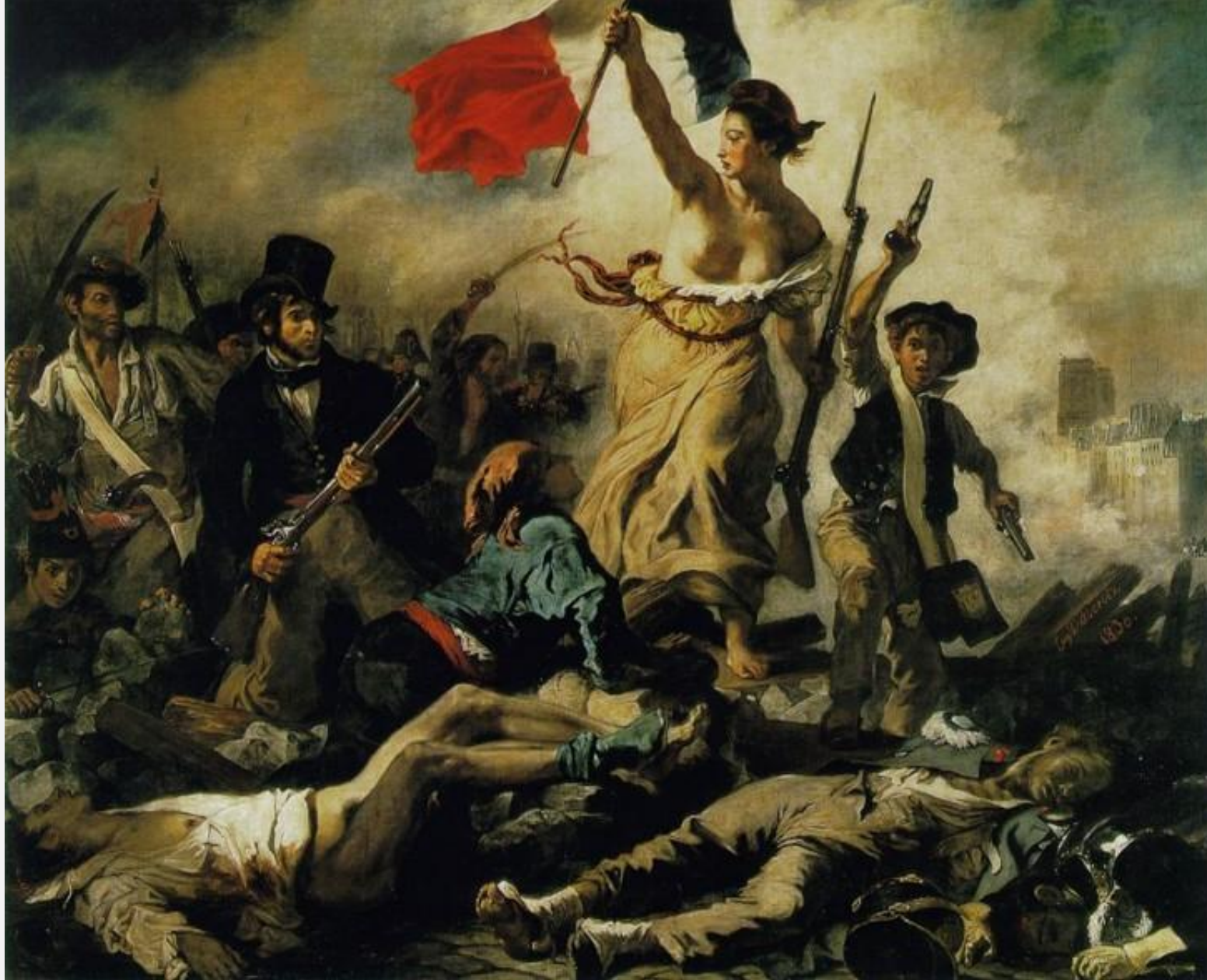
Свобода, ведущая народ (Свобода на баррикадах)