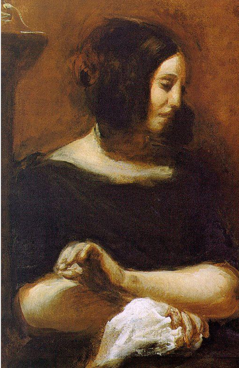
Портрет Жорж Санд 1838 г., Государственный художественный музей, Копенгаген