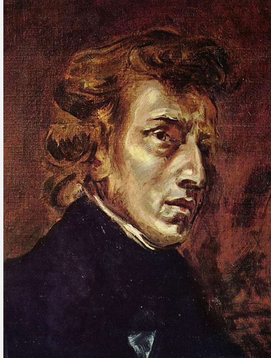
Портрет Фредерико Шопена 1838. Холст, масло. 45,5 x 38