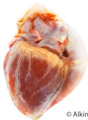
Сердце человека в норме

Алкогольное поражение органов дыхания, желудка и поджелудочной железы, поражение печени, поражение сердечно-сосудистой системы, желез внутренней секреции, поражение крови, мозга.