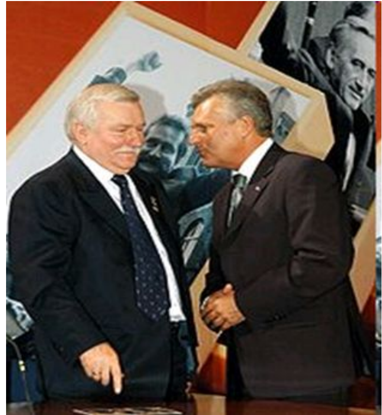
Валенса с будущим Президентом Польши Александром Квасьневским.