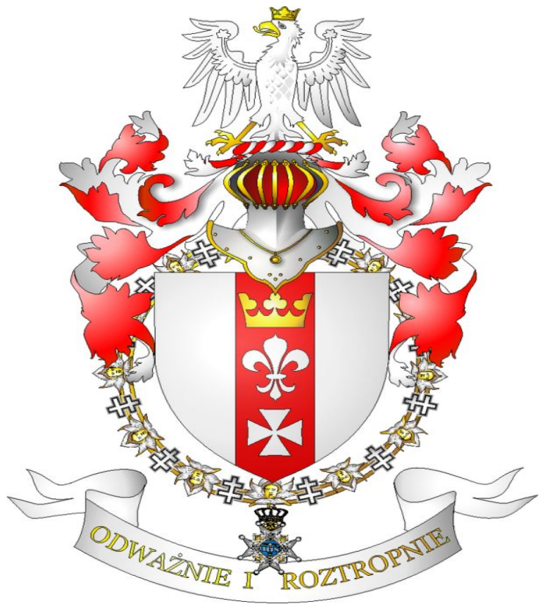
Личный герб Леха Валенсы, как кавалера ордена Серафимов

Лех Валёнса— польский политический деятель, активист и защитник прав человека, первый руководитель профсоюза «Солидарность». Электрик по профессии.