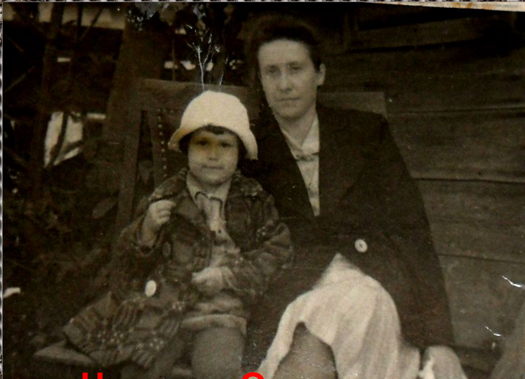
Наталья Олеговна с