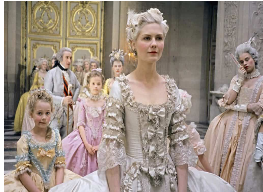
Фильм «Мария-Антуанетта» (2005)