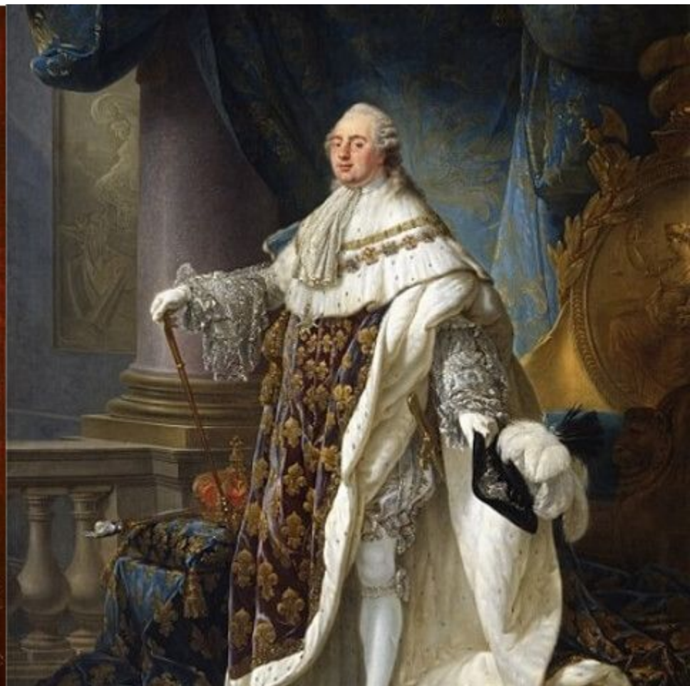
Мария-Антуанетта и ее супруг Людовик XVI