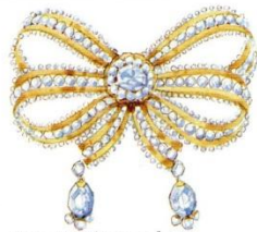
Алмазная брошь в форме банта прикалывалась к корсажу.

Карманы застёгиваются на клапаны с пуговицами