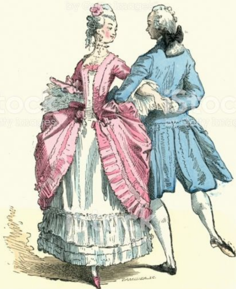
COSTUME DE BAL EN 1762