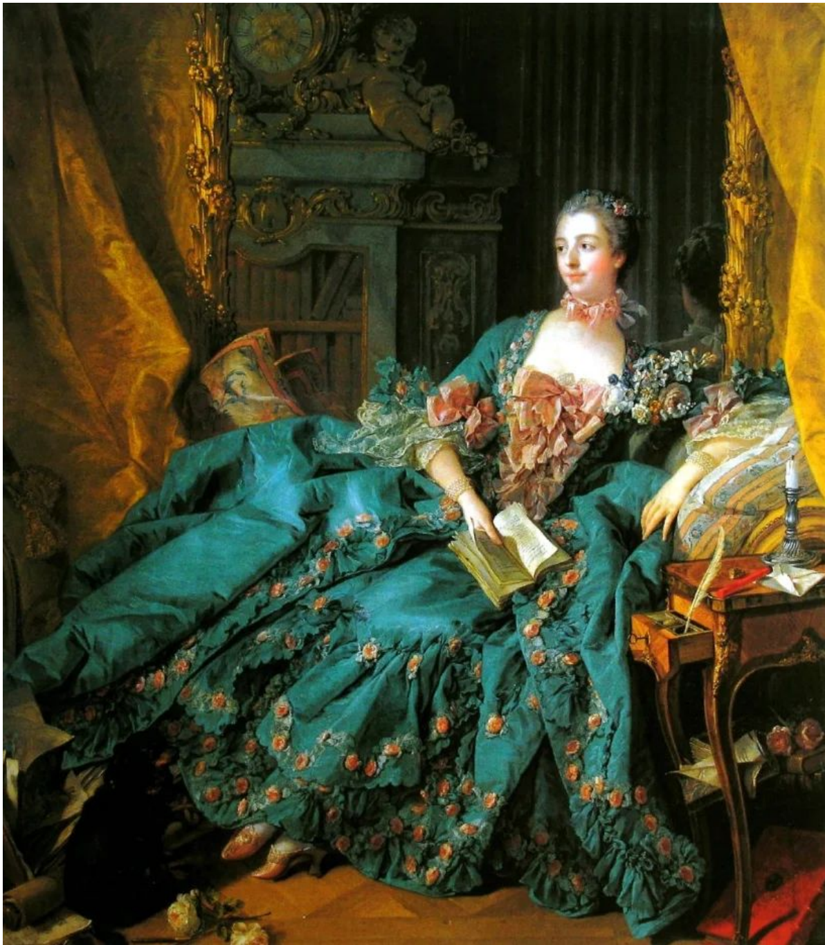
Франсуа Буше Портрет мадам де Помпадур