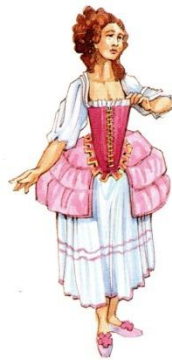
В 1770-х гг. нижнее бельё (вверху): рубашка, длинный корсет и небольшое панье.

Из-за юбок женщина пользуется дамским седлом (женские брюки тогда были немислимы). Воротник и лацканы жакета цельнокроеные.