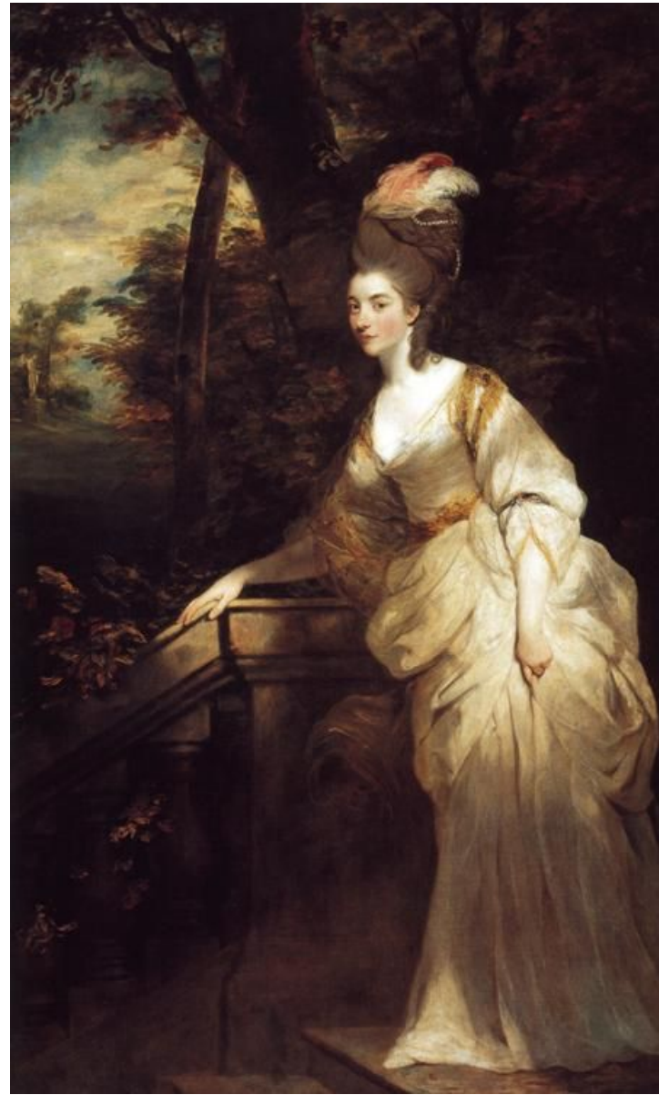
Фильм «Герцогиня» (2008)