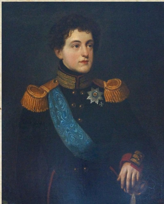
Орест Адамович Кипренский. «Портрет великого князя Николая Павловича»

Император Николай Павлович был большим знатоком древнерусской и византийской церковной культуры.