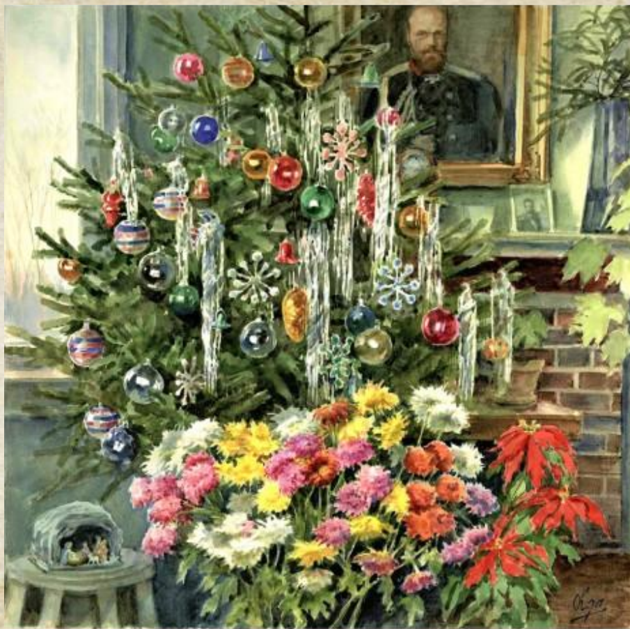
Рождество Христово у великой княгини Ольги Александровны с портретом Александра III