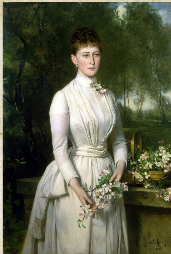
Карл Рудольф Зон. Портрет великой княгини Елизаветы Федоровны

Святая Великая Княгиня-Мученица Елизавета Федоровна обладала архитектурными навыками и глубоким знанием прикладного церковного искусства.