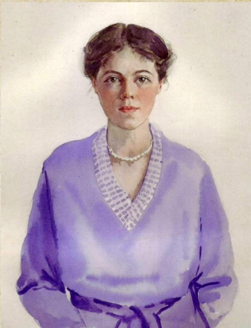
Автопортрет Великой княгини Ольги Александровны в фиолетовом