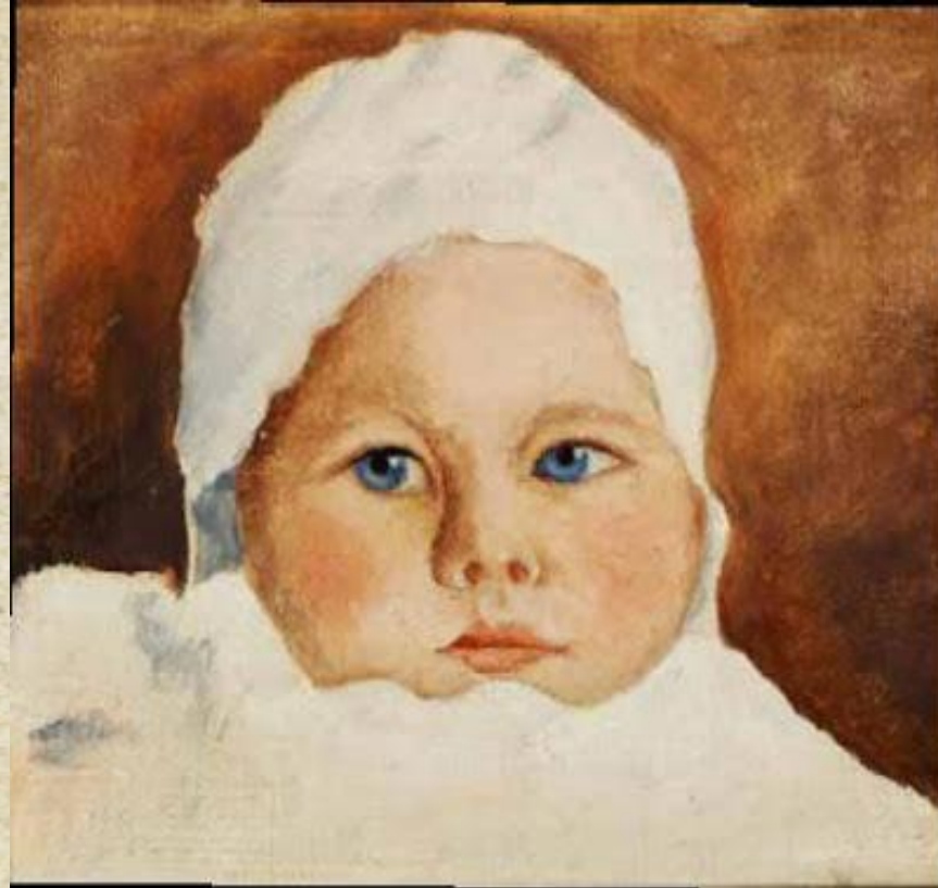
Императрица Мария Федоровна. Портрет великой княжны Ольги Александровны в детстве

Очень рано стал проявляться талант художницы у Великой Княжны Ольги Александровны.