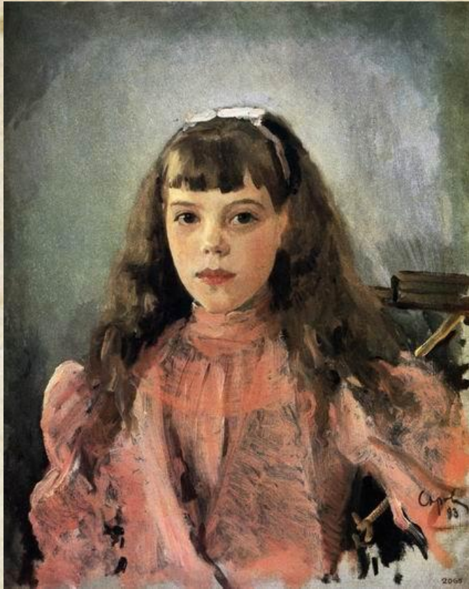
Серов В.А. Портрет великой княжны Ольги Александровны

Великая княжна Ольга была младшим и любимым ребёнком в царской семье, она рисовала с детства всё, что попадалось на глаза: природу, цветы, людей, животных. Но ничего удивительного в этом не было: все Романовы всегда рисовали, для себя и для друзей, К тому же рисование входило в традиционную систему воспитания детей наряду с изучением иностранных языков, музыки, географии, математики и так далее. Но только Ольга стала по сути настоящей художницей. Избежать её кисти не удавалось никому: ни придворным, ни швейцарам, ни арапу, ни часовым, ни матросам. И всё же, видя пристрастие девочки к кистям и краскам, царь пригласил для занятий с дочерью известных педагогов-художников: Лемоха, Виноградова, Жуковского, Владимира Маковского.