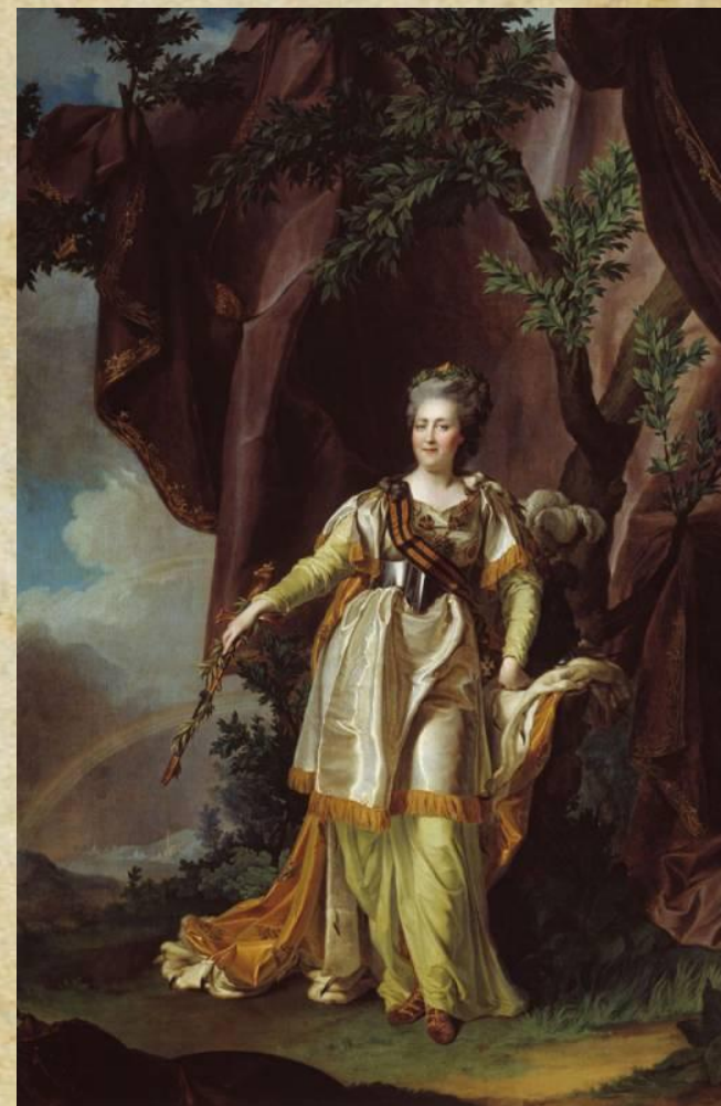
Дмитрий Левицкий. Портрет Екатерины II

Императрица Екатерина Великая была талантливой писательницей, драматургом.