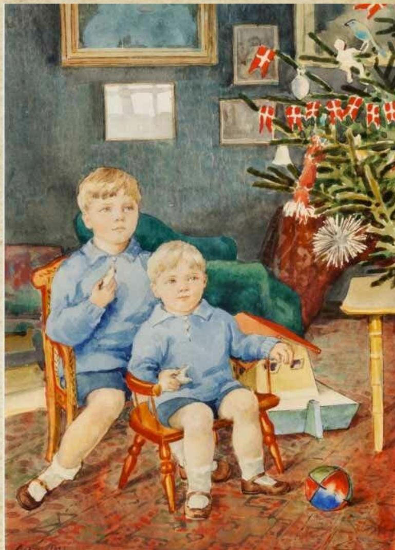
Сыновья Великой княгини Тихон и Гурий в Рождество