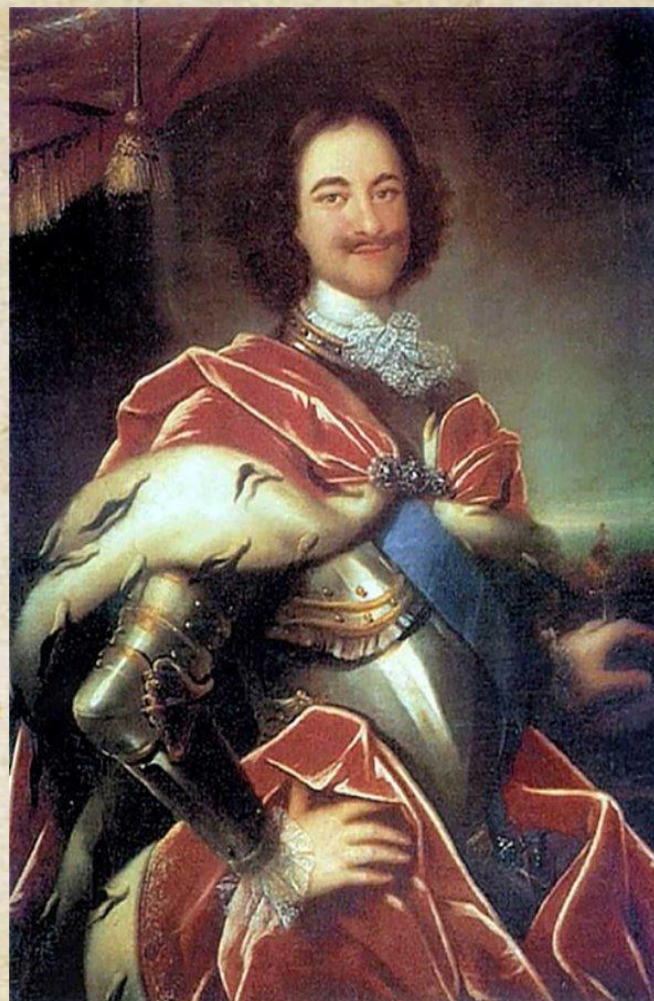
Иван Никитич Никитин Портрет Петра I.

Его младший брат – Император Петр Великий – обладал безусловным архитектурным и градостроительным талантом.