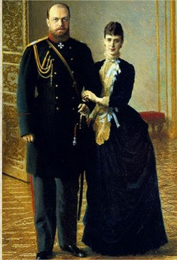
Крамской И.Н. Портрет императора Александра III и императрицы Марии Фёдоровны

Великая княгиня Ольга Александровна (13 июня 1882, Петергоф — 24 ноября 1960, близ Торонто) была дочерью императора Александра III и императрицы Марии Фёдоровны. Она - младшая сестра императора Николая II. Девочка рождается багрянородной, ибо так называли детей, рожденной в период правления своих родителей.