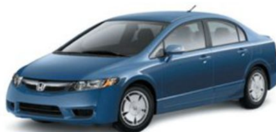
Honda Civic hybrid.