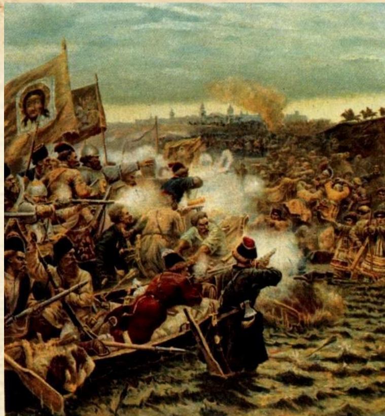
Первый день Московской битвы между войсками Второго народного ополчения и польско-литовской армией гетмана Ходкевича