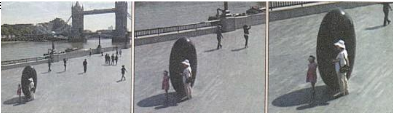
(Наезд (от общего плана к крупному))