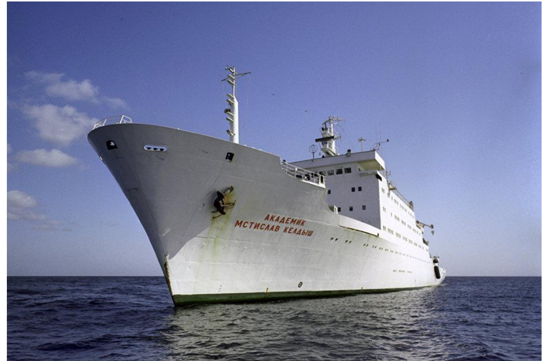
Маршрут рейса 2021