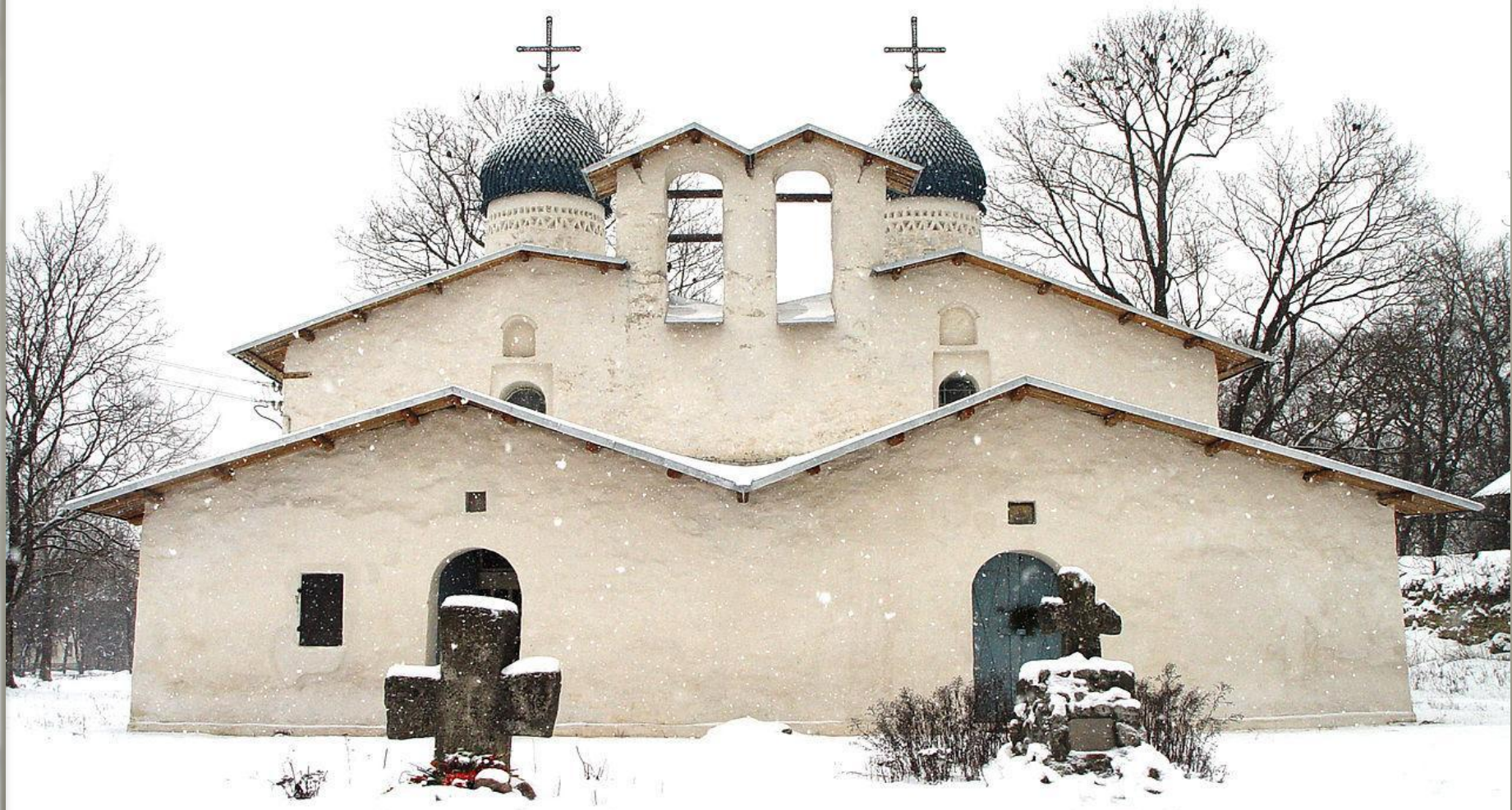
Церковь Покрова и Рождества