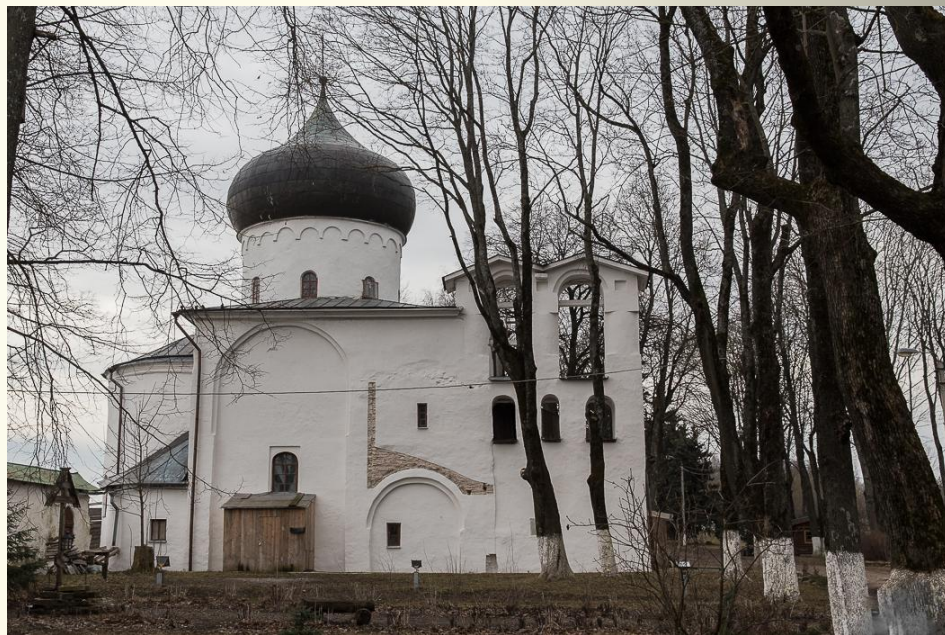
Собор Спаса Преображения Мирожского монастыря

Техника кладки смешанная, плинфа используется совместно с камнем. Главный мастер, строившийся собор, мог быть греком, а помогали ему, скорее всего, новгородские мастера.