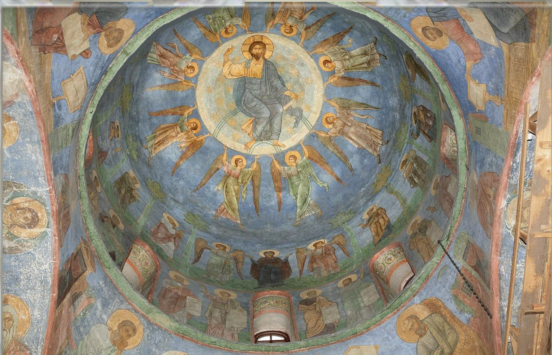
Спасо-Преображенский собор Мирожского монастыря: роспись купола