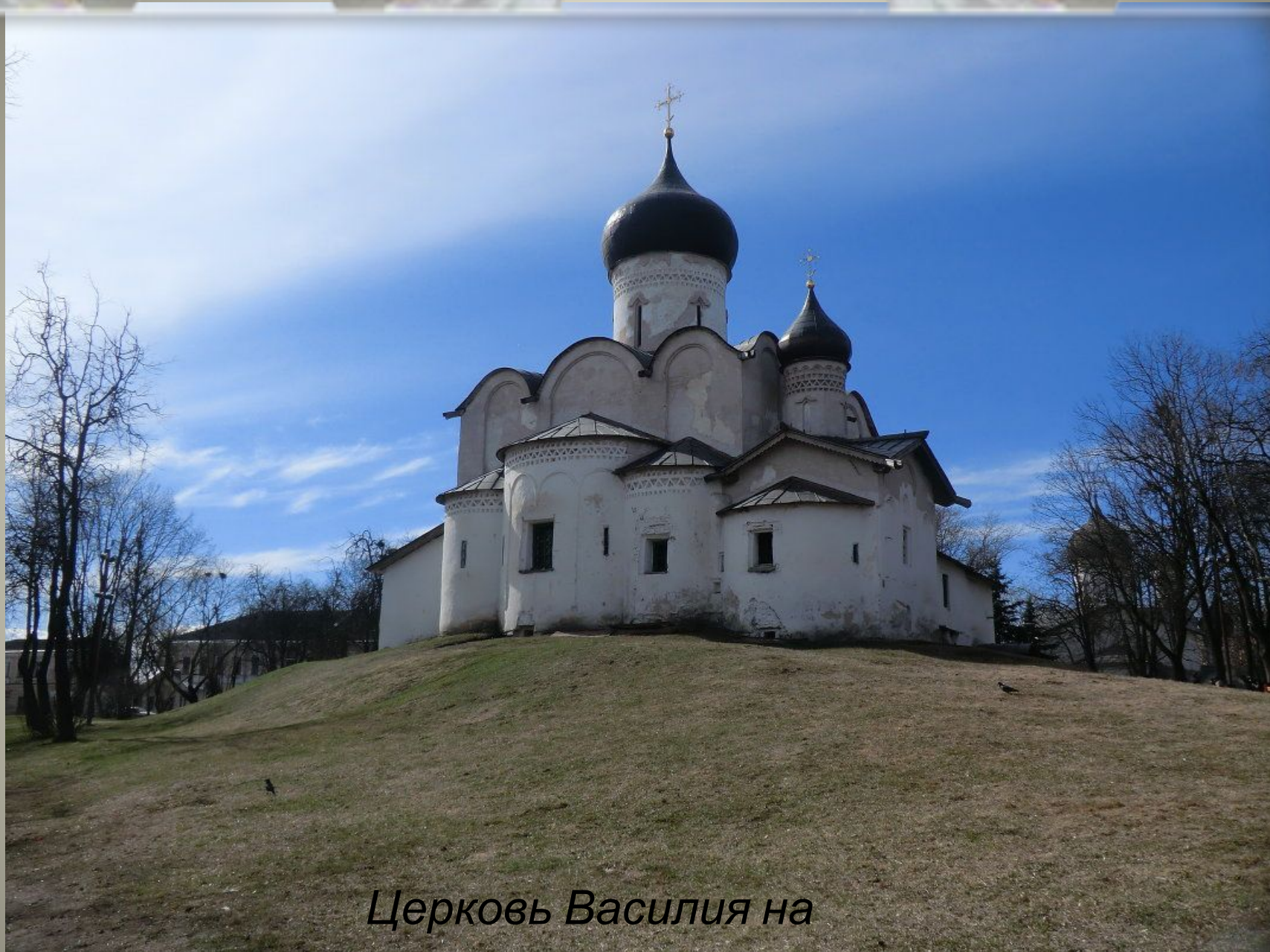
Церковь Василия на горке