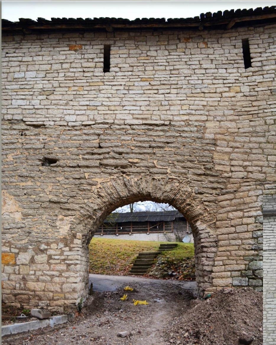
Кладка стен Псковского Кремля