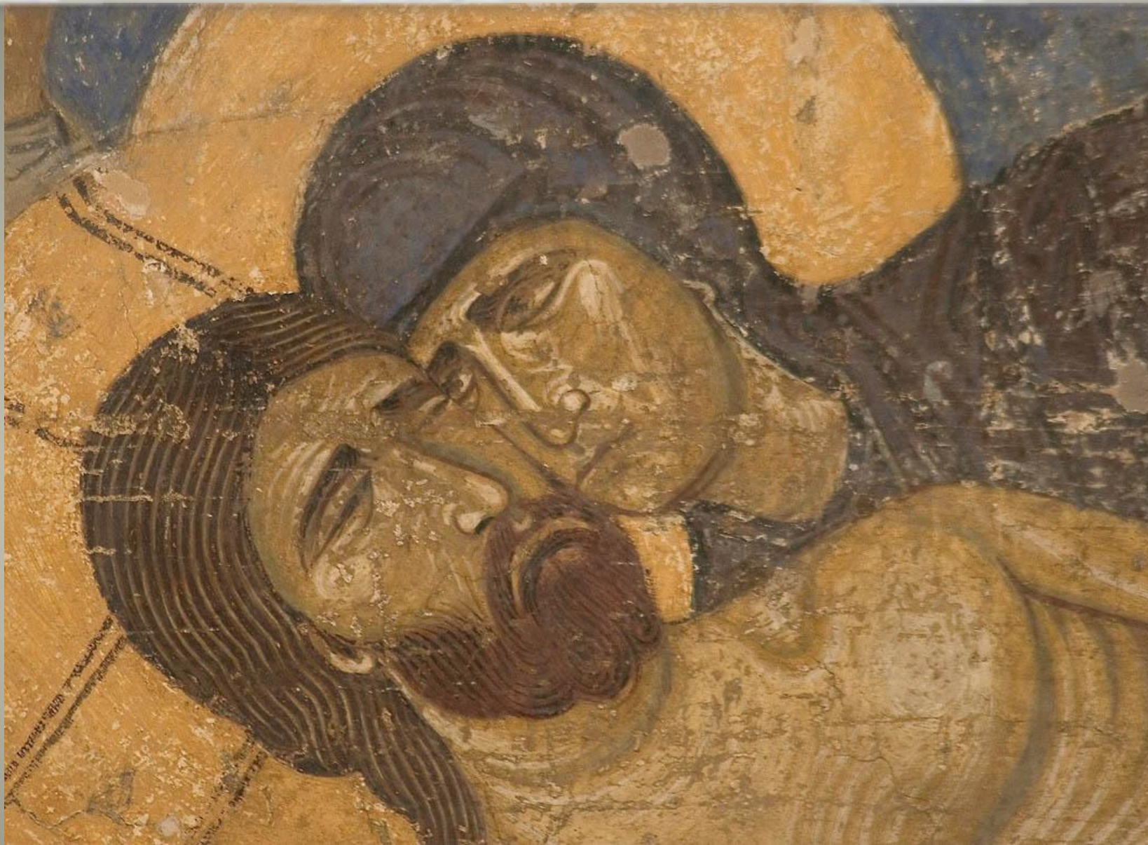
Положение во гроб. Фрагмент