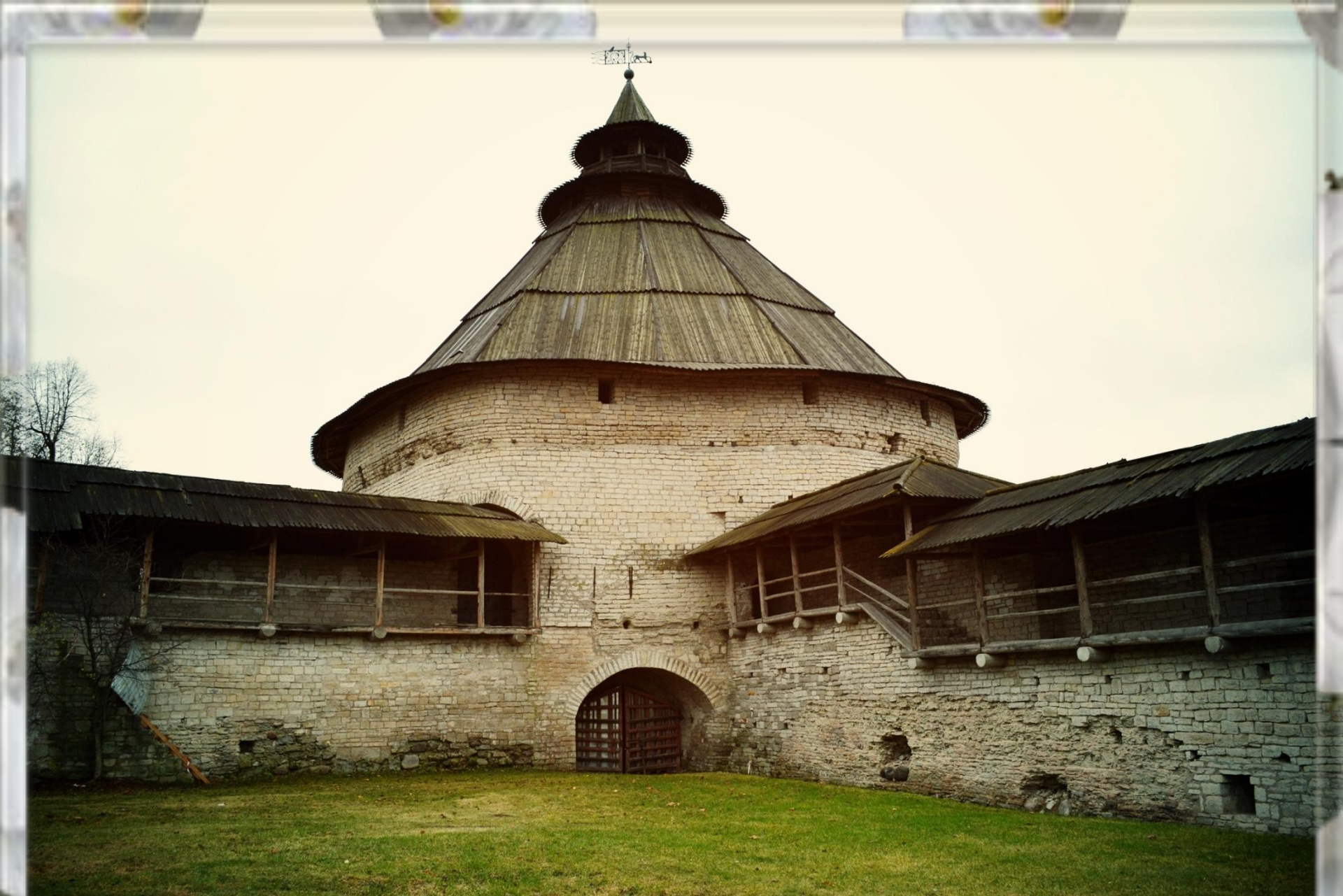
Одна из башен Псковского Кремля