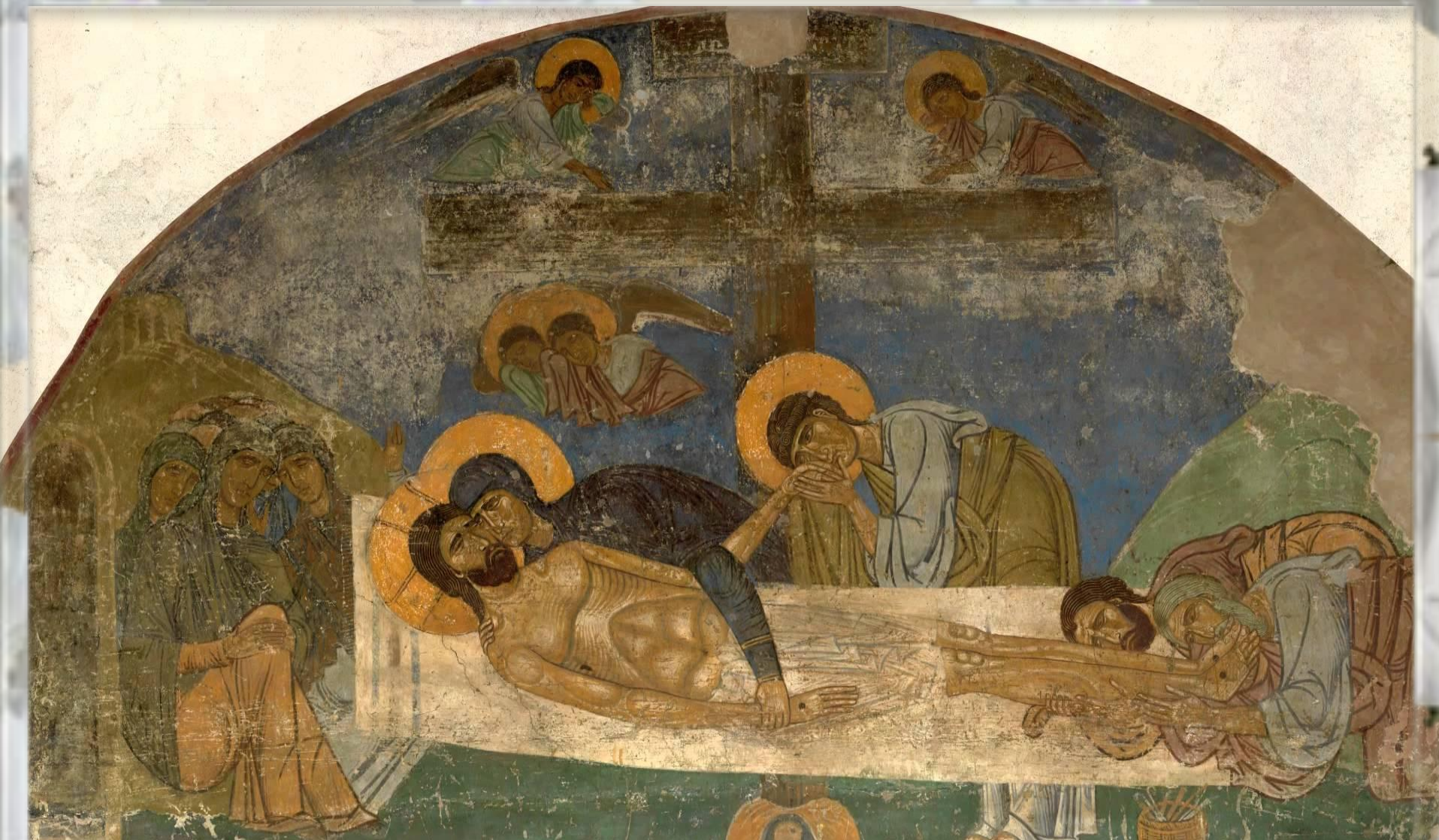
Фрески собора Спаса Преображения Мировжского монастыря: Положение во гроб