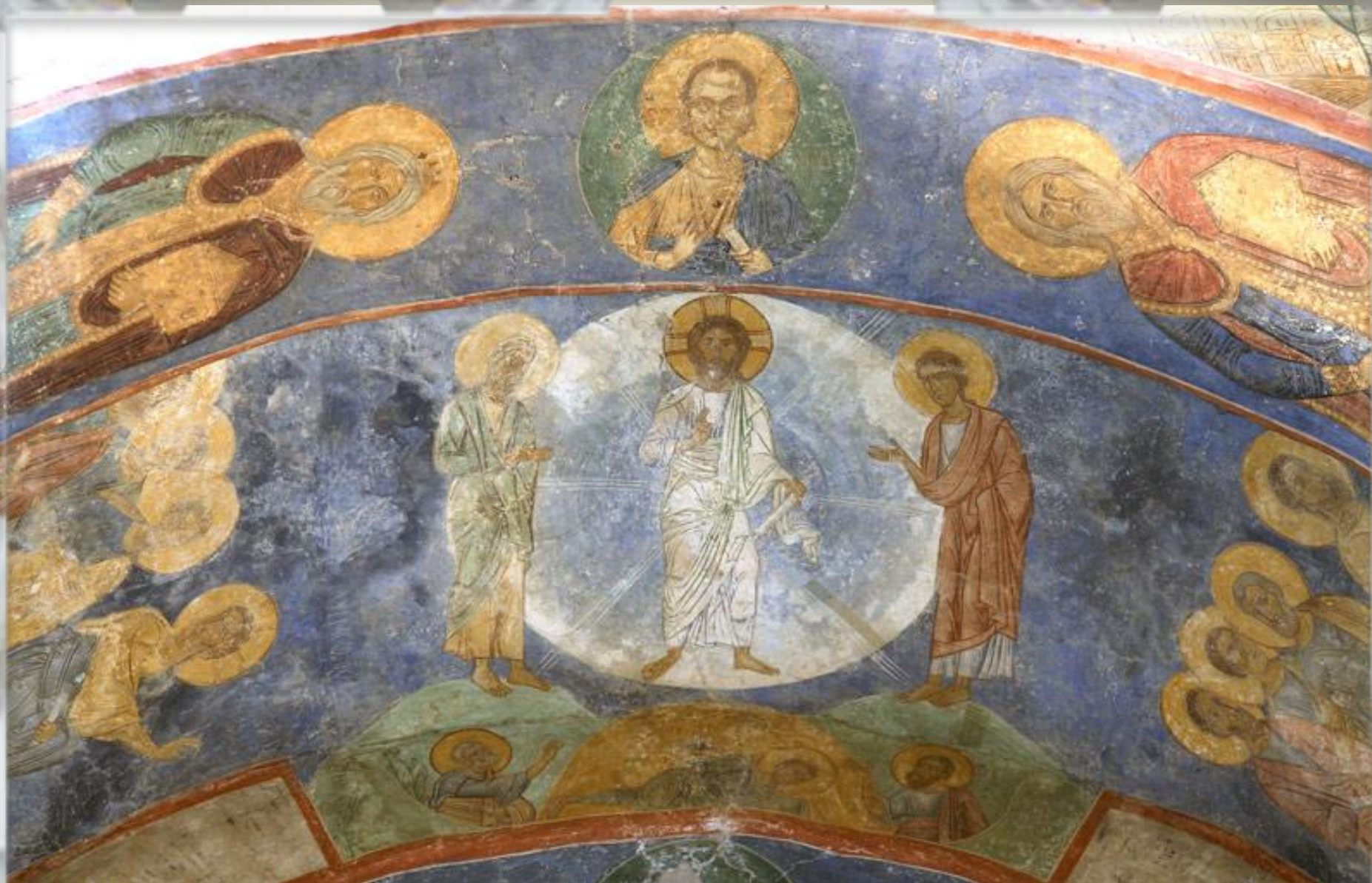
Фрески собора Спаса Преображения Мировжского монастыря: Преображение