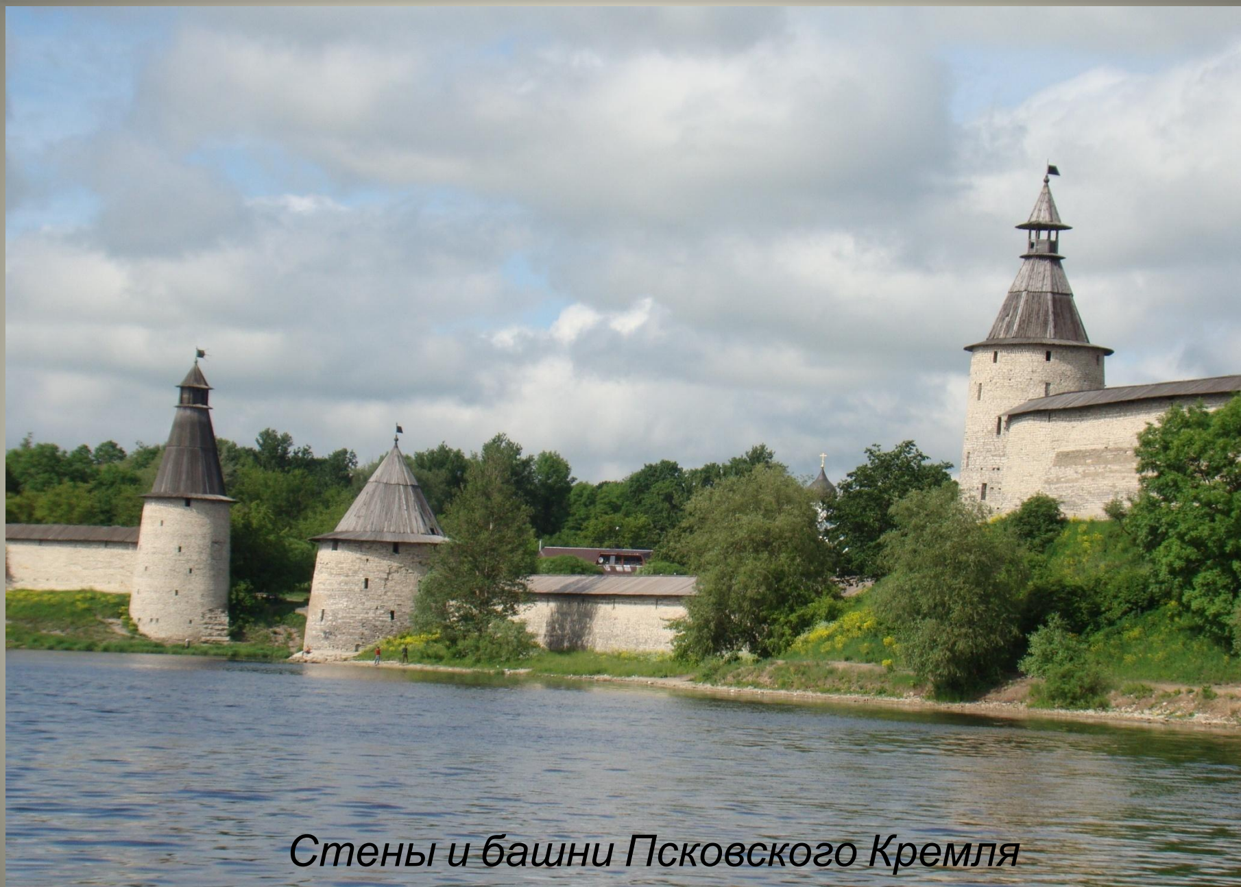
Стены и башни Псковского Кремля