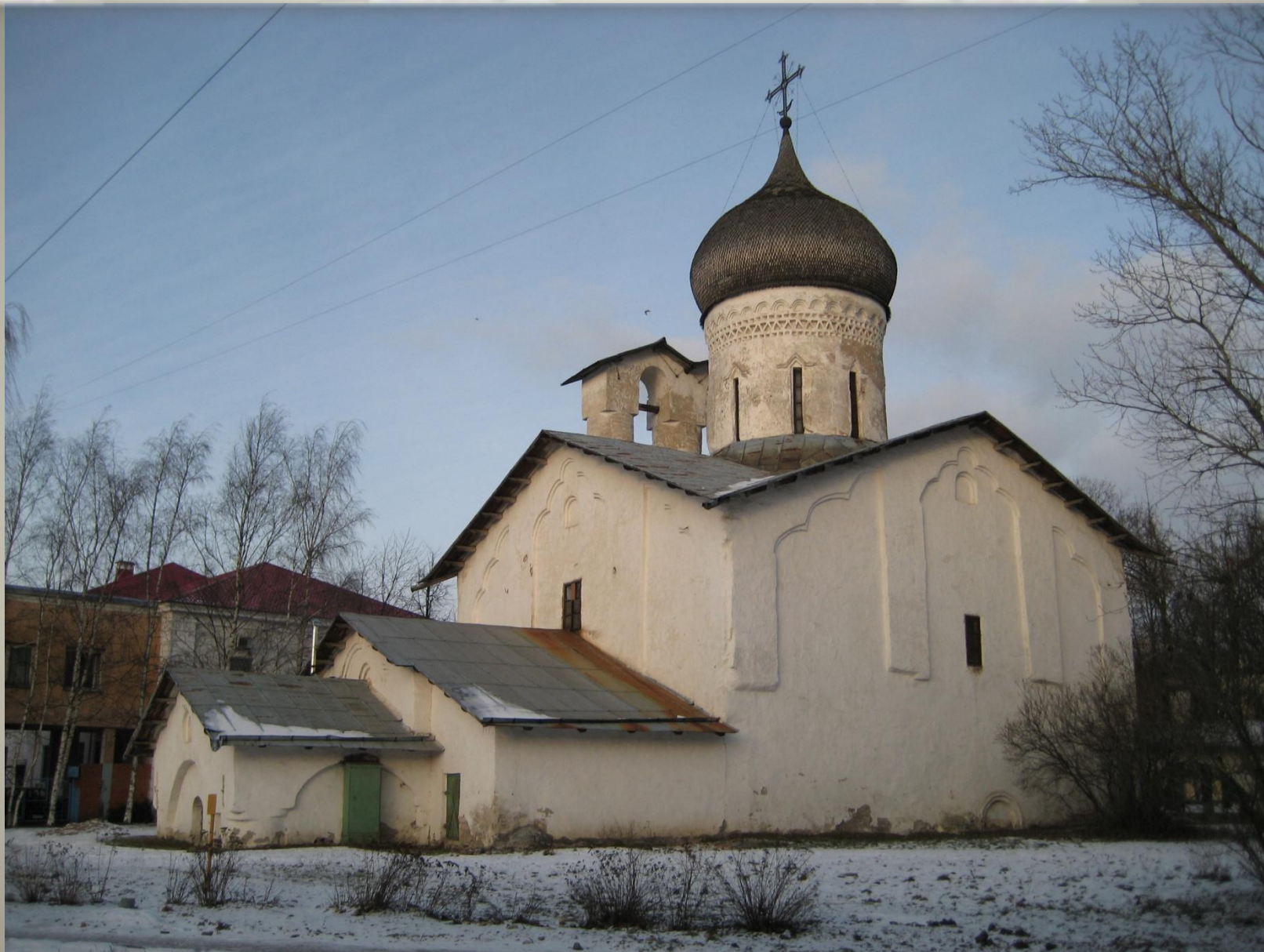
Церковь Николая со Урохи