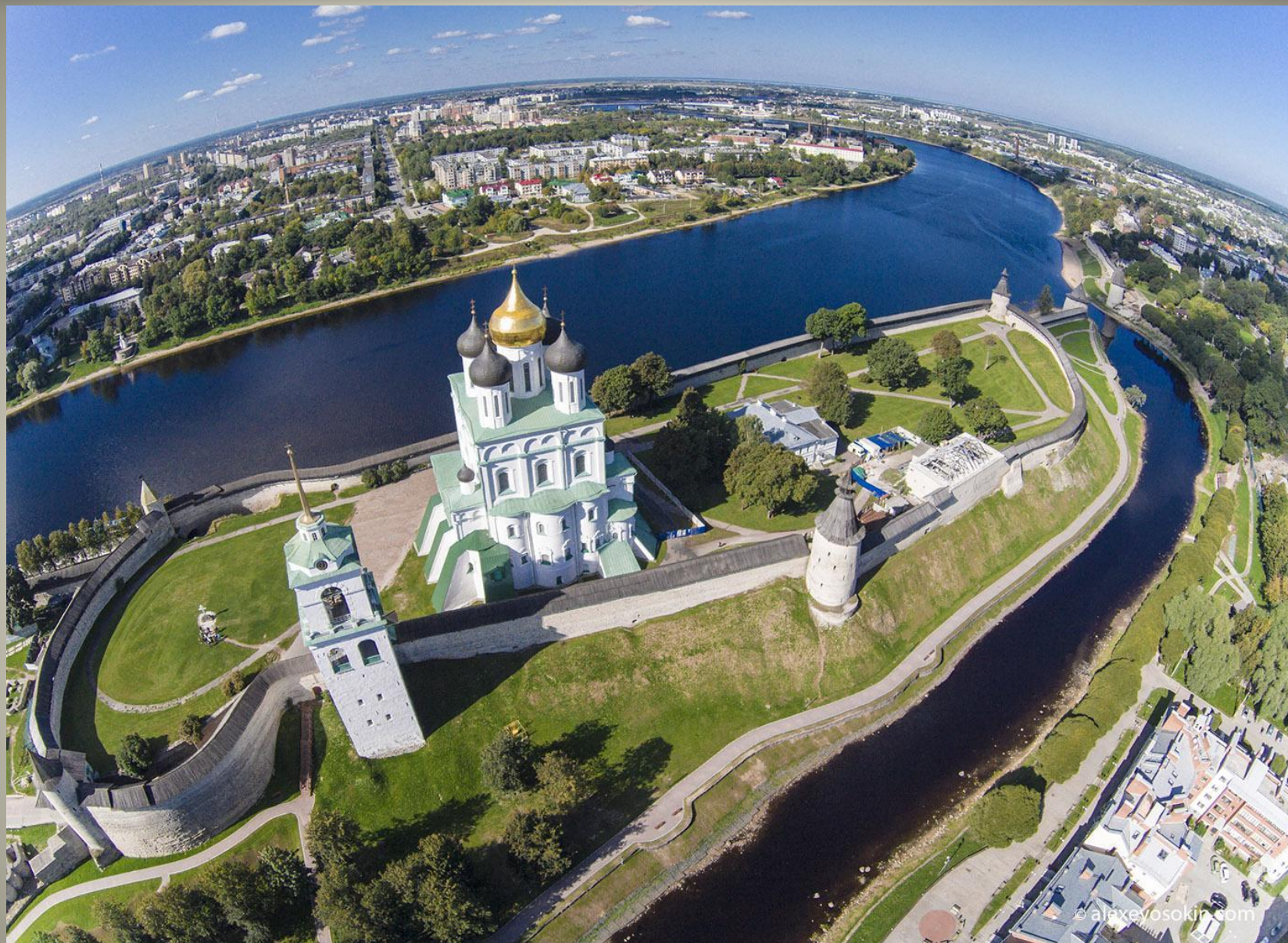
Общий вид Псковского Кремля (Крома)