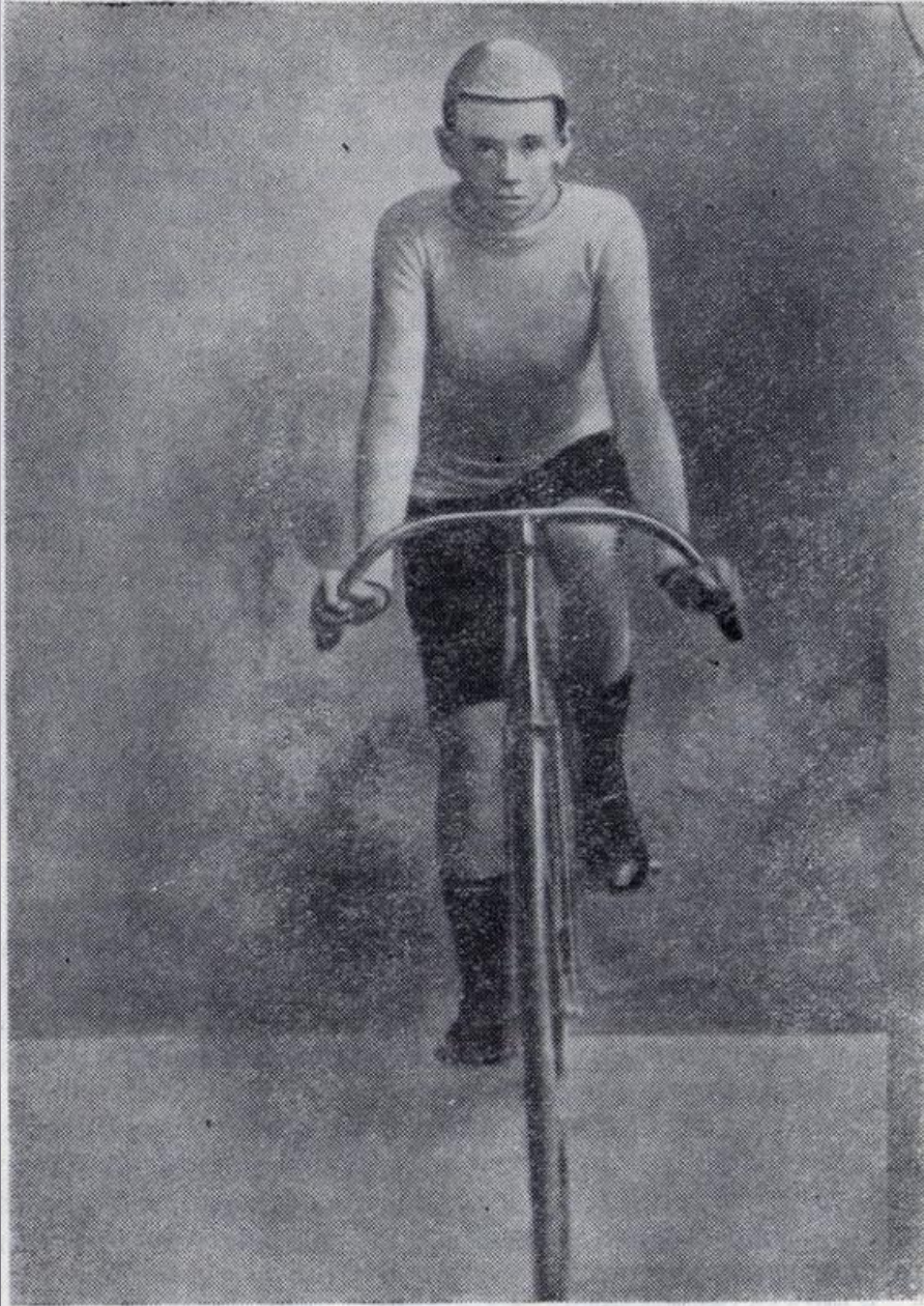
Уточкин на гоночном велосипеде в 1890 г.

В 1891 году на Ходынском велотреке состоялся первый всероссийский чемпионат по велосипедным гонкам на 7,5 верст (8000 метров).