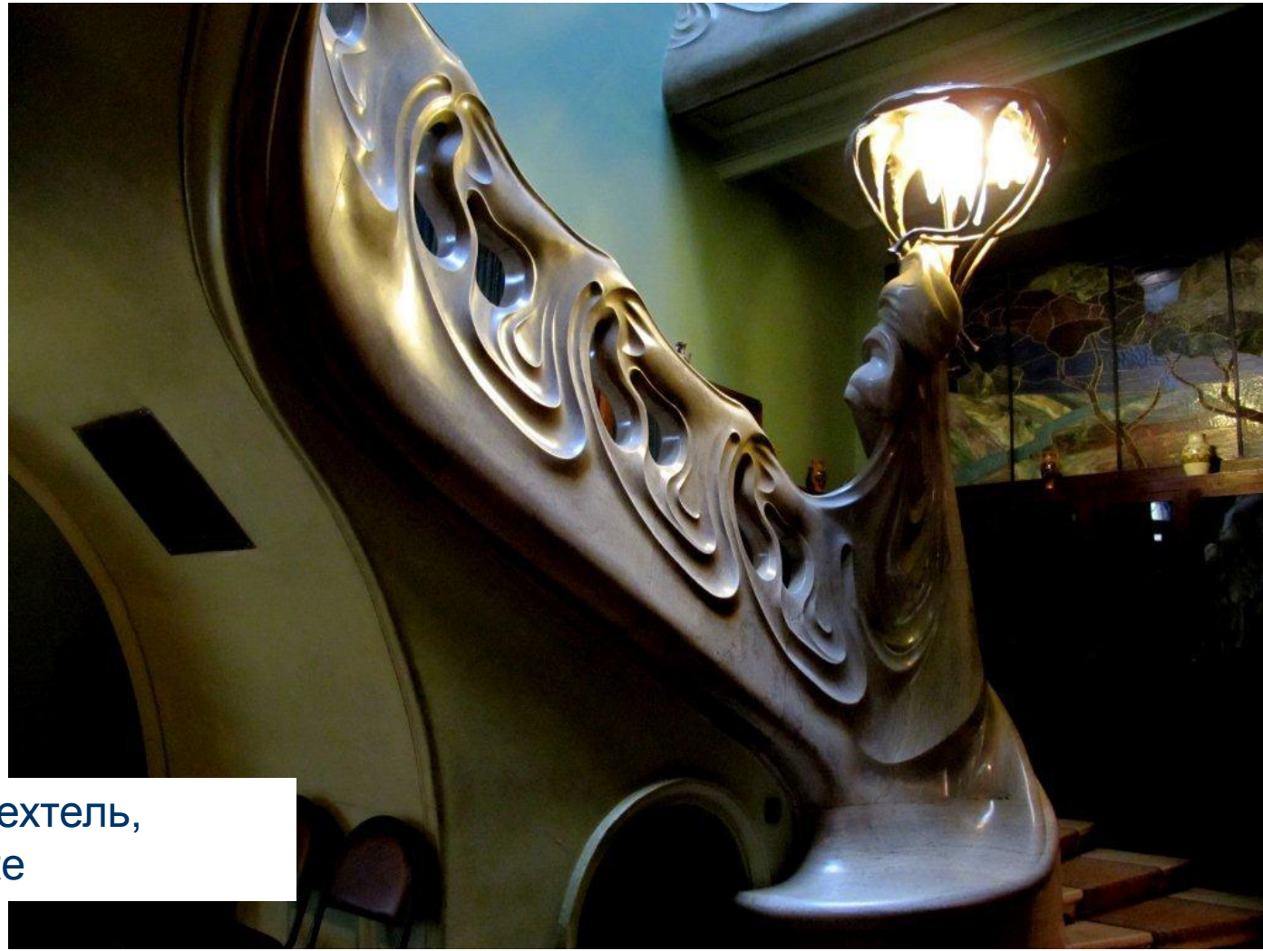
Фёдор Осипович Шехтель, лестница в особняке Рябушинского

Отличительными особенностями модерна являются отказ от прямых линий и углов в пользу более естественных, «природных» линий, интерес к новым технологиям, расцвет прикладного искусства.