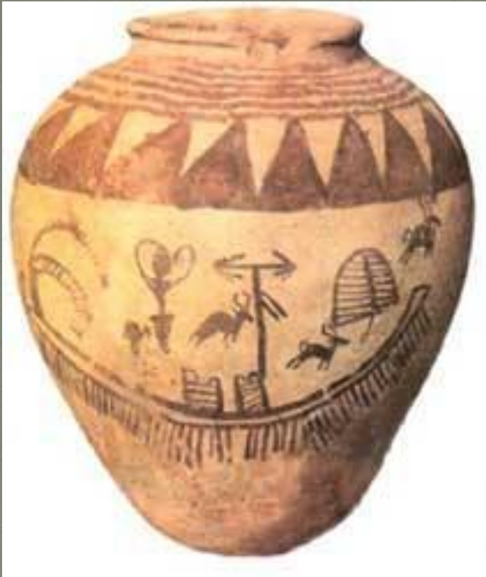
Горшок эпохи позднего неолита