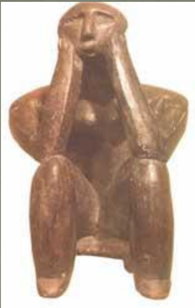
Терракотовая фигура из Чернаводы (Румыния)