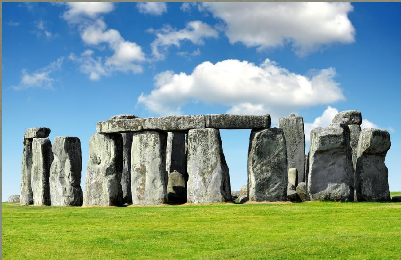
Стоунхендж. II тысячелетие до н. э. Солсбери. Англия.