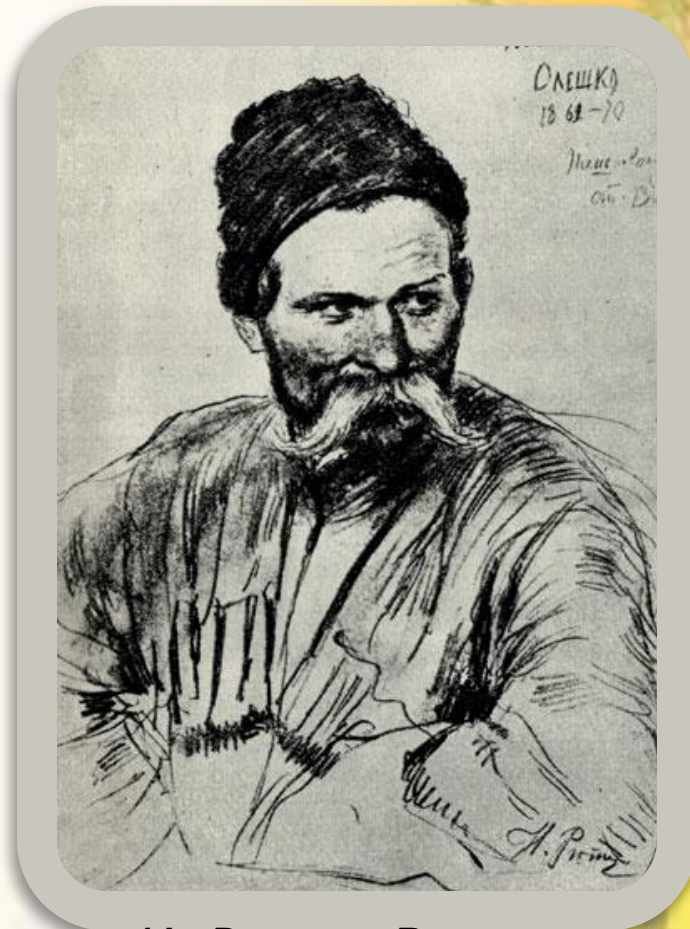
И. Репин. Василь Олешко. 1888