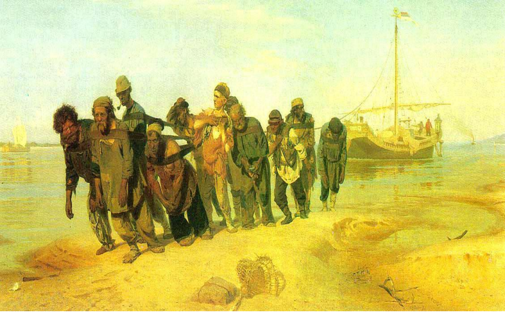
«Бурлаки на Волге».