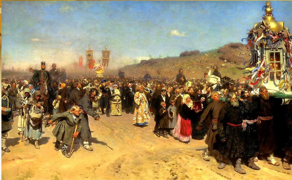
«Крестный ход в Курской губернии»