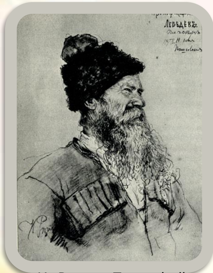
И. Репин. Прокофий Лебедев-пластун. 1888

Эту картину Репин писал тринадцать лет. (6-16 июня 1888 г.) художник приехал на Кубань. В станице Пашковской нашлись типажи для картины. Чубами, усами и повадками околдовали художника жители Пашковского куреня.