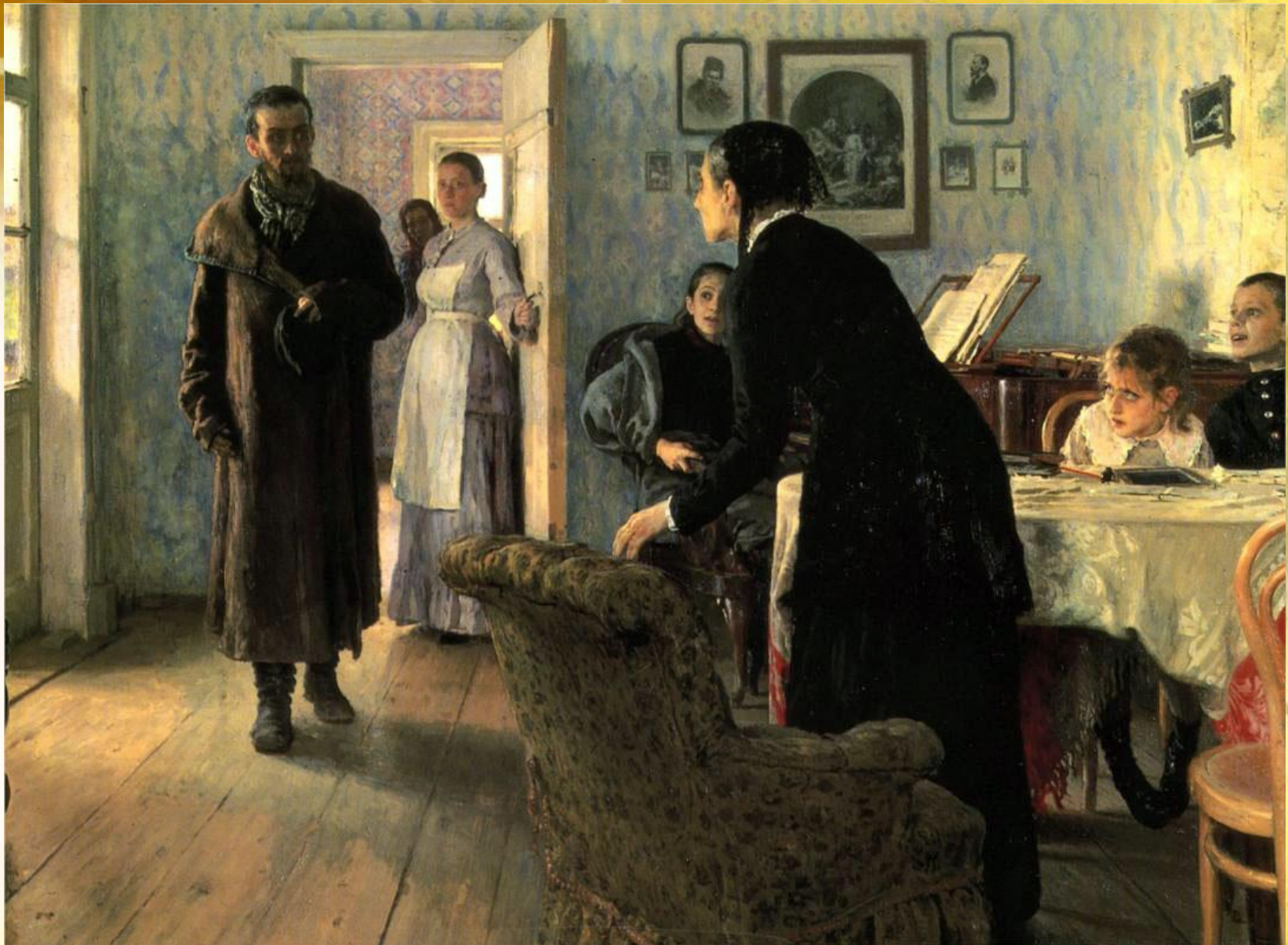
Картину «Не ждали» Репин написал в 1884-1888 гг. Сейчас она находится в собрании Третьяковской галереи Москвы.