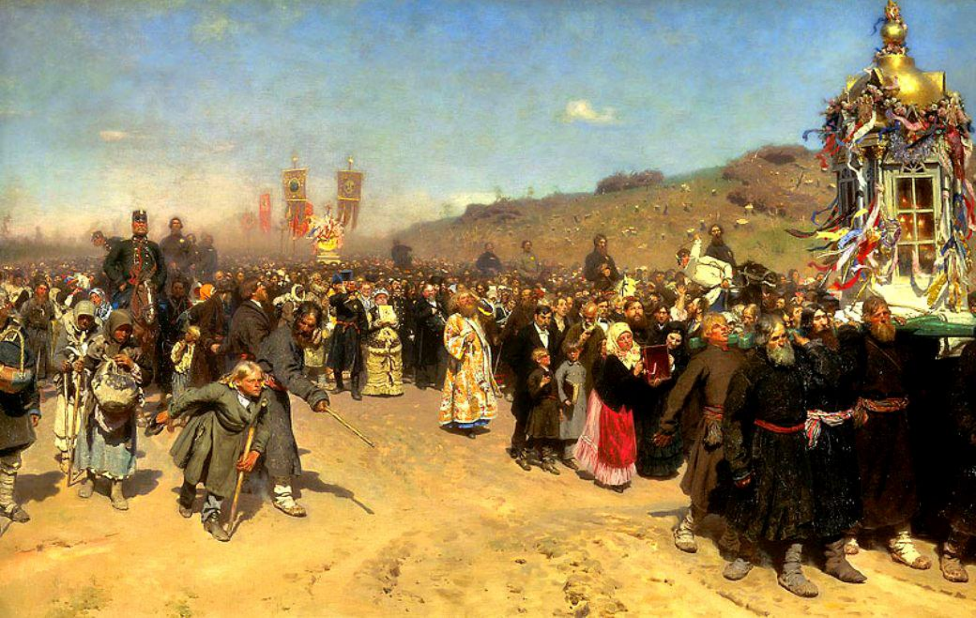
«Крестный ход в Курской губернии»