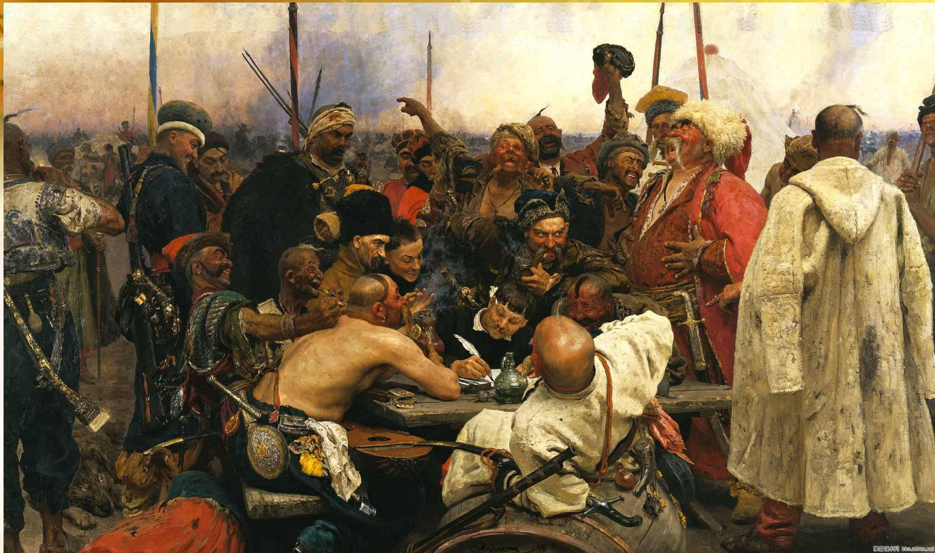
Илья Ефимович Репин Запорожцы пишут письмо турецкому султану 1878–1891