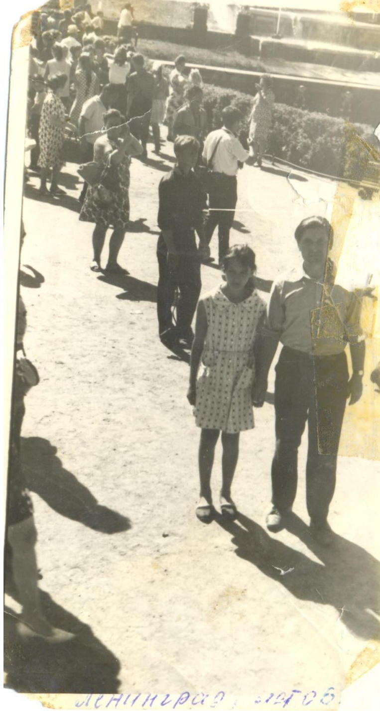
ЛЕНИНГРАД, 1950 г.