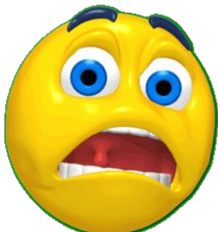
4 СТРАХ ИСПУГ