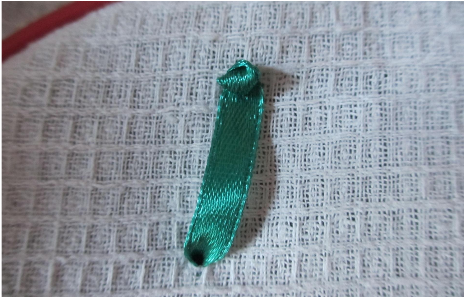
Фото № 7

2. Протяните ленту на изнаночную сторону и, подтягивая её, сформируйте завиток, (фото №7)