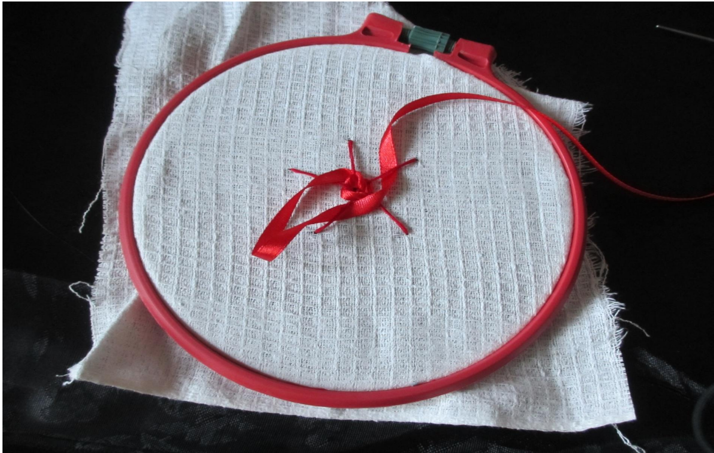
Фото № 5

5. Продолжайте протаскивать ленту под и над лучами, пока не образуется роза, и не закроются все нитки основы. Витки должны быть равномерными и воздушными. Для того чтобы цветок получился объёмнее и выразительнее, ленту можно слегка перекручивать.