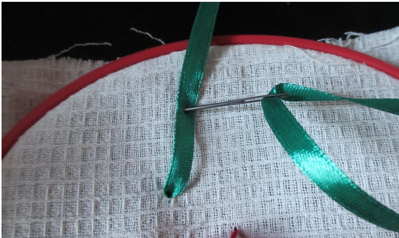
Фото № 6