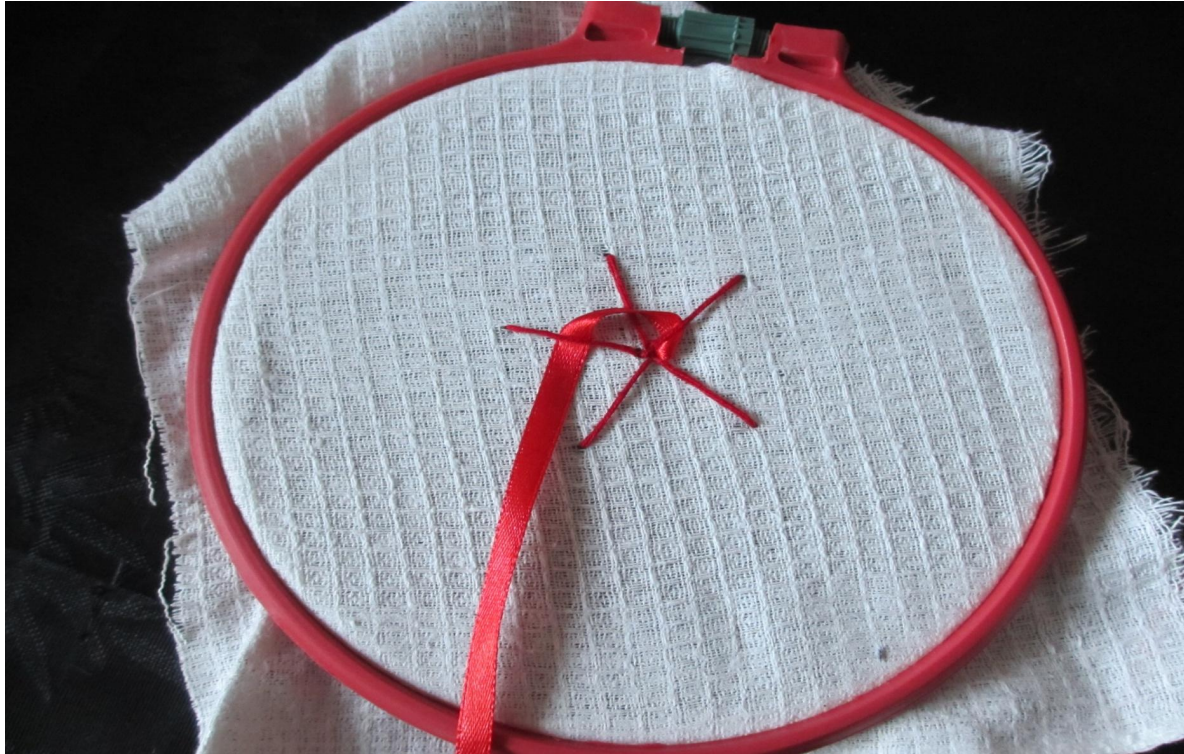
Фото № 4

4. Накрывая третий луч, протяните иголку с лентой под четвертым, (фото № 4)