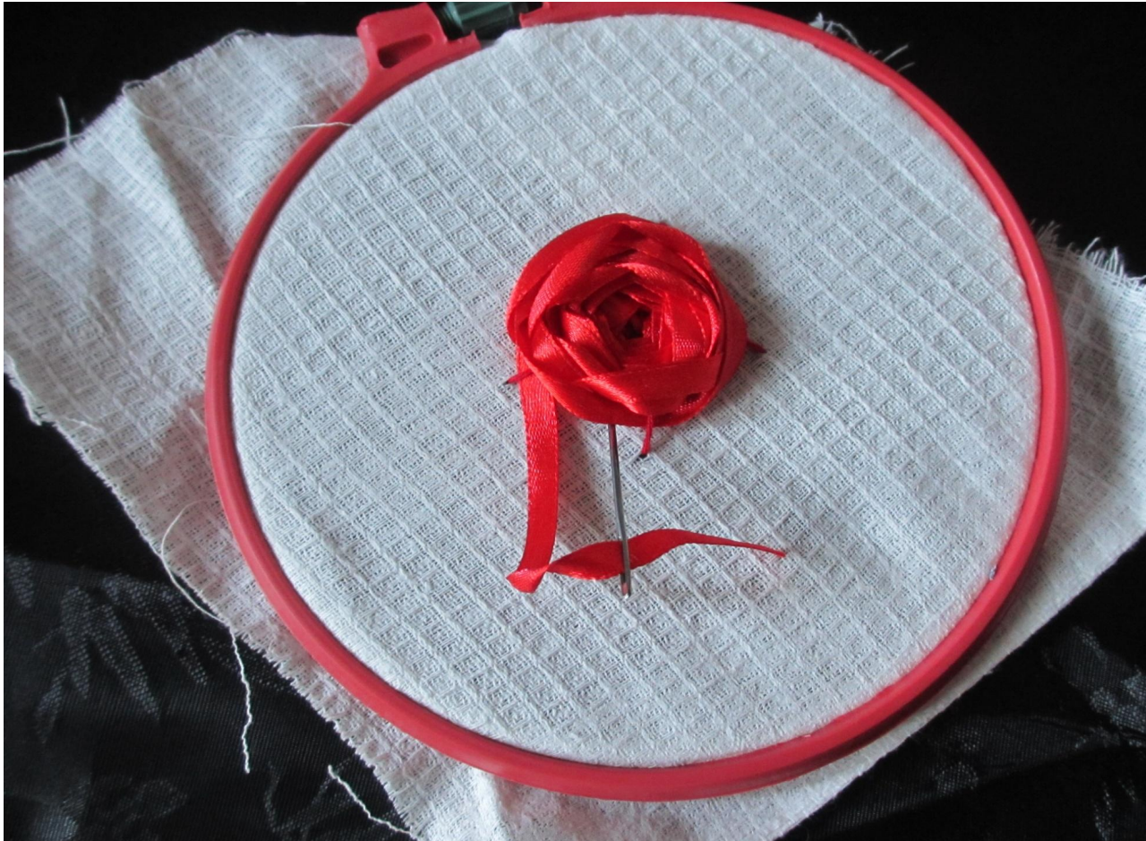
Фото № 5

После того как образовалась роза, вколите иглу под стежками и протяните ленту на изнаночную сторону и закрепите её, (фото № 5)