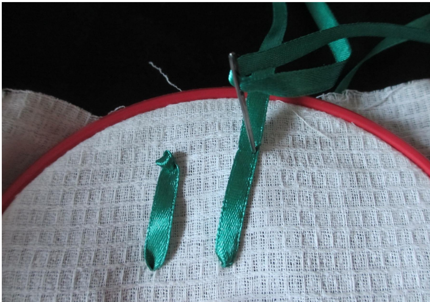
Фото № 8

3. Для того чтобы завиток получился смещённым, остриё иглки вколите в правый или левый край ленты, (фото №8)