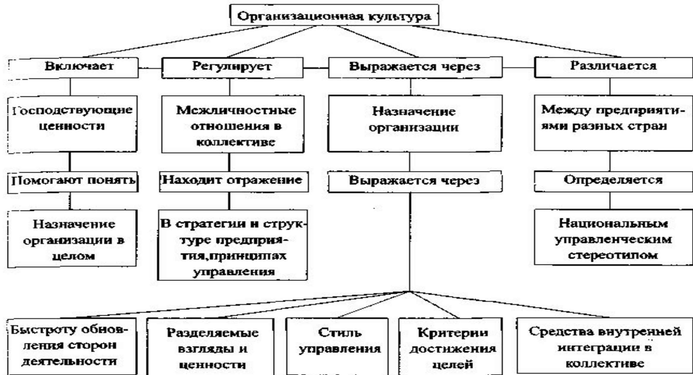
Рис. 9. Денотатный граф для понятия «организационная культура»