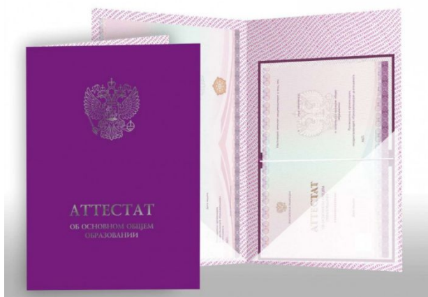
Аттестат об основном общем образовании

Аттестат об основном общем образовании и приложение к нему выдаются лицам, завершившим обучение по образовательным программам основного общего образования и успешно прошедшим государственную итоговую аттестацию