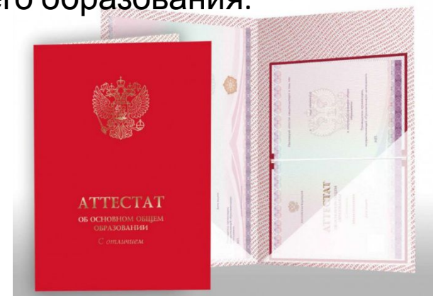
Аттестат об основном общем образовании с отличием

Аттестат об основном общем образовании с отличием и приложение к нему выдаются выпускникам 9 класса, завершившим обучение по образовательным программам основного общего образования, успешно прошедшим государственную итоговую аттестацию (без учета результатов, полученных при прохождении повторной государственной итоговой аттестации) и имеющим итоговые отметки "отлично" по всем учебным предметам учебного плана, изучавшимся на уровне основного общего образования.