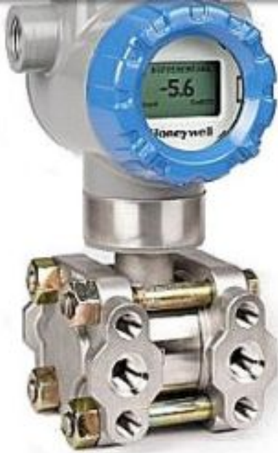
Рисунок 1. В датчиках перепада давления STD800 применяется проверенный на практике пьезорезистивный измерительный элемент