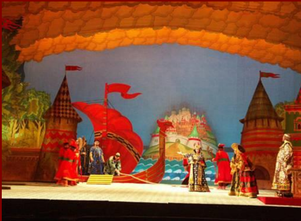
Сказка о царе Салтане