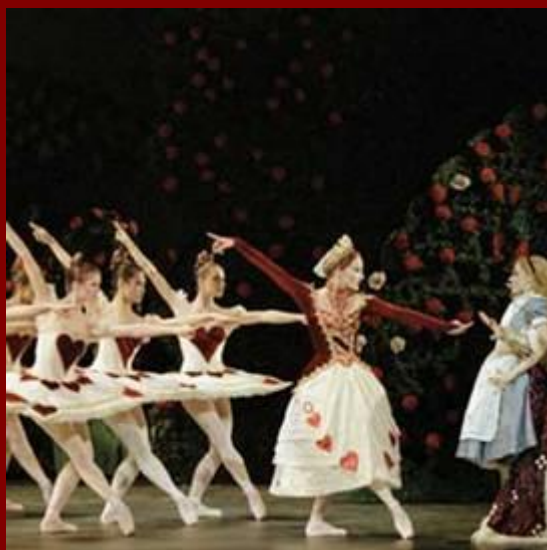
Алиса в Стране Чудес

Много замечательных опер и балетов поставлено по сказкам.