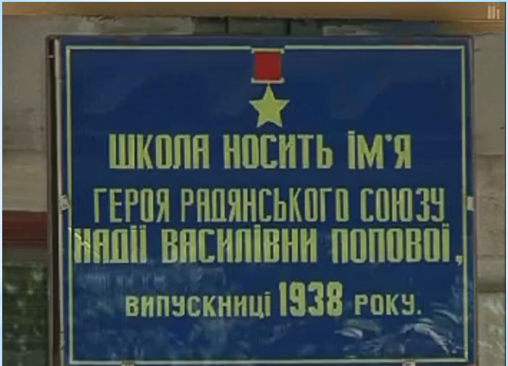
Донецкая школа №132 носит имя Надежды Поповой