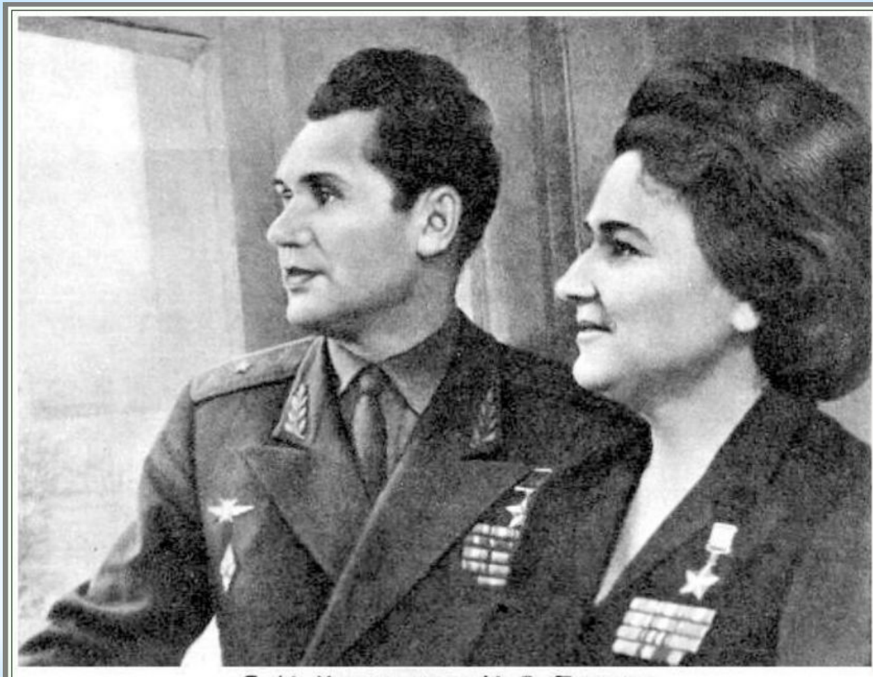
Сёмен Харламов и Надежда Попова

..По окончании войны Н.В. Попова вышла замуж за Героя Советского Союза лётчика-истребителя 82-го истребительного полка С. И. Харламова, и прожила с ним 45 лет.