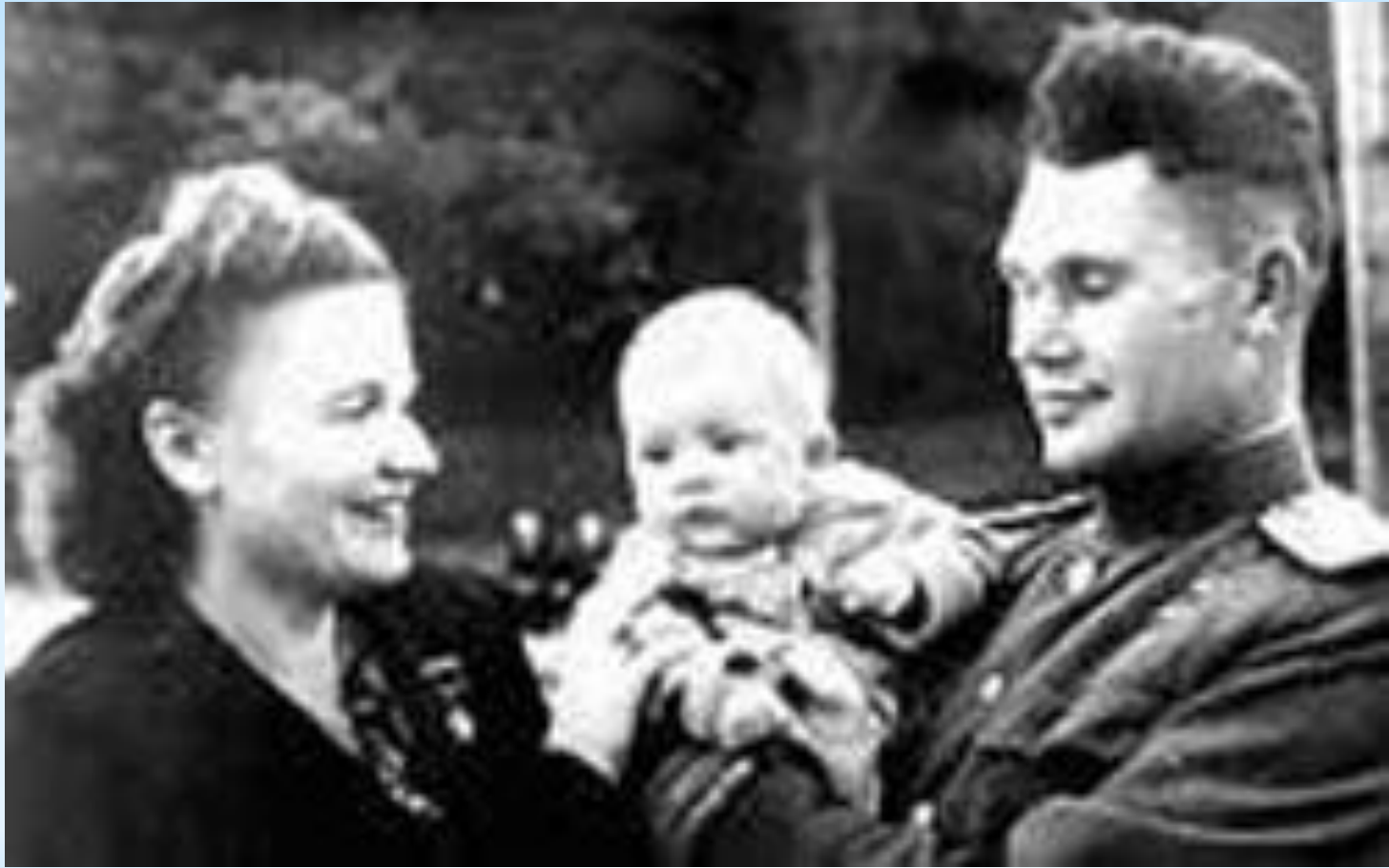
Фото семьи с сыном