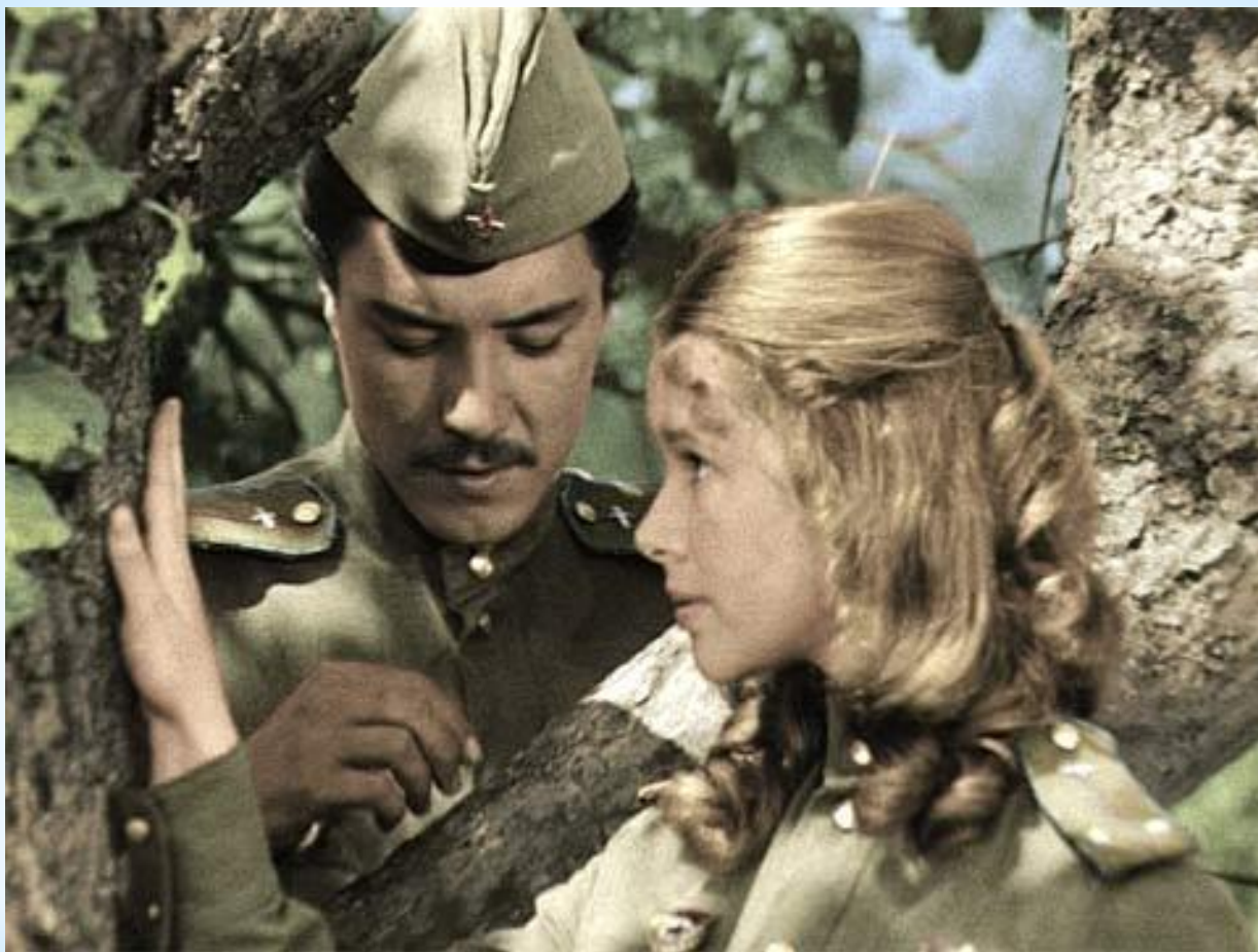
Кадр из фильма «В бой идут одни старики»

..История любви Нади и Сёмена стала прообразом влюблённых Маши и Ромео из фильма Леонида Быкова «В бой идут одни старики», а подвиг жёницин-лётчиц отражён в фильме «Небесные ласточки».