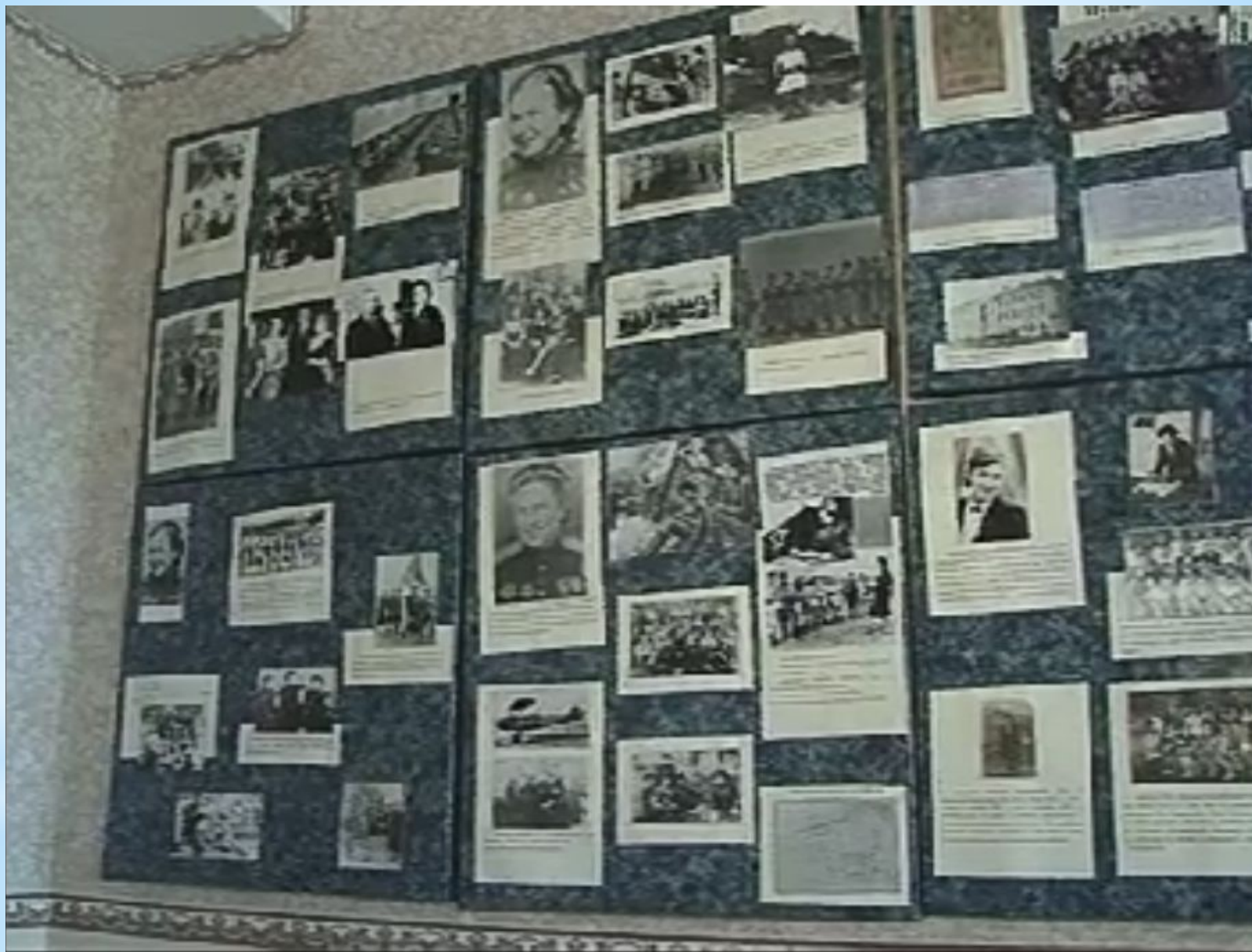
Музей Донецкой школы №132