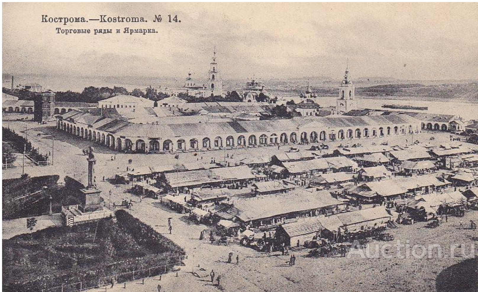
Кострома.—Kostroma. № 14. Торговые ряды и Ярмарка.