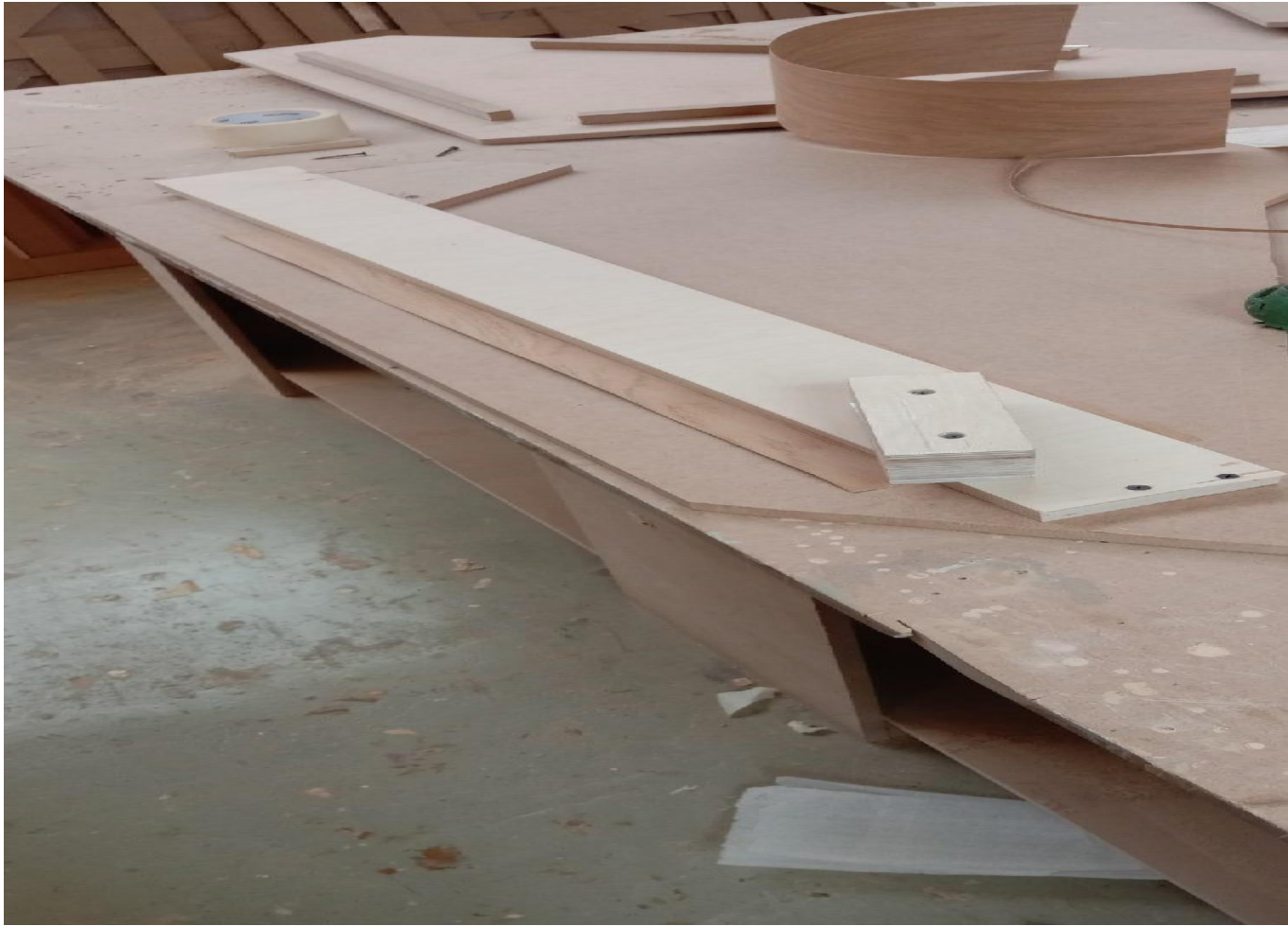
Нарезка дубового шпона с помощью резака