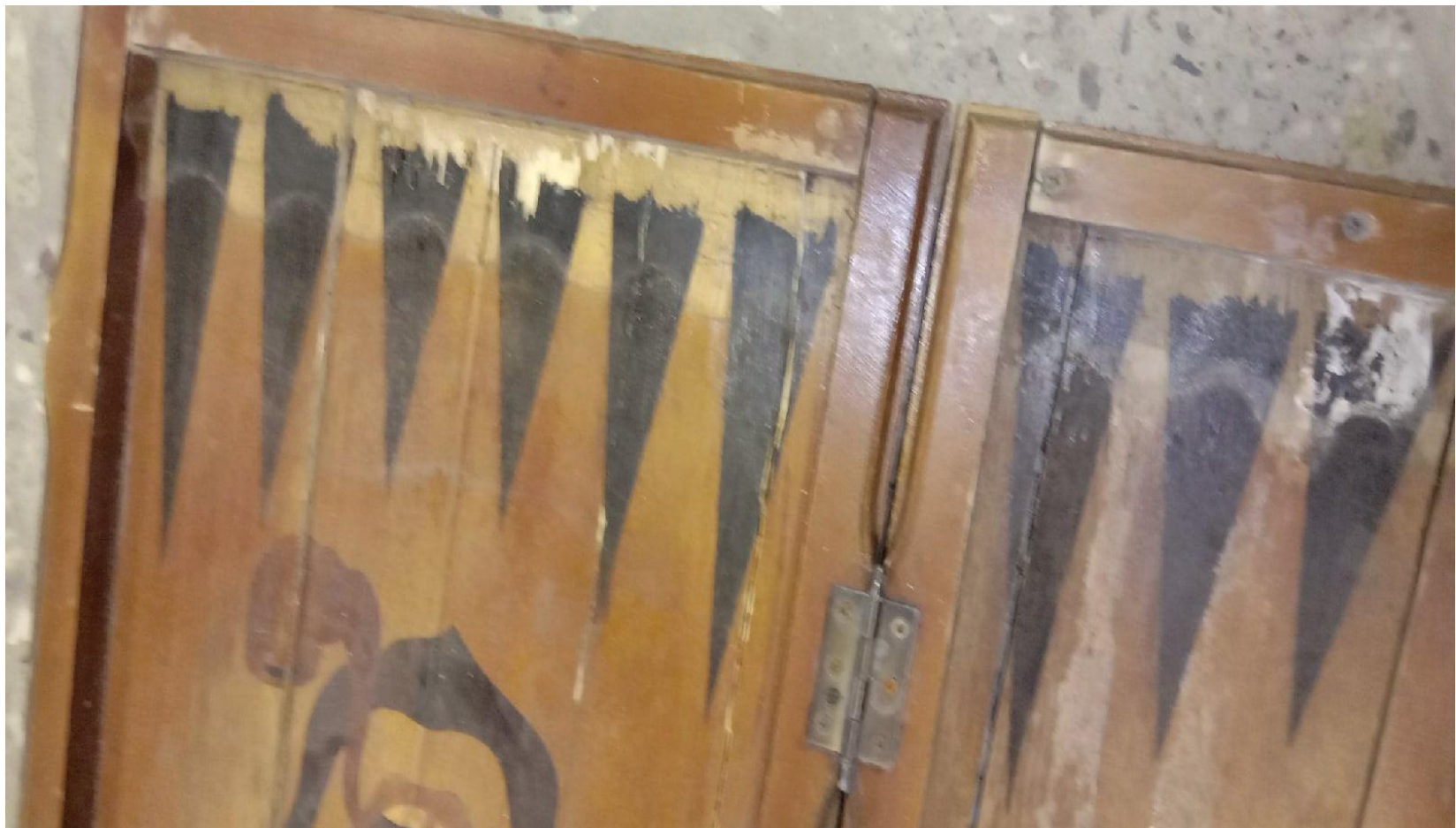
Водяные подтёки и утрата шпона