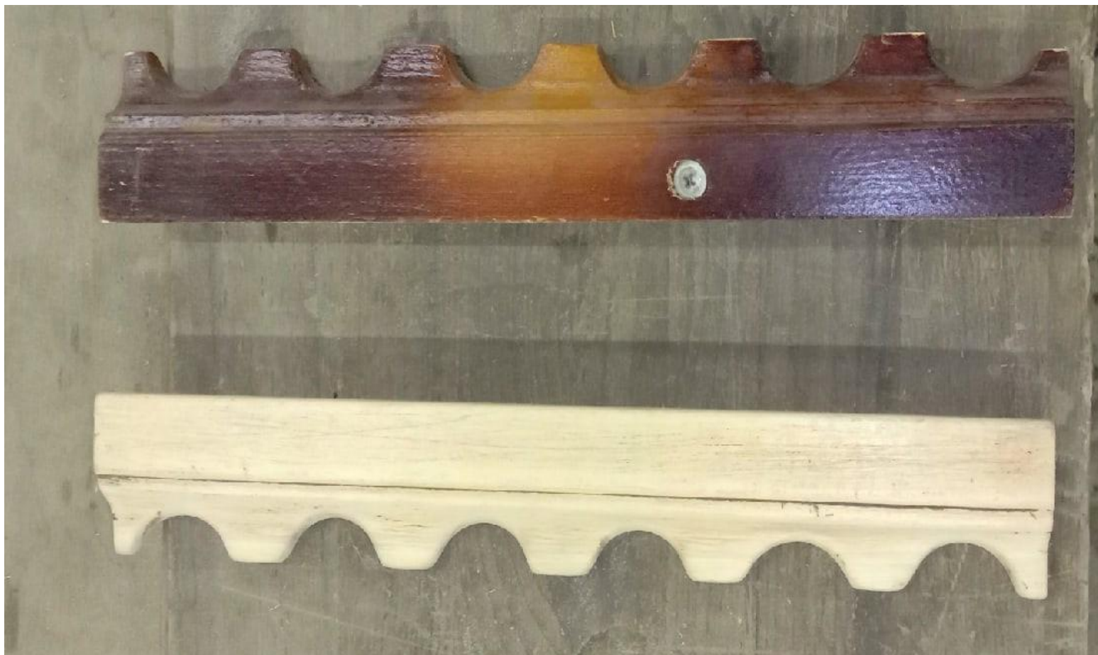
Дифекты планок из за грубого ремонта