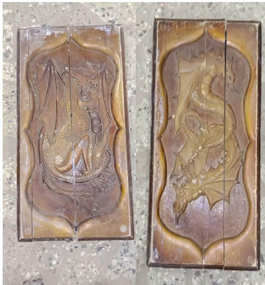
Фасадные створки нарда