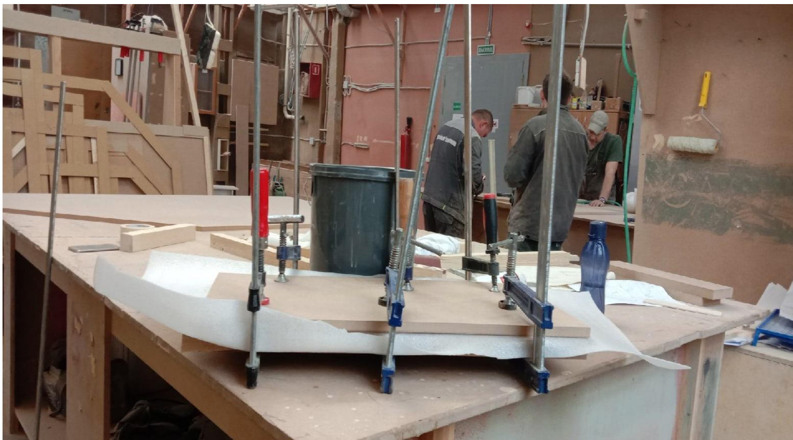
Приклеивание шпона к фасаду нарда