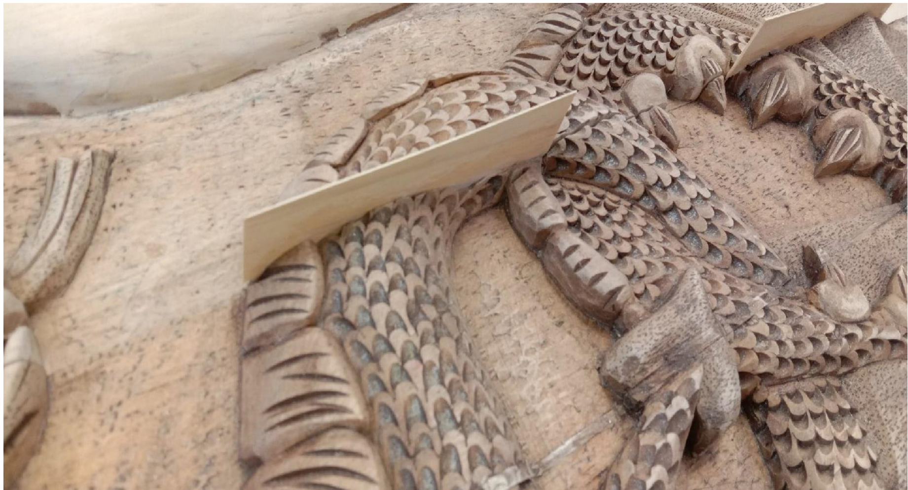
Шпонирование трещин фасада