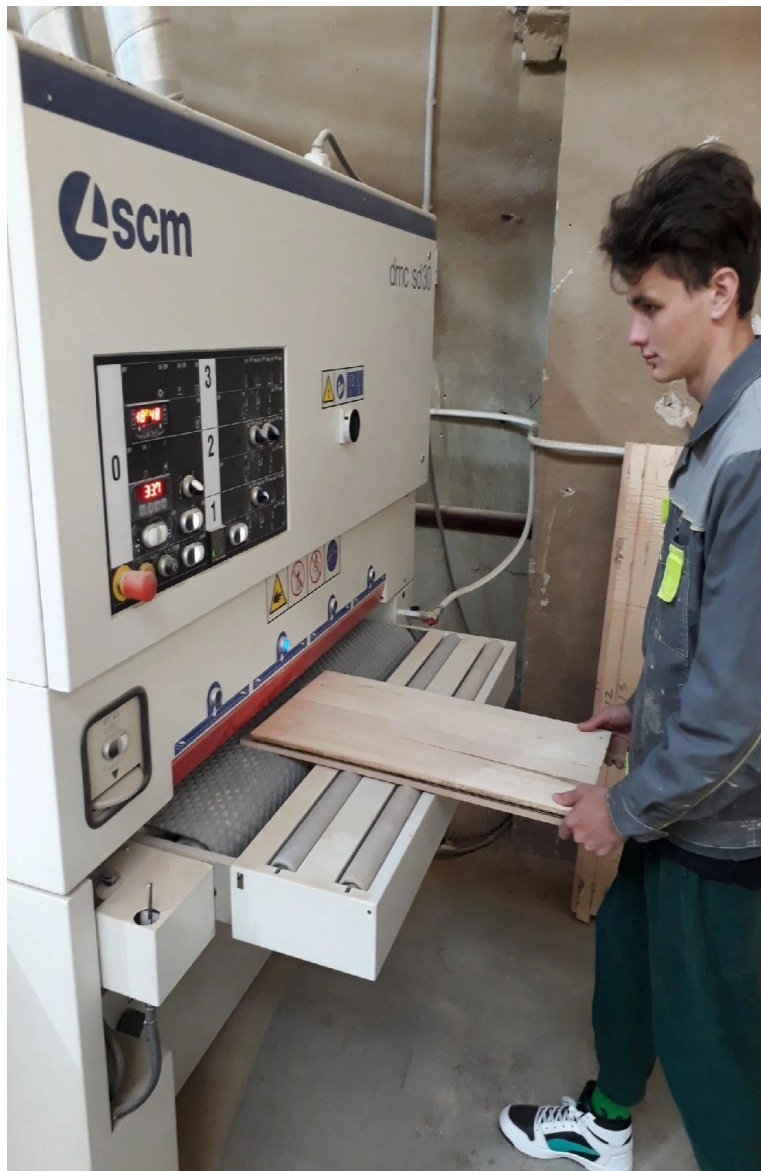
Колибровка внутренней части фасадов