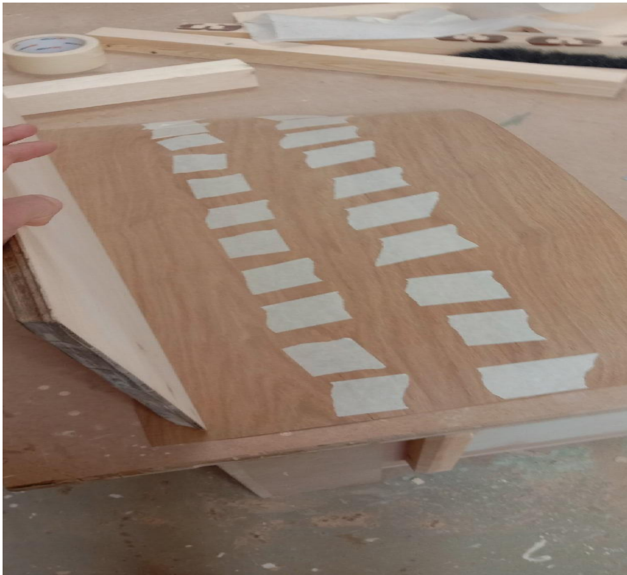
Склейка полос шпона