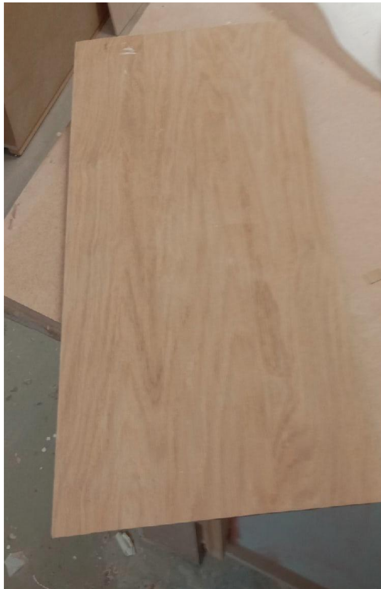
Итоговый результат наклейки шпона