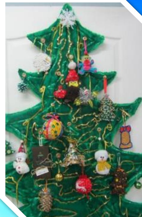
Конкурс «Новогодняя игрушка»