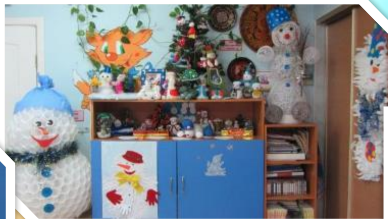
Конкурс «Наш веселый Снеговик»