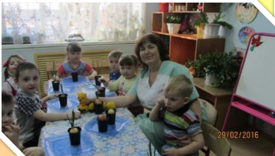
Экспериментируем и проводим опыты