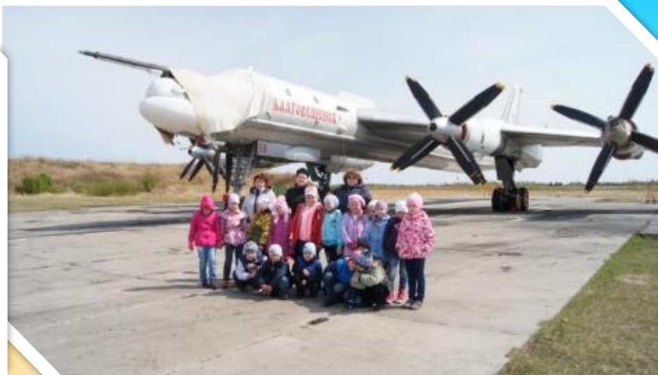
«Здесь служат наши папы» на экскурсии