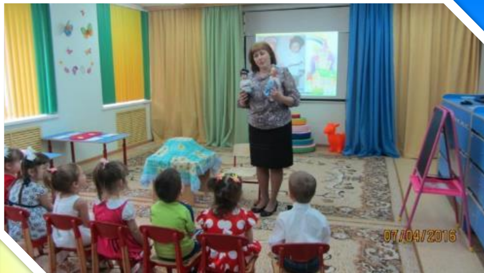
Открытый показ НОД по гендерному воспитанию «Ванечка и Манечка в гостях у ребят»