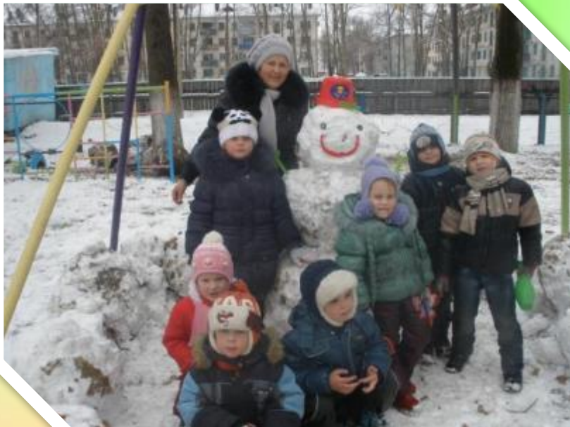
Наш Снеговик самый добрый и веселый!